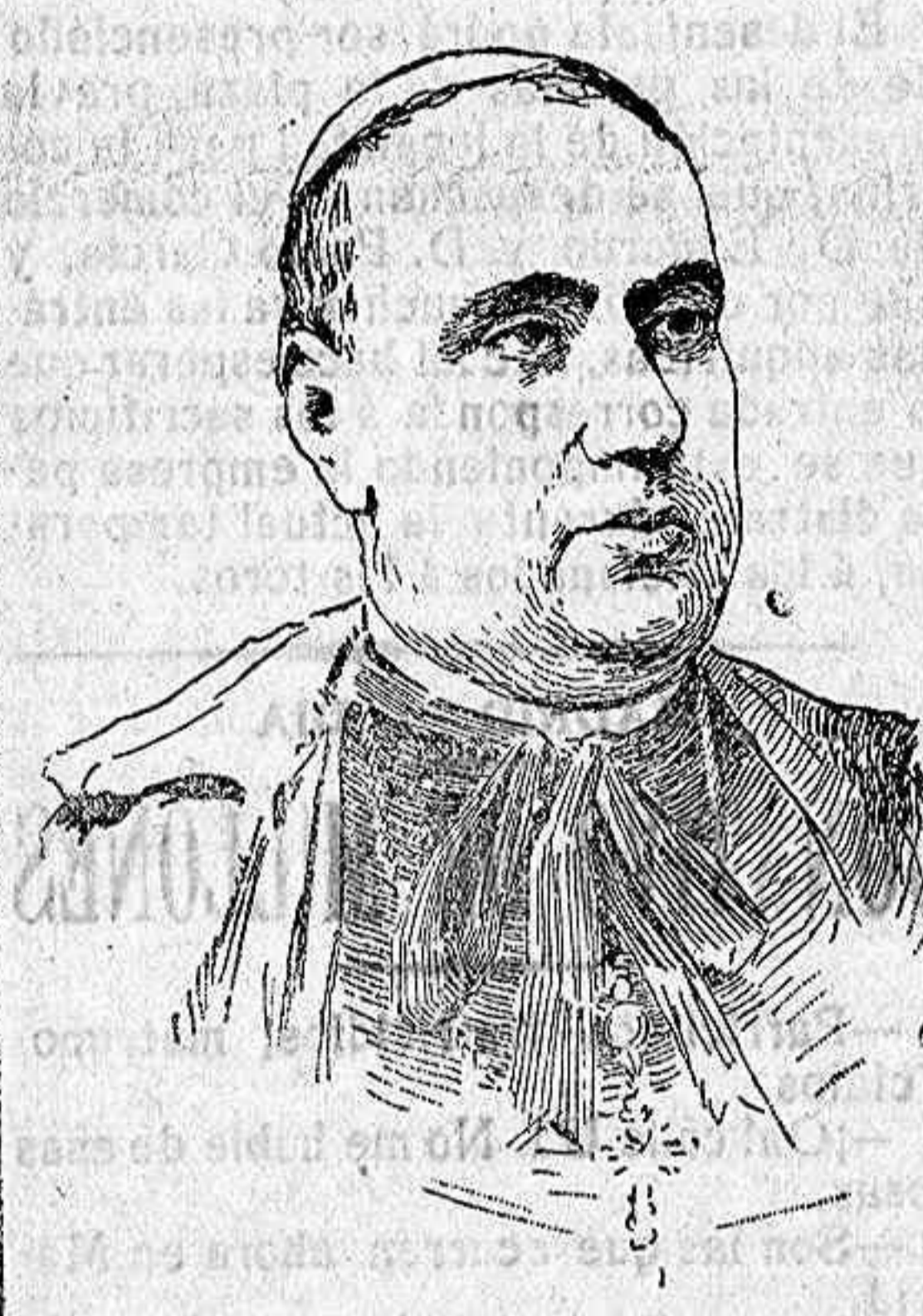
Nuestro ilustre paisano el Cardenal Almaraz, que se encuentra en esta de paso para la Asamblea de Ledesma.

La entrada será pública, y se suplica a las señoras se provean de velas para la procesión.