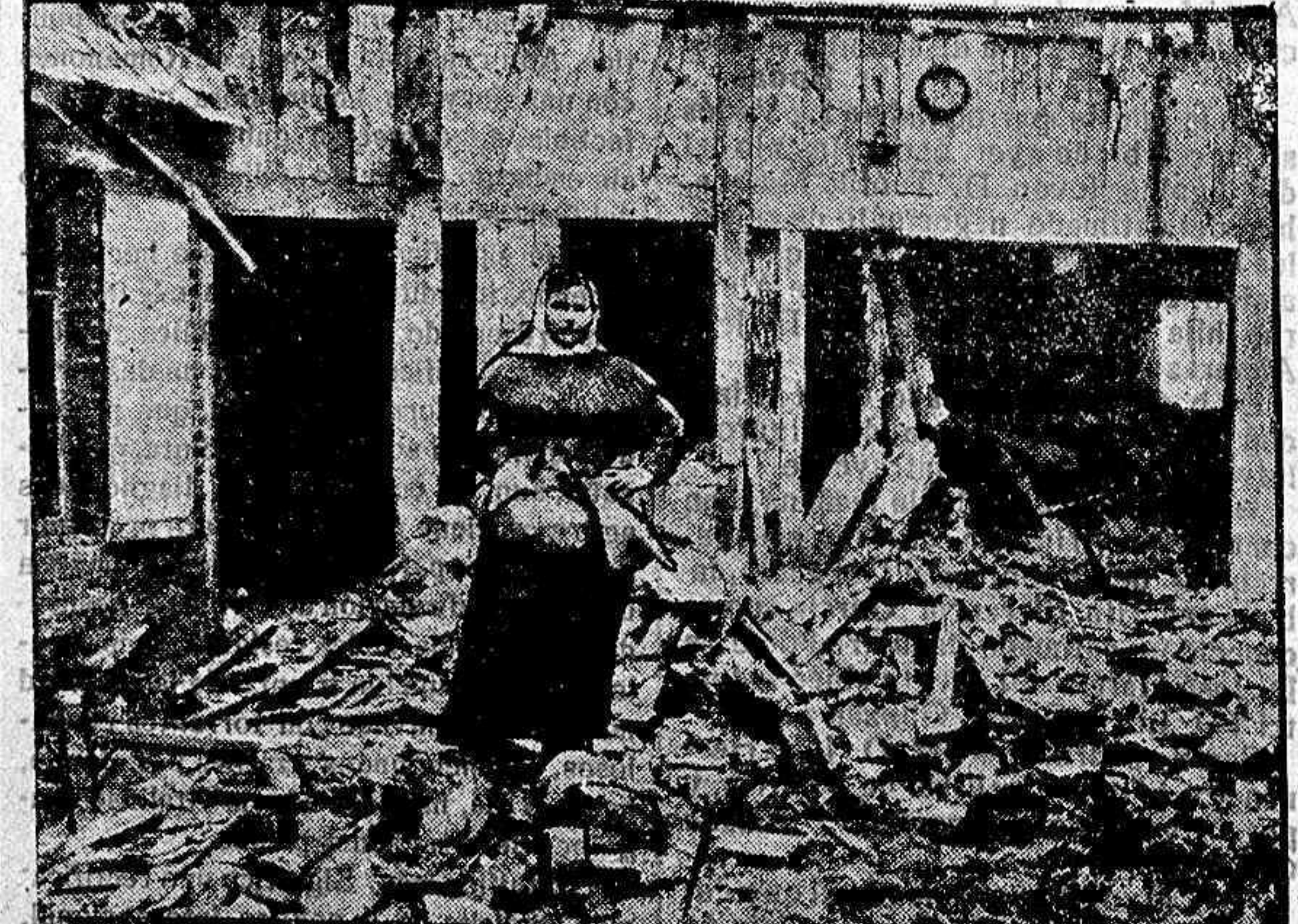
Notas gráficas de la guerra.—Los estragos de la retirada alemana. (Foto-Infomación).

Enfermedades del pecho. Tuberculosis. Curación de esta por los más modernos tratamientos específicos y de colapsoterapia. Consulta: de once a una.—Calle de Zamora, número 57, principal. 25-4