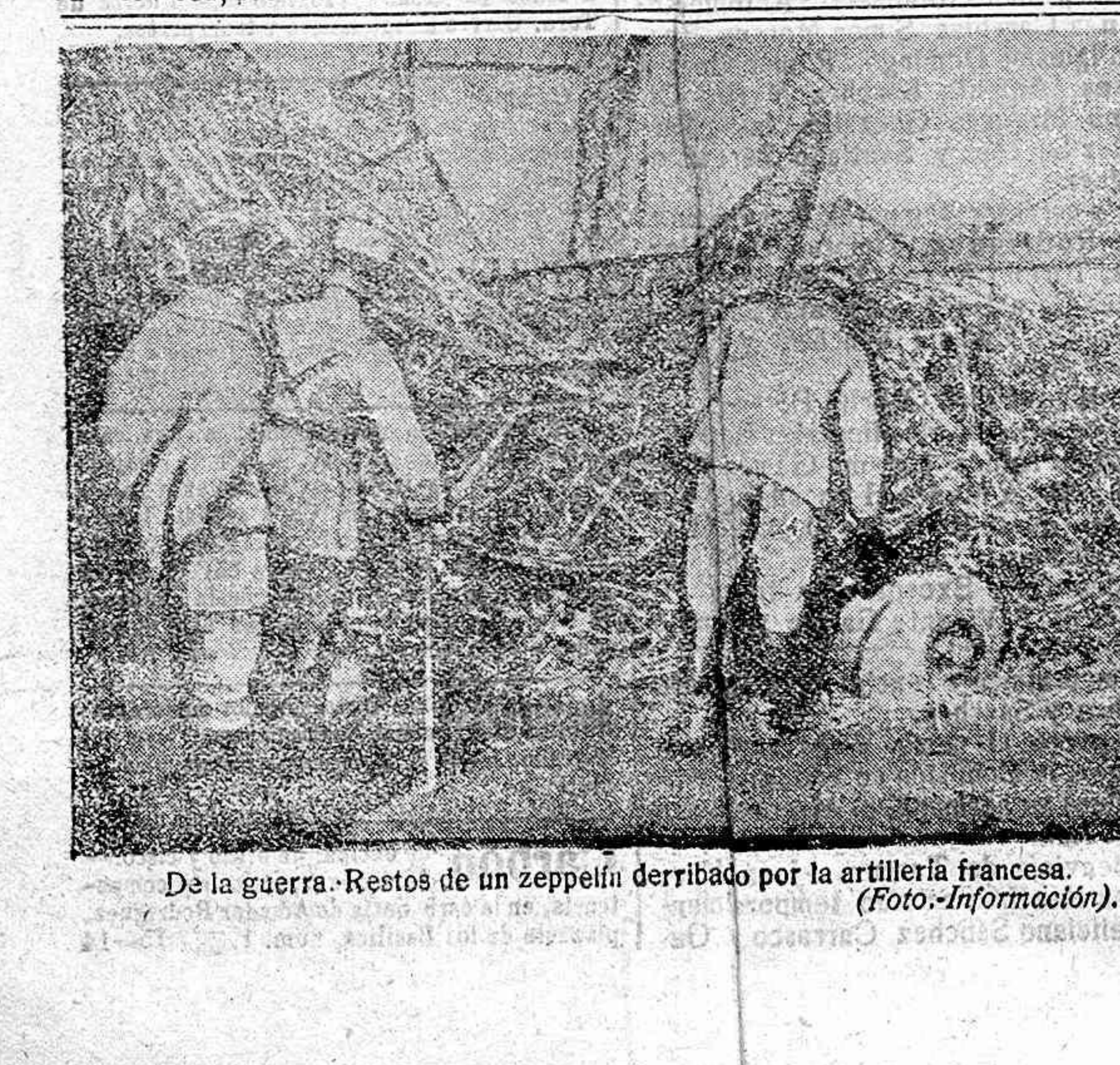
De la guerra. Restos de un zeppelin derribado por la artillería francesa. (Foto-Infomación).