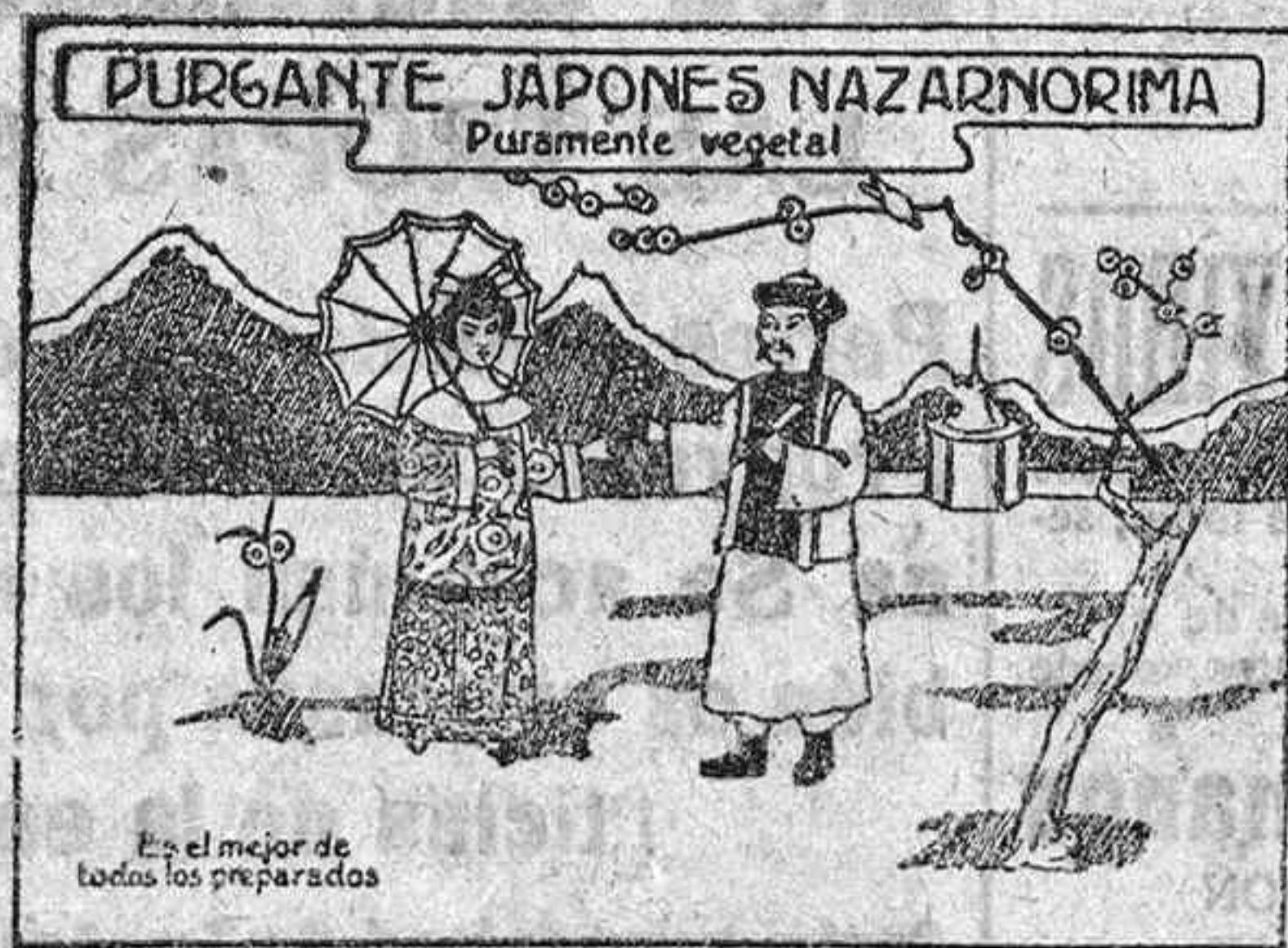
LEGITIMO ENVASE DEL PURGANTE JAPONES

DE VENTA EN LAS PRINCIPALES FARMACIAS Y DROGUERÍAS