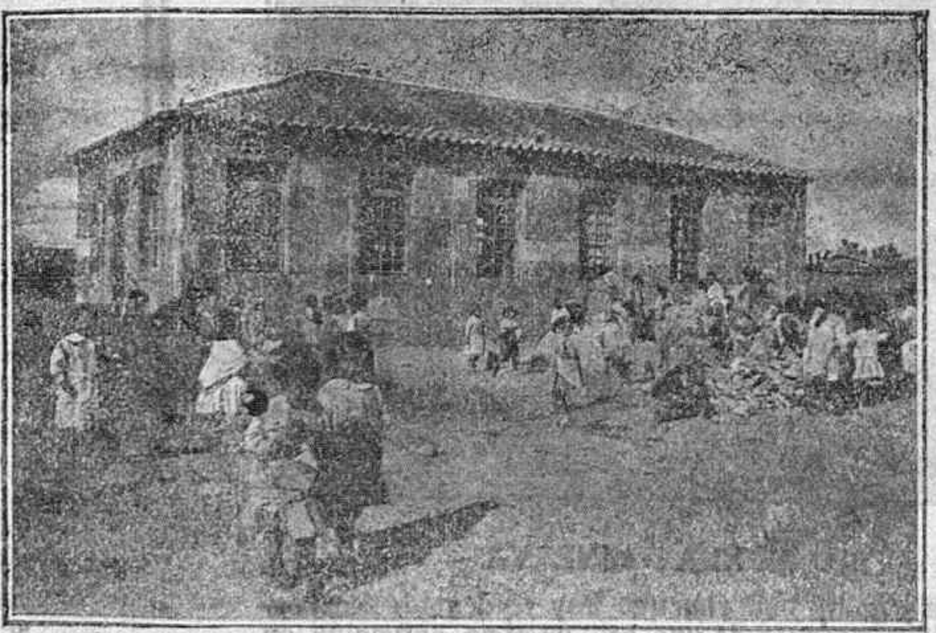
Edificio de la nueva escuela de Villoria.

— ¿Y dice usted? — Digo que este movimiento no es nuevo en el torrente poderoso de la acción católica, de frutos pirgües en otras naciones. Arranca de la memorable encíclica pontificia Reverentiarum , que cimentó a gran obra, la magnífica obra a realizar por el catolicismo. Delegada la función directiva en el Cardenal Primado de las Españas, este encomendó la gestión diocesana a los Prelados, encargándoles la excitación y el consejo para el fomento de estos institutos de tan complejos beneficios en los pueblos.