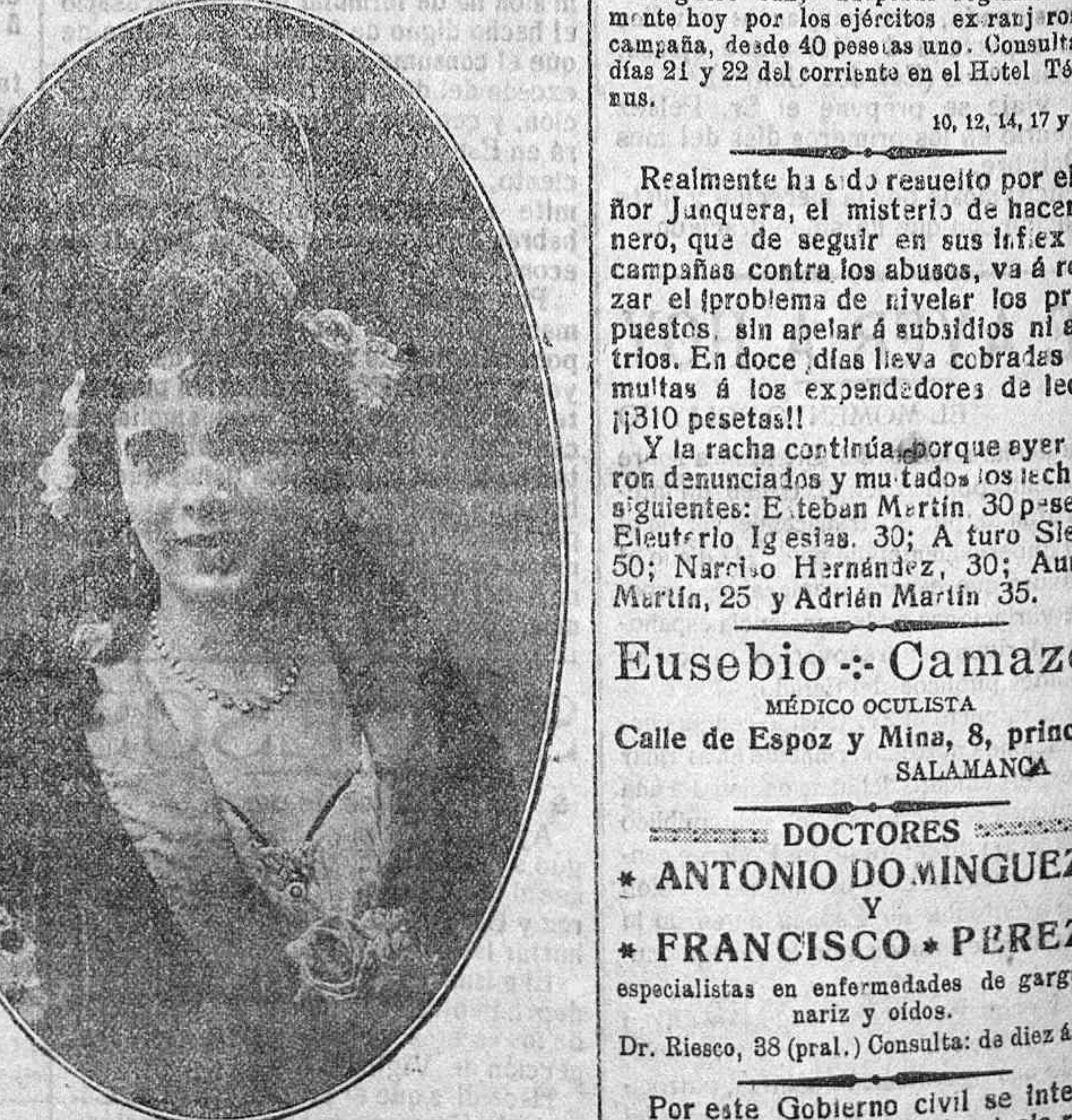
MONSERRAT MINERVA. Sin rival intérprete de canciones regionales, que también se despidе hoy del público del Moderno, donde ha obtenido un clamoroso éxito.