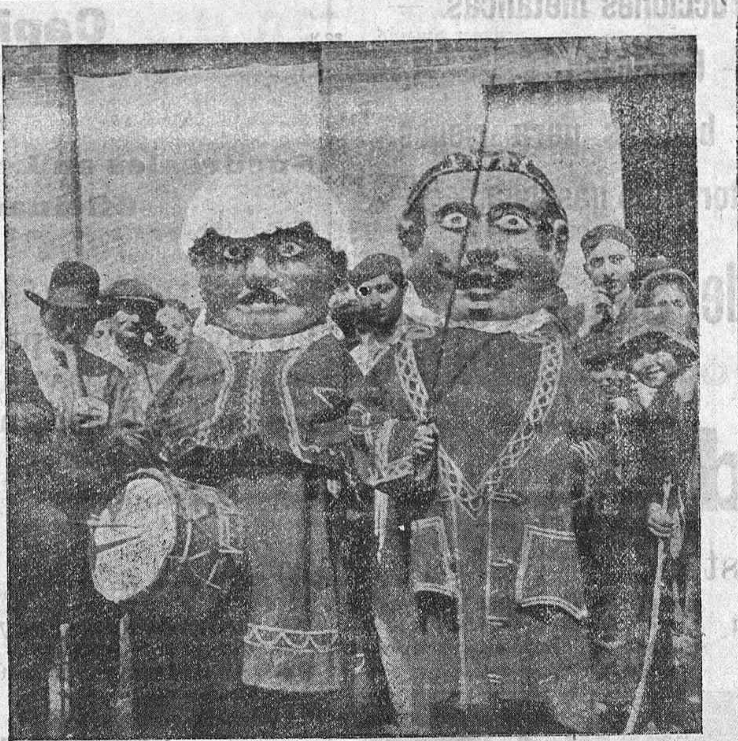
«La Lechera» y consorte. No hay más festejo oficial, que nos brinde nuestro Concejo. Y pasarán los años... vendrá otra era... Y en Septiembre, el consorte con «La Lechera».

EUQUILIBRIO cura RAQUITISMO Gotas inyectable sellos.