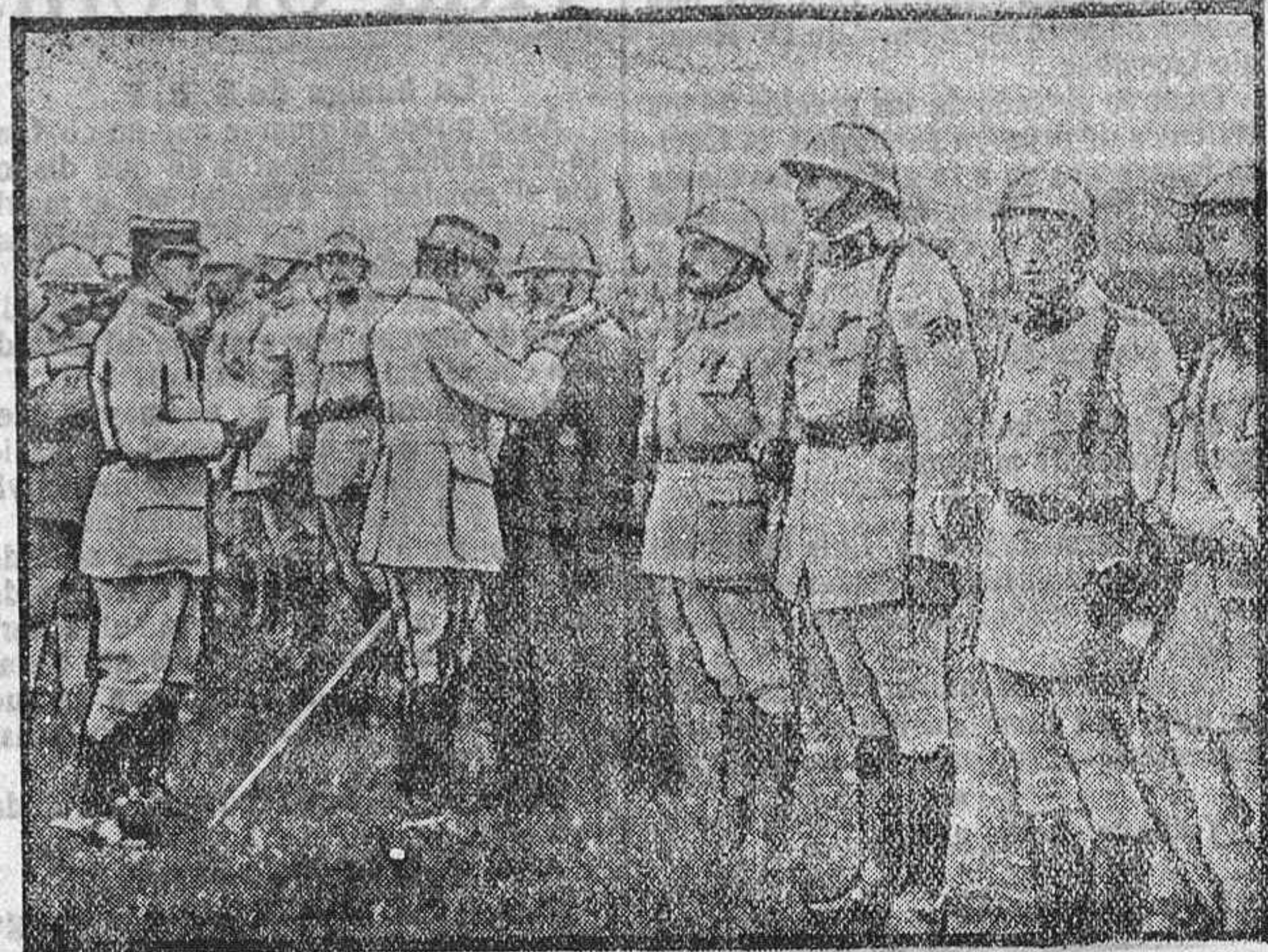
Notas gráficas de la guerra El capitán de una división recibiendo la Cruz de la Legión de Honor.