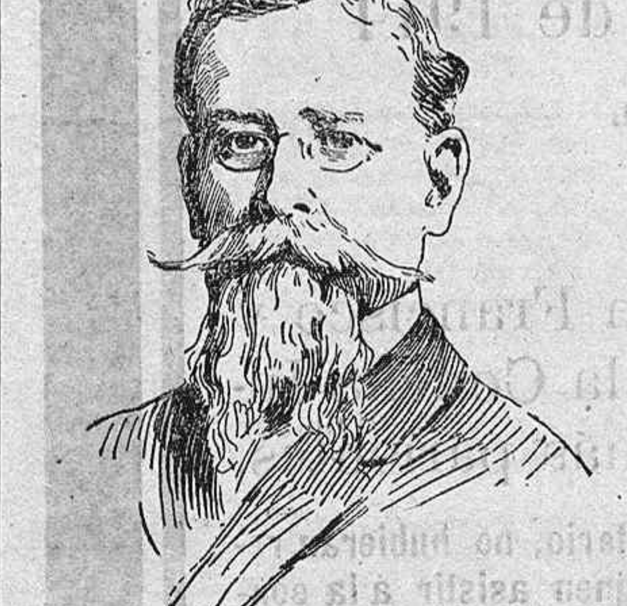
General Venustiano Carranza, que se ha unido al presidente Huerta, contra los Estados Unidos.