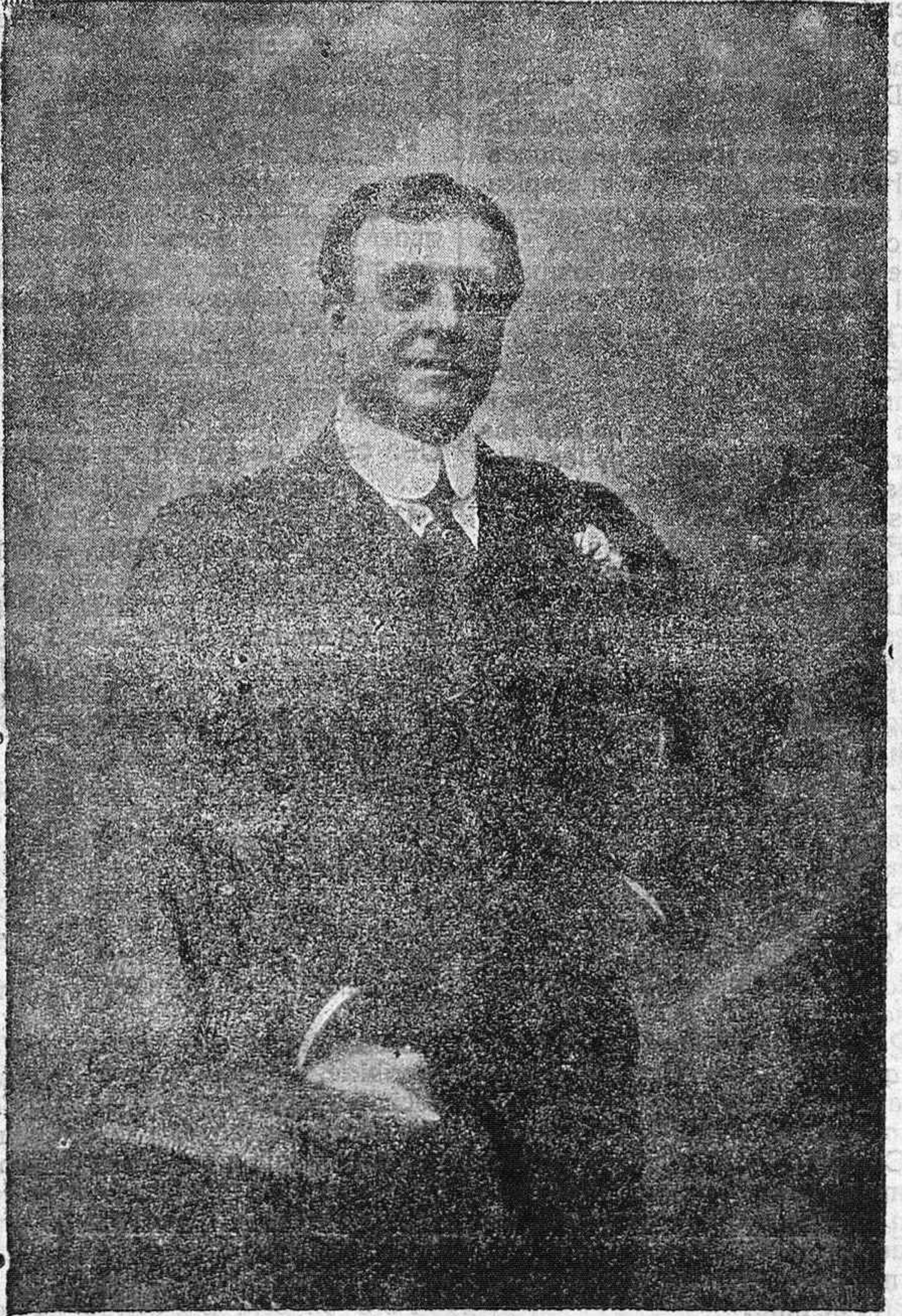
EL TEATRO EN FERIAS.—El eminente actor Enrique Borrás que debuta esta noche en el Liceo.

Los forasteros. Todos los trenes que ayer llegaron á esta conducción gran número de forasteros, haciendo presumir que en los días sucesivos la afluencia de visitantes superará quizás á las de otros años. La mayoría de los que ayer llegaron eran de gente forastera (y aunque no faltaban los charros, eran éstos, en su mayoría, los feriantes que venían al mercado de ganados). El ferial de ganados. Este presentaba ayer bastante más animación, pues el movimiento propio de estos mercados dejábase sentir con gran fuerza. Redújose el mercado al de ganado mular, y durante la mañana las transacciones fueron pocas, pero en las primeras horas de la tarde verificáronse bastantes. Los precios muy bajos, excesivamente