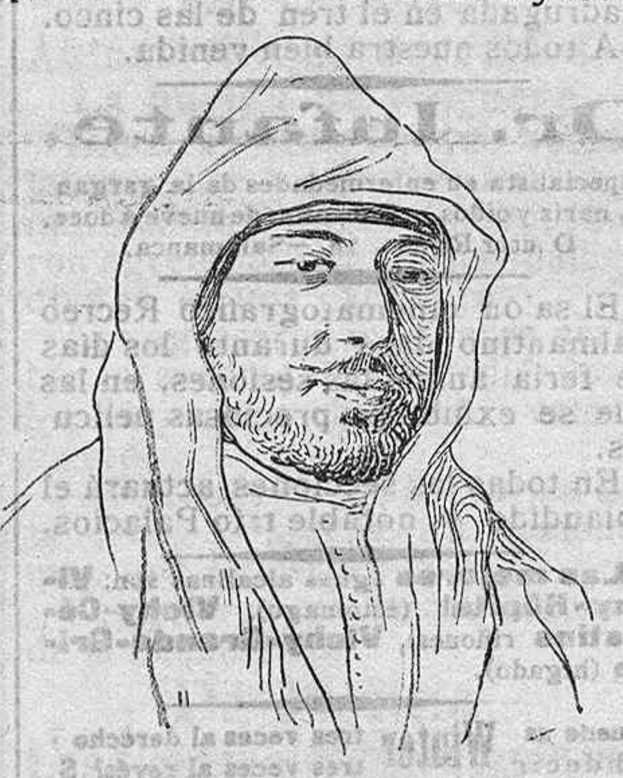
El ex-sultán Abdelaziz.

Dicen unos que Francia saca al ex sultán de su retiro de las afueras de Tánger, para que convenza á su amigo Muley Hiba de que debe depone la bandera de rebelión y abandonar el país.