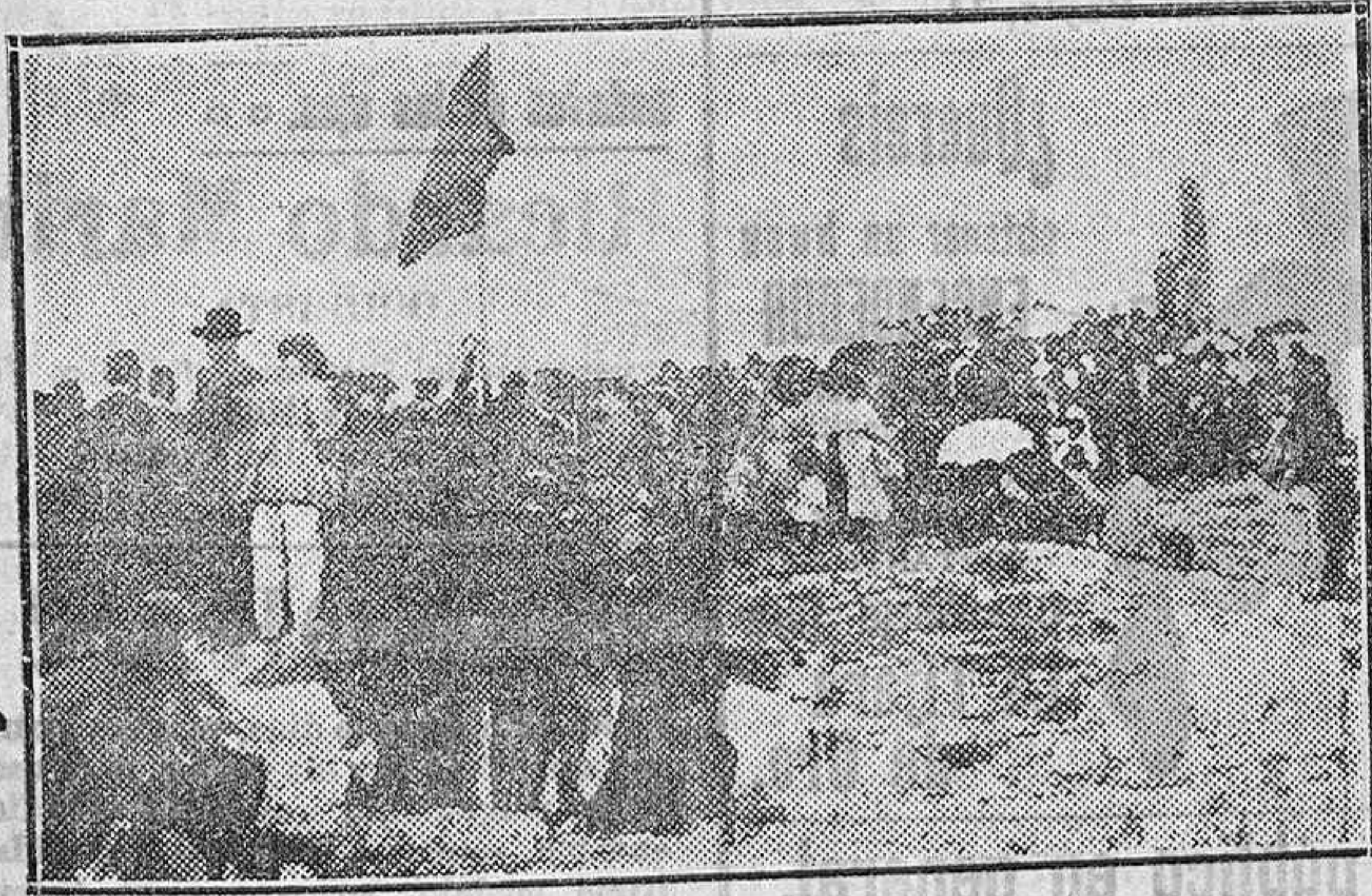
Momentos antes del descubrimiento de la lápida.