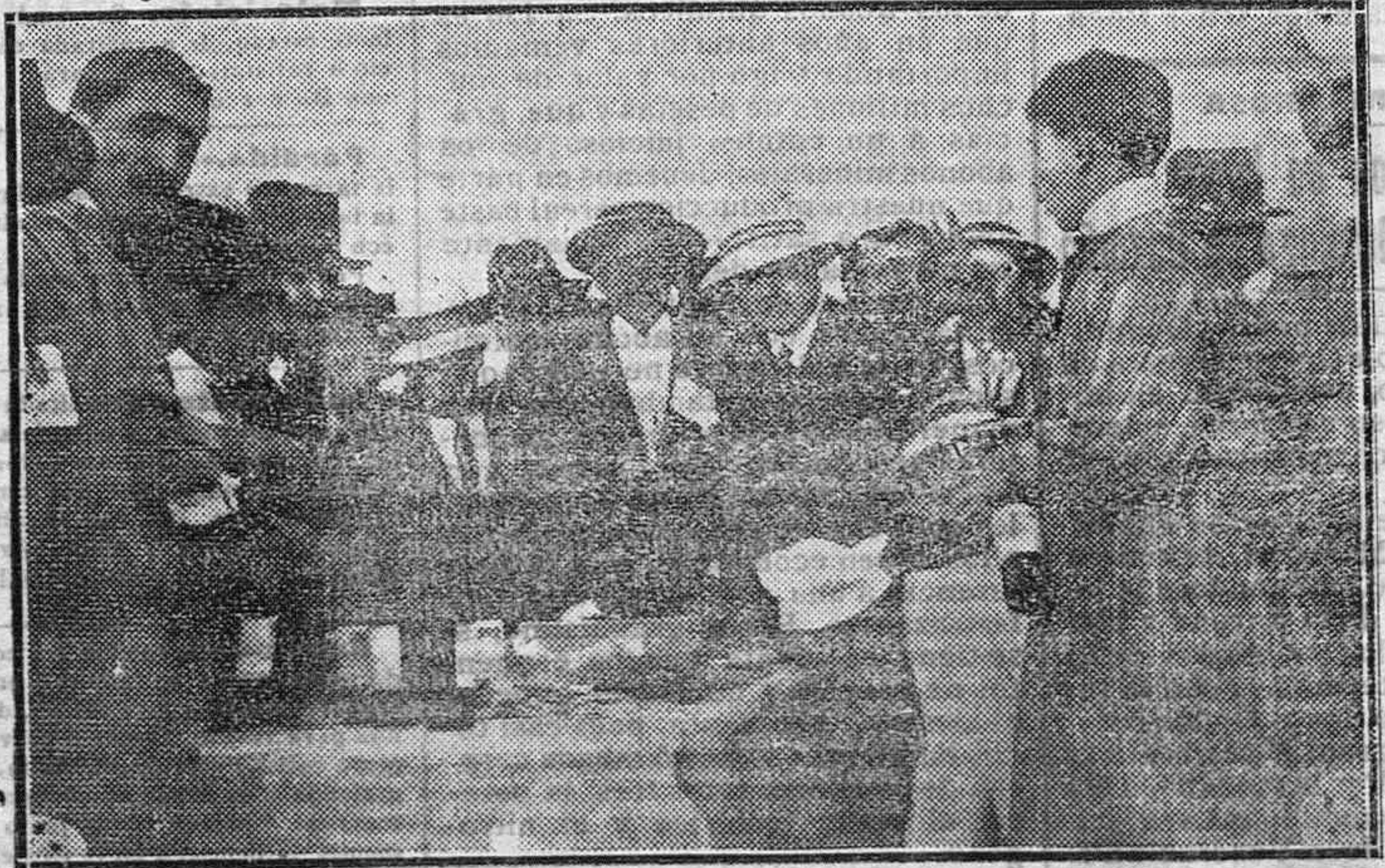
Distribuyendo las meriendas á los invitados de EL ADELANTO. (Fot. V. Gombau).

Consulta de enfermedades de y protesis dentaria Gabinete Odontológico de Ludilla Plaza Mayor, número 15, principi