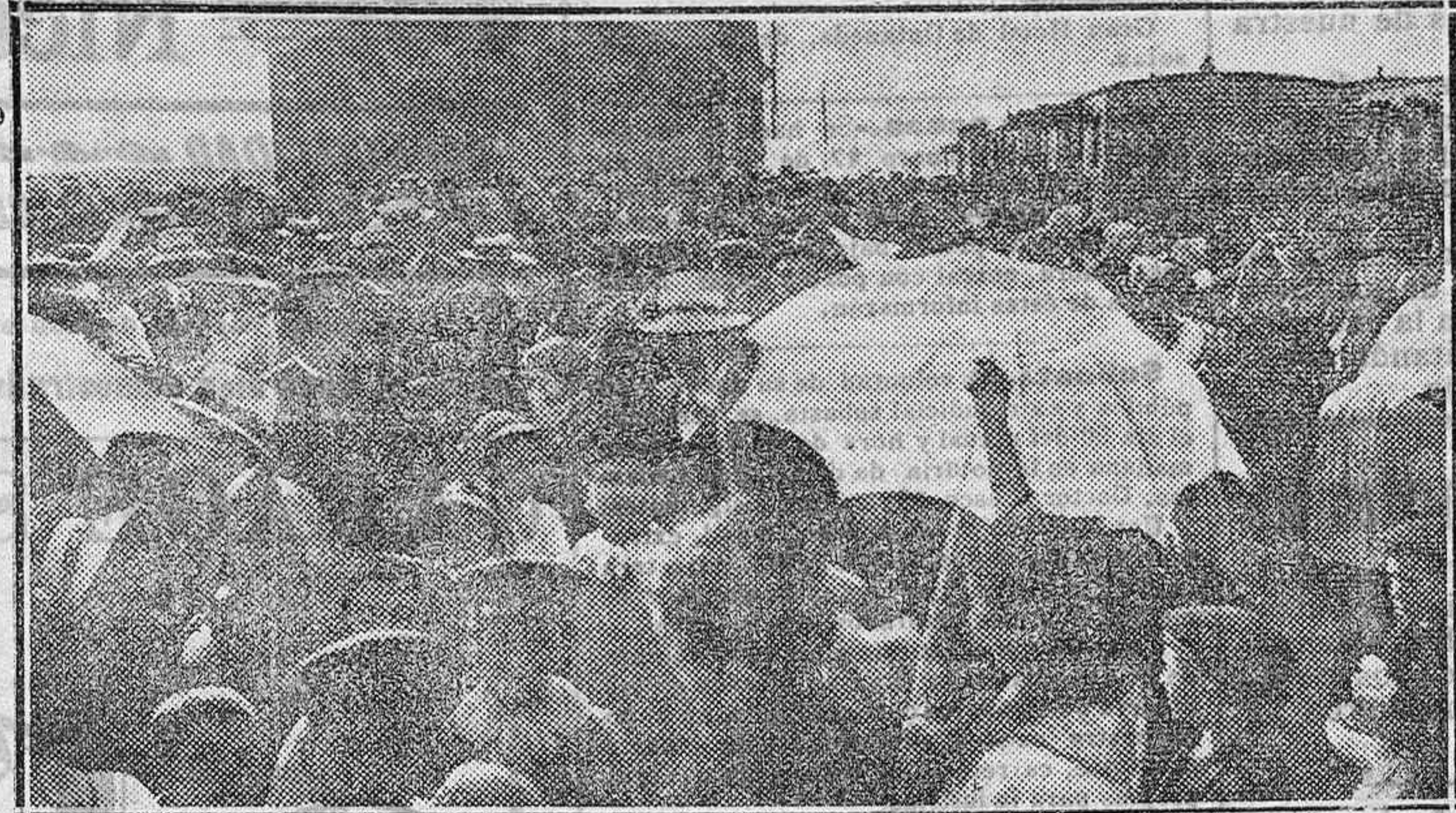
Los excursionistas á la llegada á la estación de Arapiles.