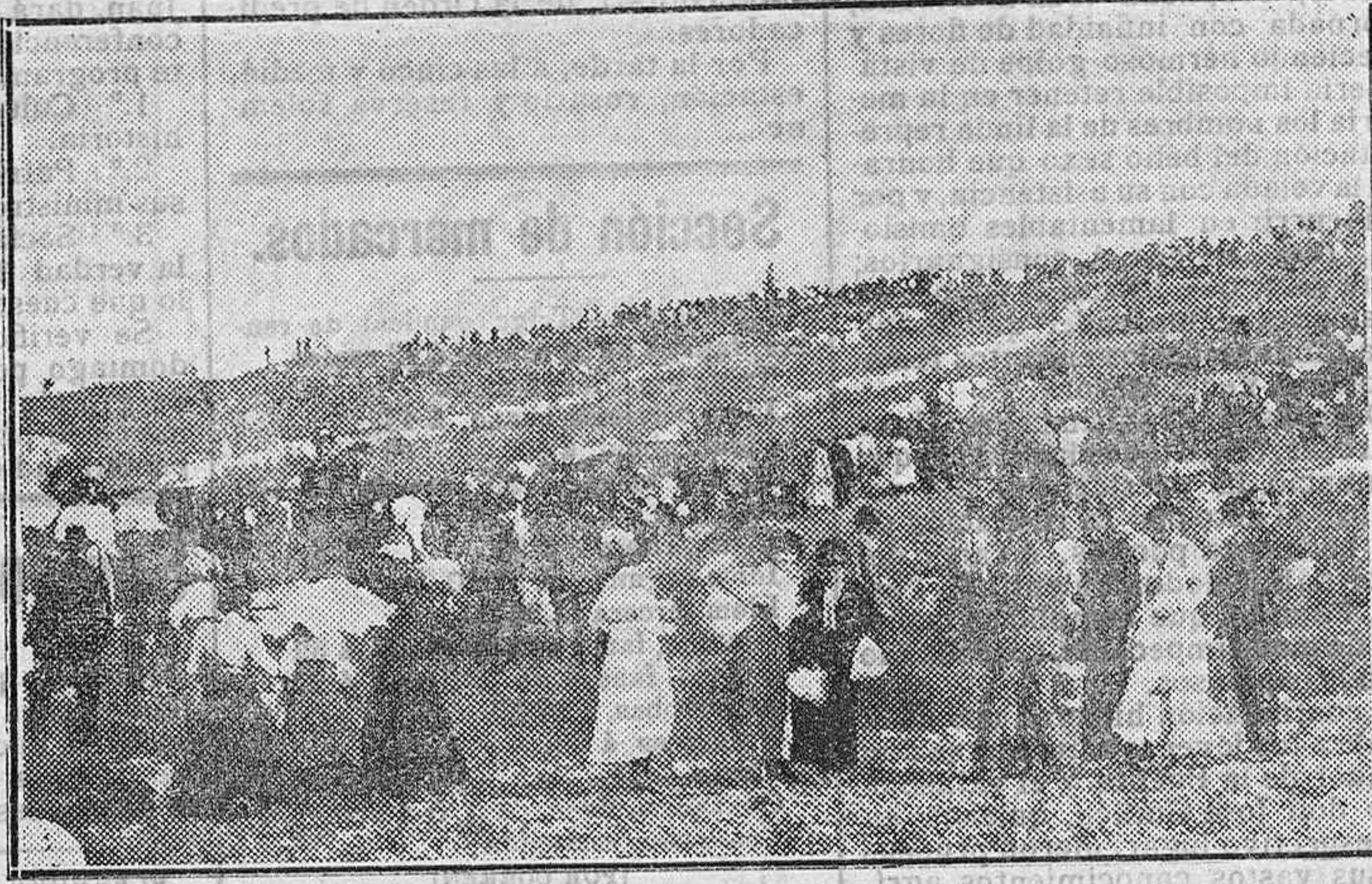
En marcha hacia el Arapil.

y la cultura española estarían de enhorabuena, aunque rabiase y patease don Indalecio y tuviera que meterse á fraile el amigo Retana.