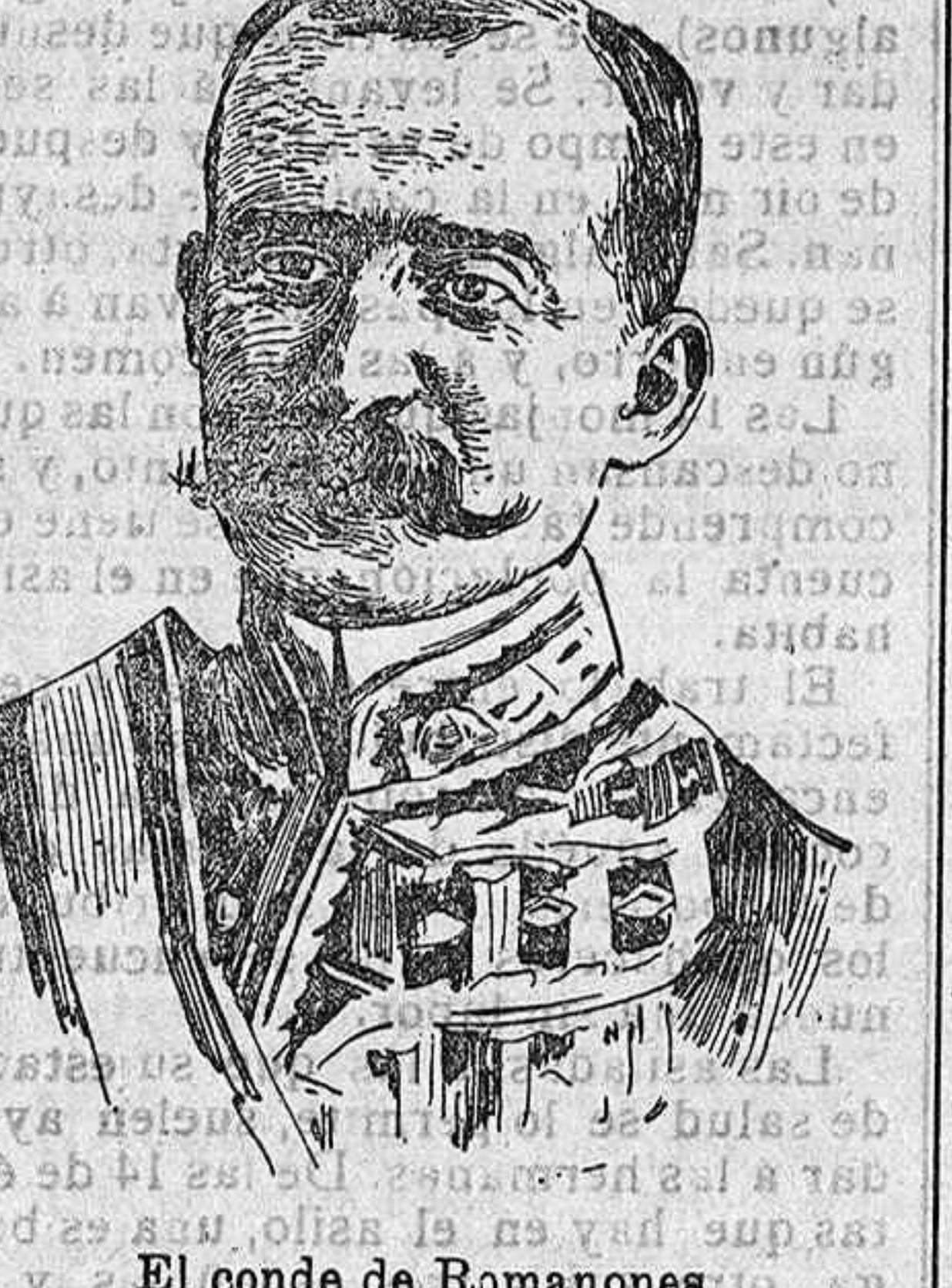
El conde de Romanones.

La próxima legislatura, por muy diversos conceptos, promete ser muy movida y ávida en debates e incidentes.