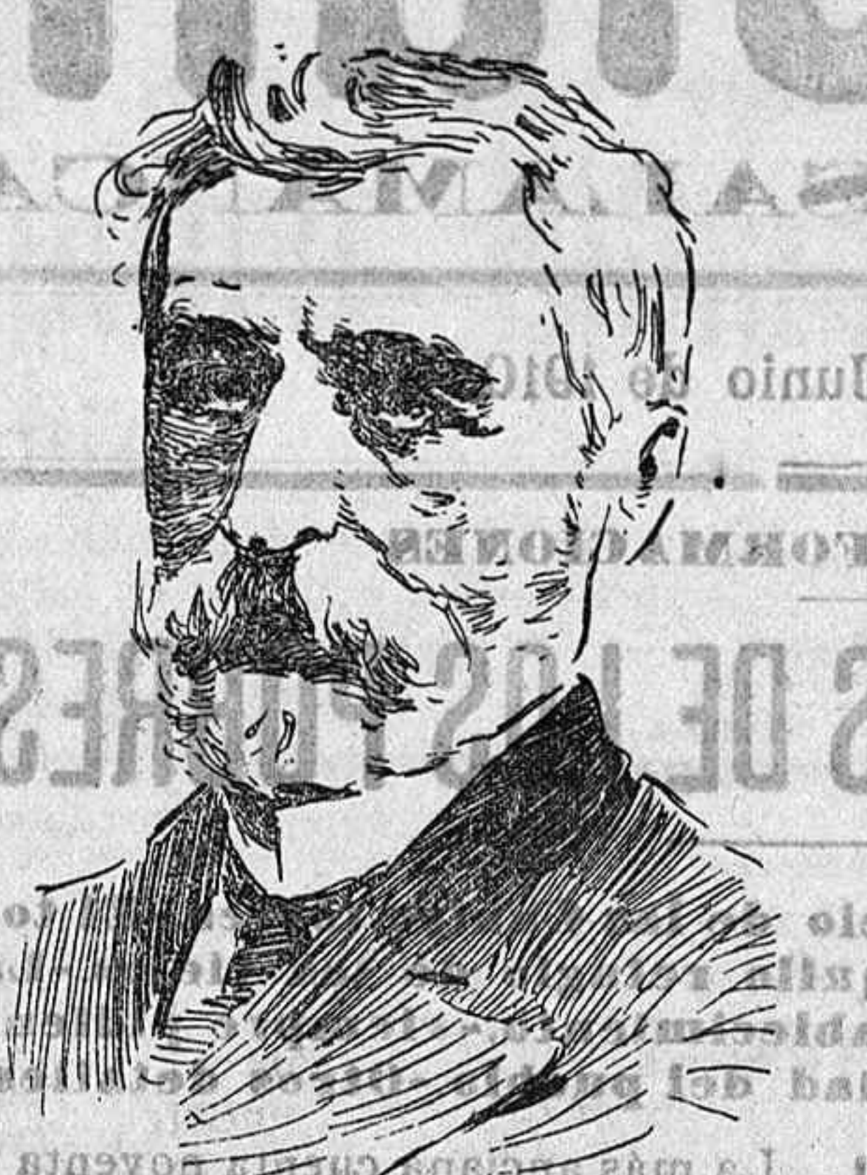
Don Eugenio Montero Ríos.

Firmado el nombramiento del señor Montero Ríos para la presidencia del Senado, y hecho cargo el señor Burell del Ministerio de Instrucción pública, por dimisión del conde de Romanones, queda resuelto el problema de las presidencias de las Cámaras, sin haber originado grandes contrariedades ni disgustos al señor Canalejas, en contra de lo que se pronosticaba.