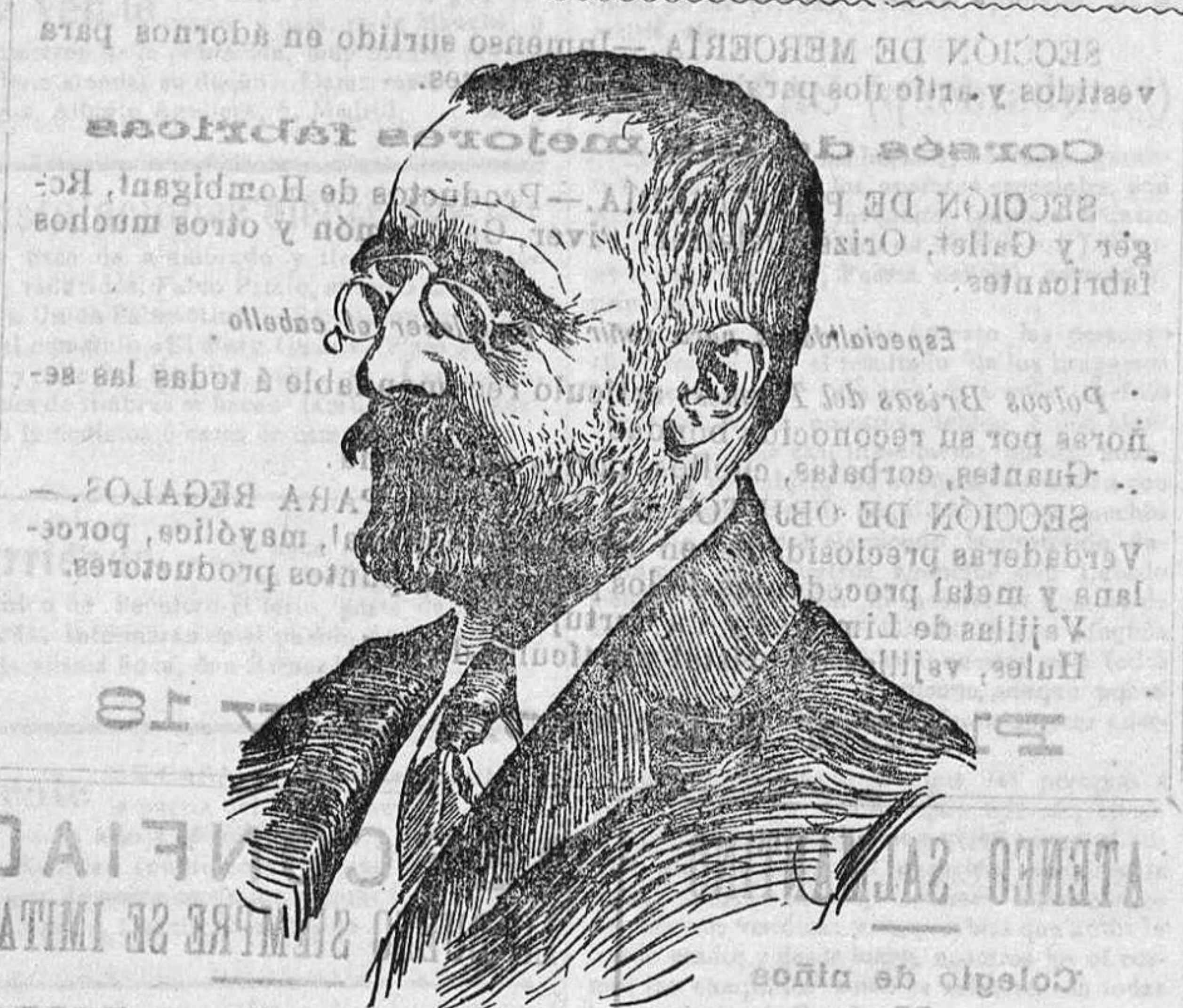
DON JOSE CANALEJAS

Nuevo Presidente del Congreso de los Diputados