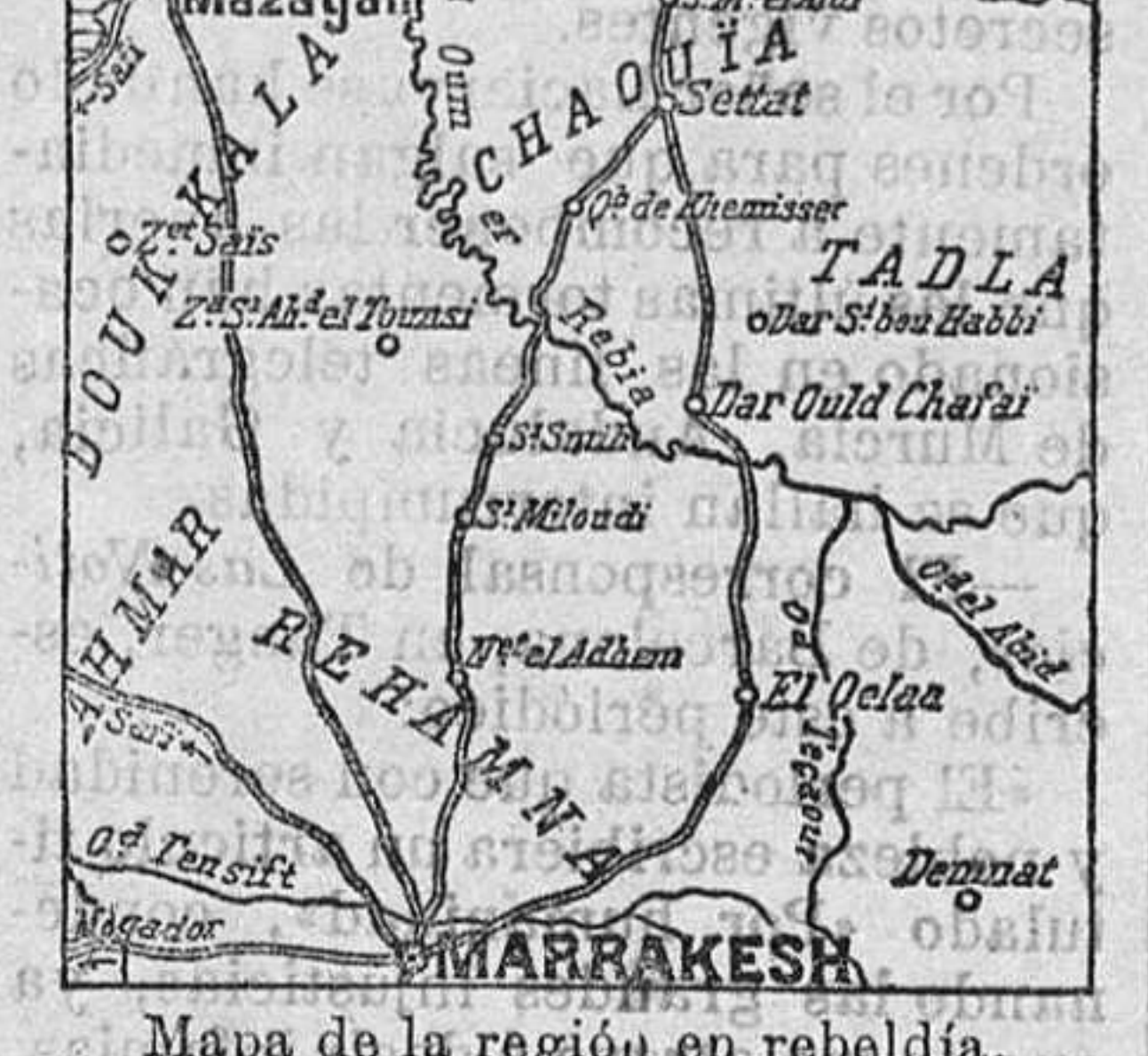
Mapa de la región en rebelión.

La vistosa comitiva de jefes, kades, gobernadores y soldados jerifianos que formaban la escolta imperial, cruzó lentamente las calles