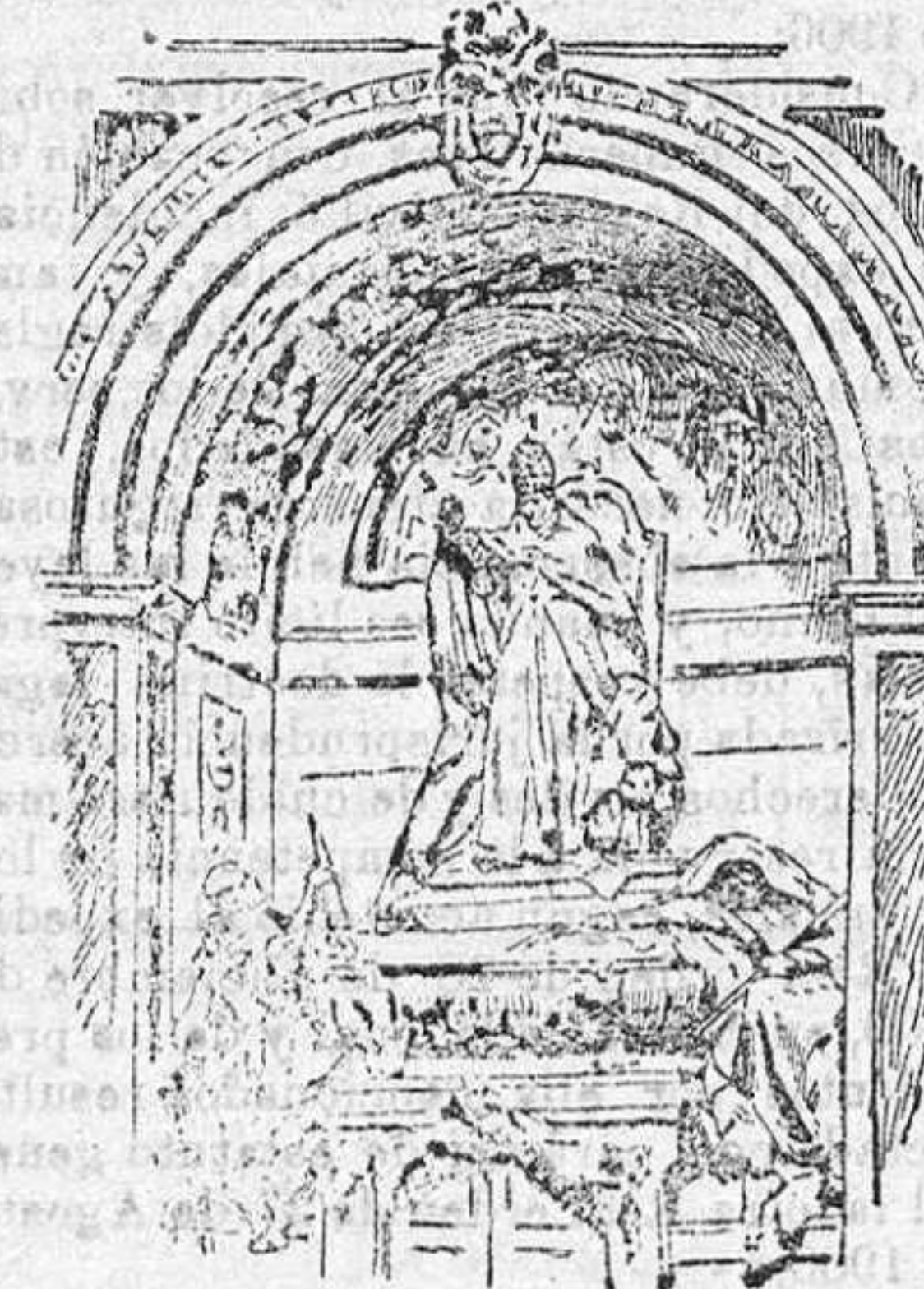
NUOVO SEPULCRO DE LEON XIII

Para cada detalle, Chenois le pedía su opinión, y Víctor aprobaba siempre,