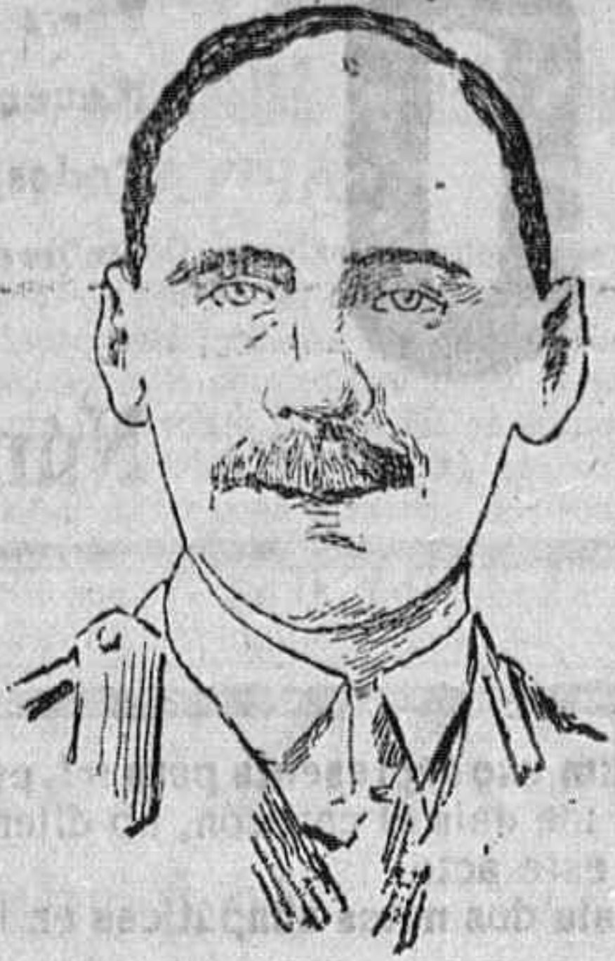
General Goringen, comandante del ejército anglo-indio que opera en la región del Tigris.

tiguas. La columna del Eufrates se había apartado de las orillas del río en