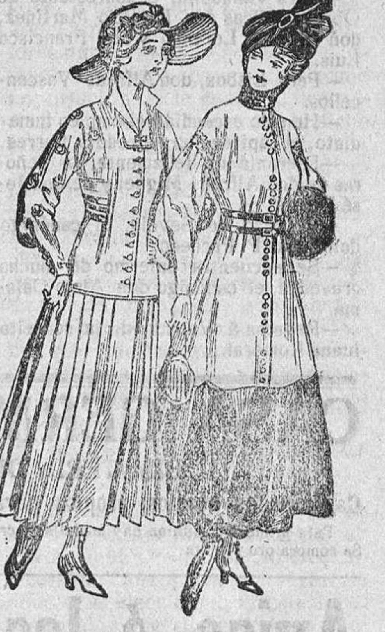
Este periodo de transición, claro es que aún no han sido lanzados nuevos modelos; pero desde luego se presente una gran revolución en la moda.