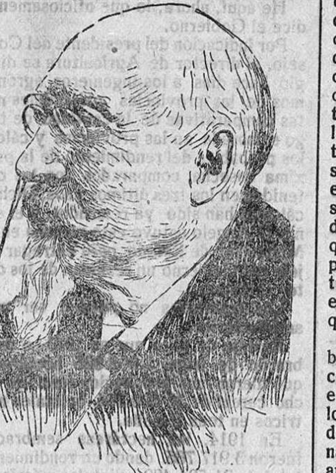
Don José Echegaray.