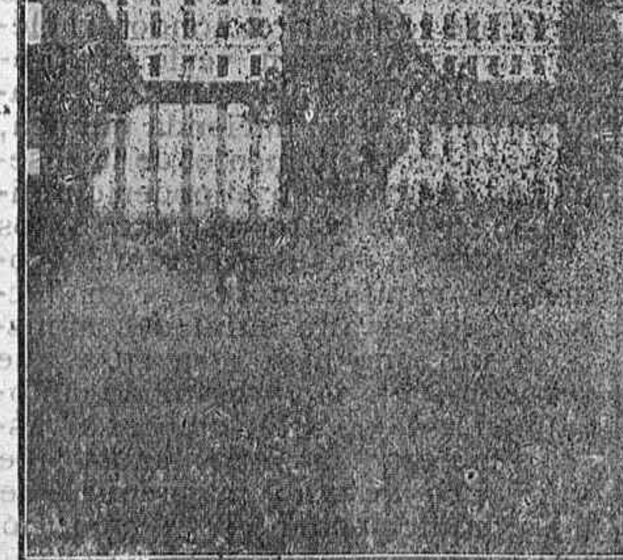
PALACIO DE NYMPHEMBURG (Munich), residencia de los príncipes de Babiera.