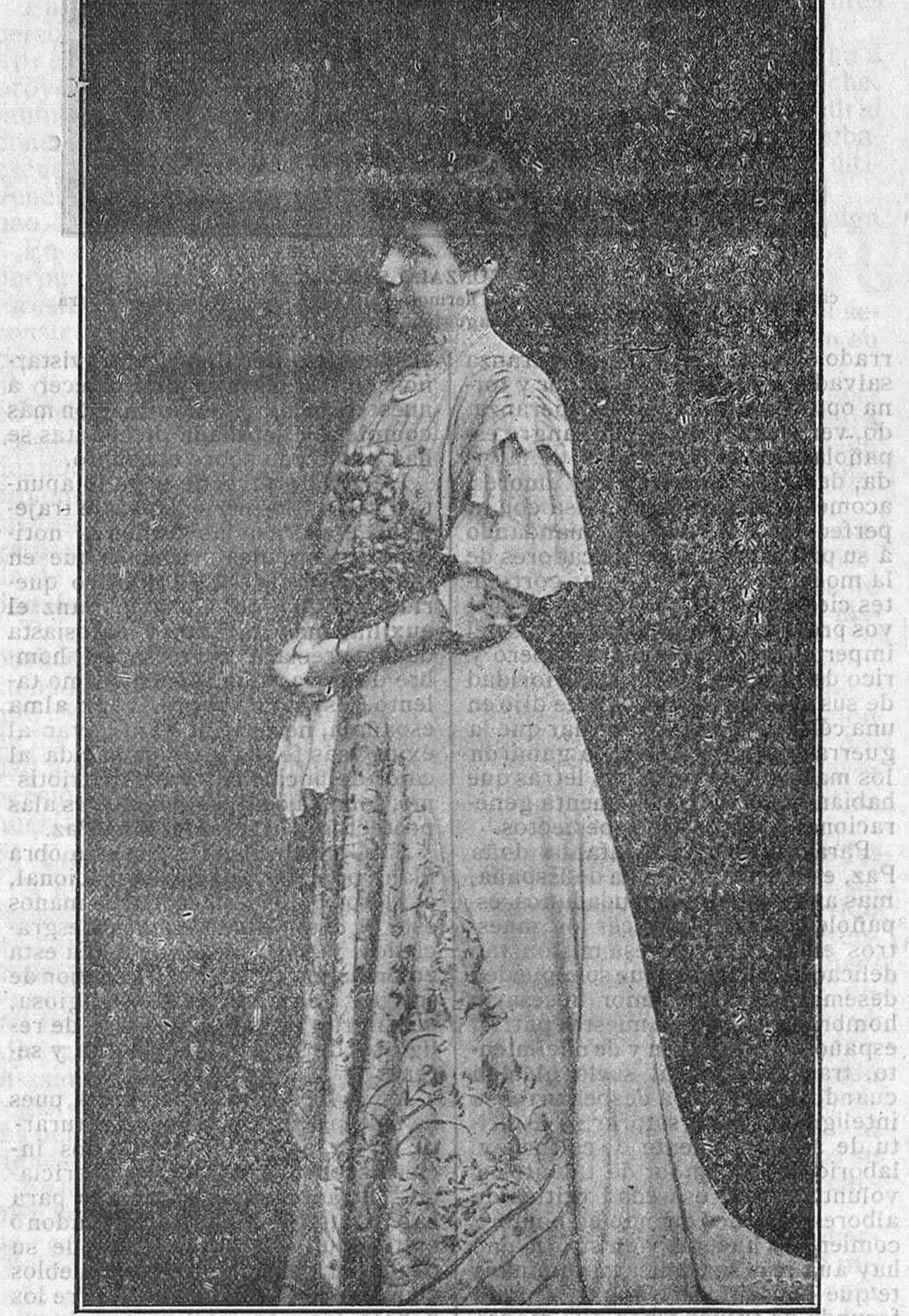
SU ALTEZA REAL LA INFANTA DOÑA PAZ DE BORBON que ha iniciado, por amor á España, la graniosa obra de crear en Munich "El Pedagogium Español."

Esta admirable princesa de Baviera, española de nacimiento y españolísima por el inmenso amor con que consagra sus devociones á engrandecer el futuro de la afosa madre patria, cuyo presente en ruinas sólo ofrece la perspectiva del poderoso ayer, bendito emblema del ideal en que han de ejercitar sus esfuerzos los espíritus nacientes, luchadores y esperanzados; esta esclarecida princesa de alma tan gran-