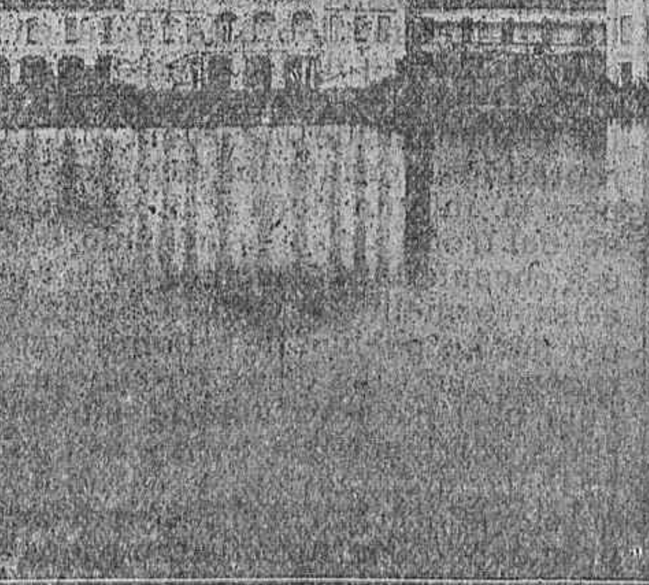
PALACIO DE NYMPHEMBURG (Munich), residencia de los príncipes de Babiera.