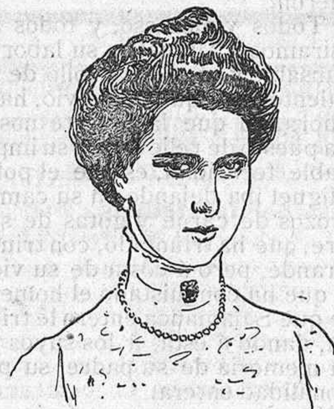
La princesa Beatriz de Sajonia-Coburgo.

la princesa Beatriz de Sajonia-Coburgo, residencia de su amada, y pocas horas después de su arribo se unía para siempre ante Dios con la que había elegido para compañera. La ceremonia, celebrada según los ritos católico y protestante, se efectuó sin pompa alguna, y el enamorado infante tuvo el desconsuelo de no ver a su lado, en momentos para él tan felices y solemnes, ni a uno solo de los suyos.