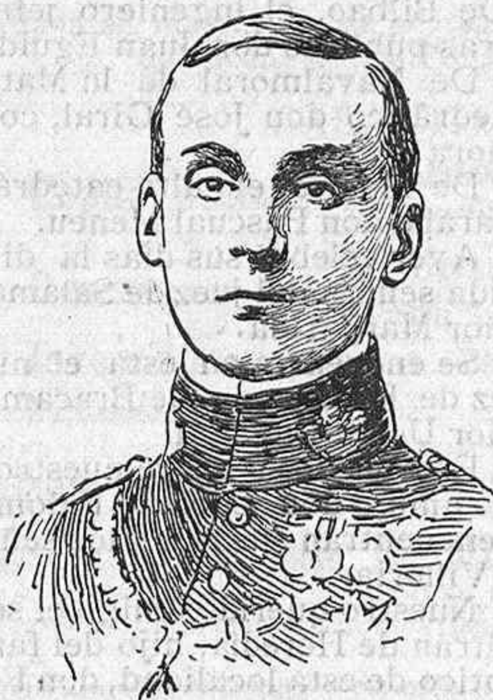
El infante don Alfonso de Orleans.

Como se recordará, el joven hijo de la infanta doña Eulalia contrajo matrimonio el 15 de Julio de 1909 con