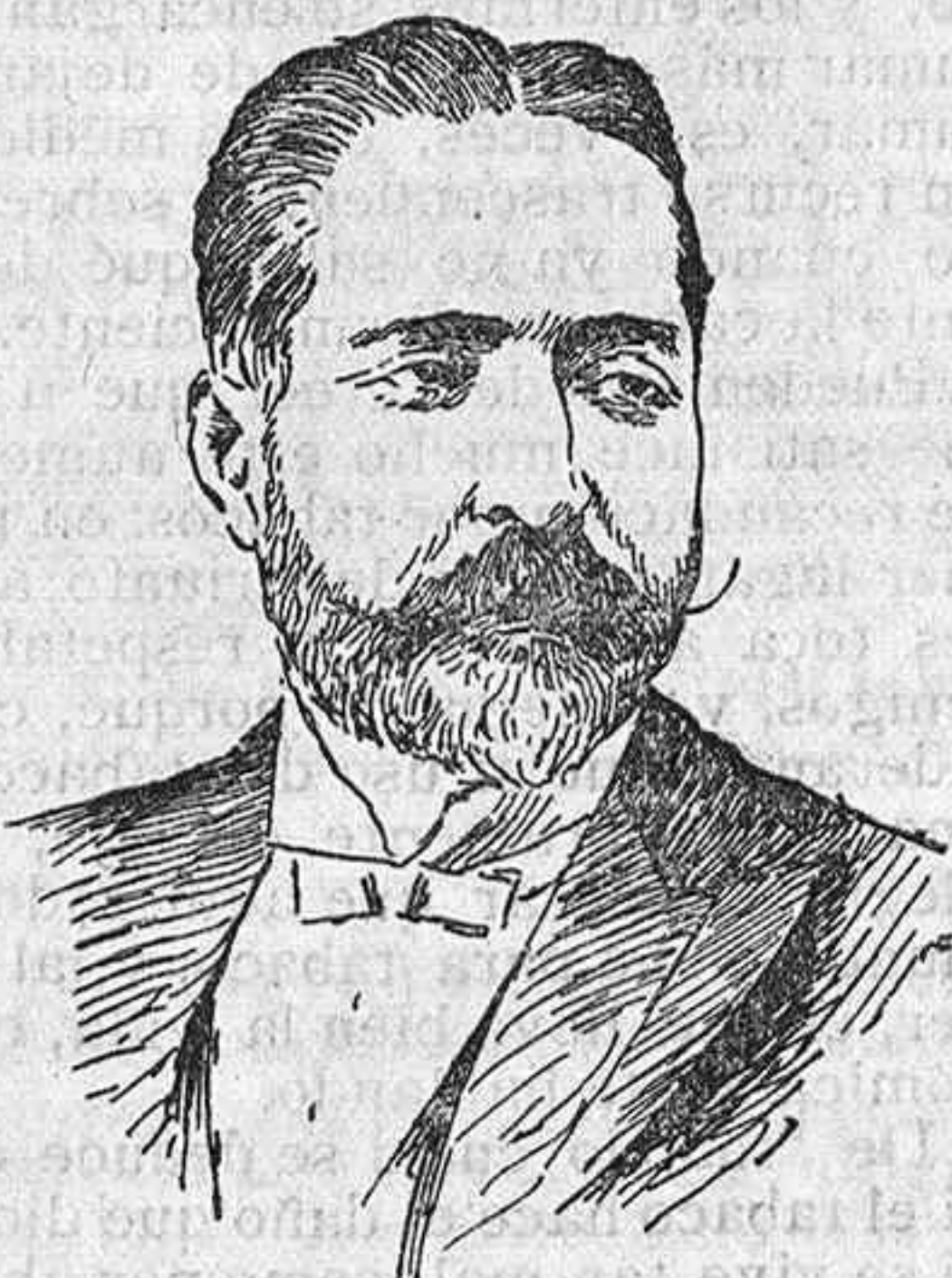
Don Demetrio Alonso Castrillo. Nuevo ministro de la Gobernación.

A las once de la noche terminó tan simpático acto.