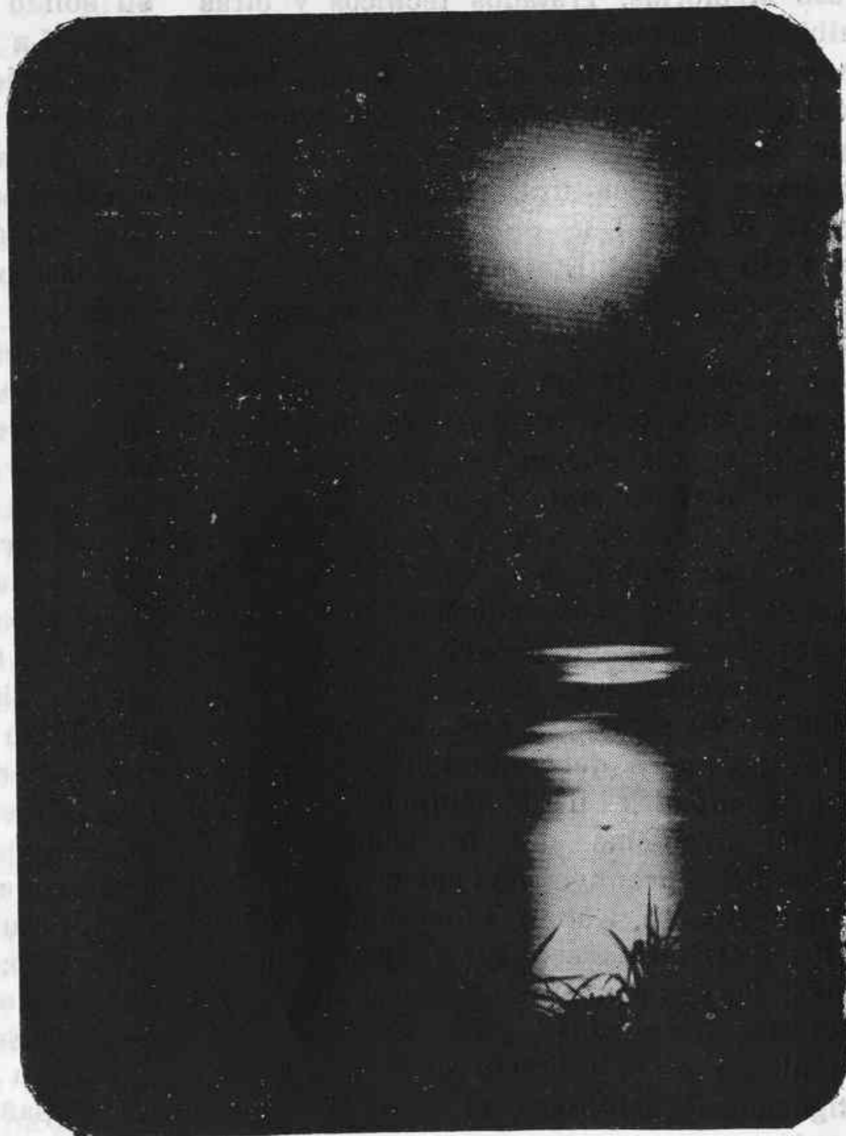
CLARO DE LUNA

El ilustrado Conferenciante nos hace ver el éxodo de esa gran Familia, entrándose por la parte NE. de Africa, en donde han podido