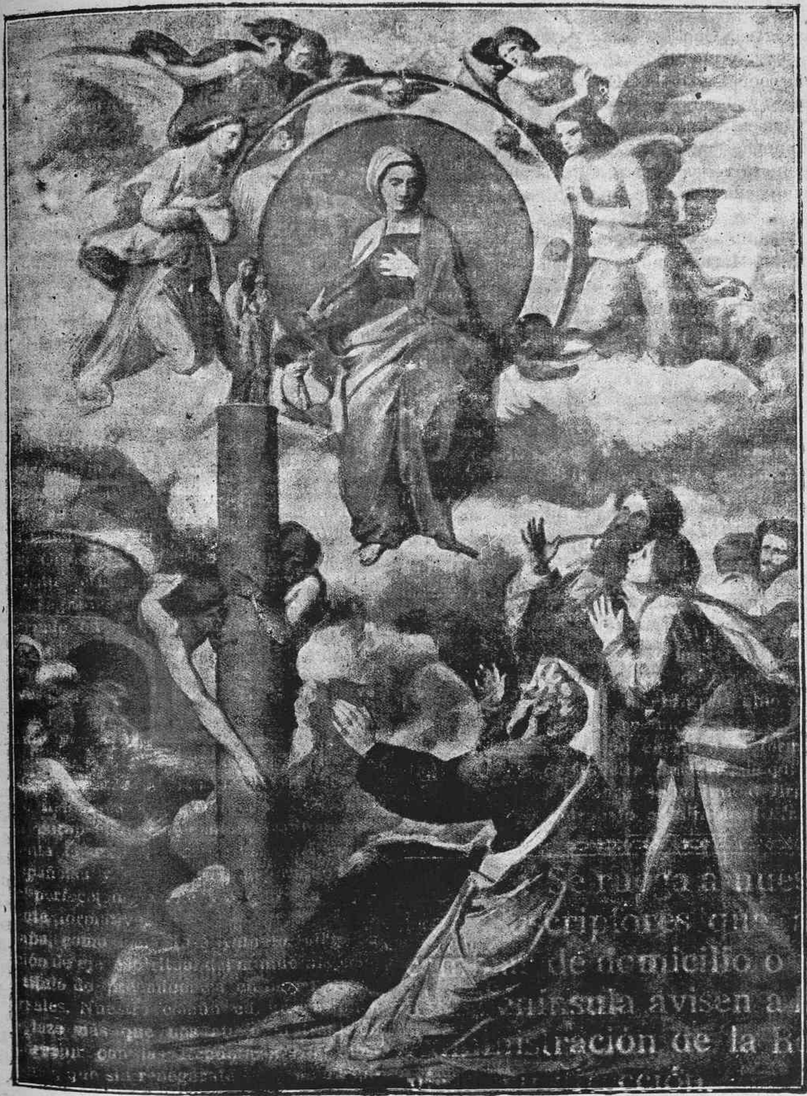
LA VIRGEN DEL PILAR