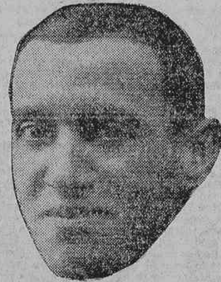
Ramón Pérez de Ayala