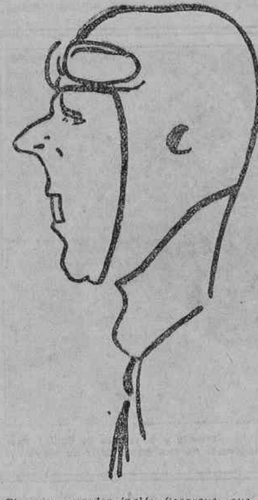
El gran corredor inglés Seagrave, que ha logrado hacer una media de 333 kilómetros por hora con un 'auto' especial

Una milla, a la velocidad media de 327 kilómetros 987 metros por hora. Cinco kilómetros a la velocidad media de 327 kilómetros 618 metros por hora. En uno de sus ensayos, el mayor Seagrave