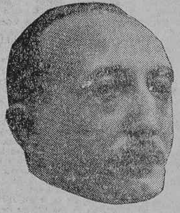
Wenceslao Fernández Flórez

«Está muy bien—ha dicho—que premien a Concha Espina y que premien a Ramón Pérez de Ayala; se lo merecen. Yo los admiro fervorosamente... Si hubieran concedido el premio entero a «Tigre Juan» me habría parecido justo.