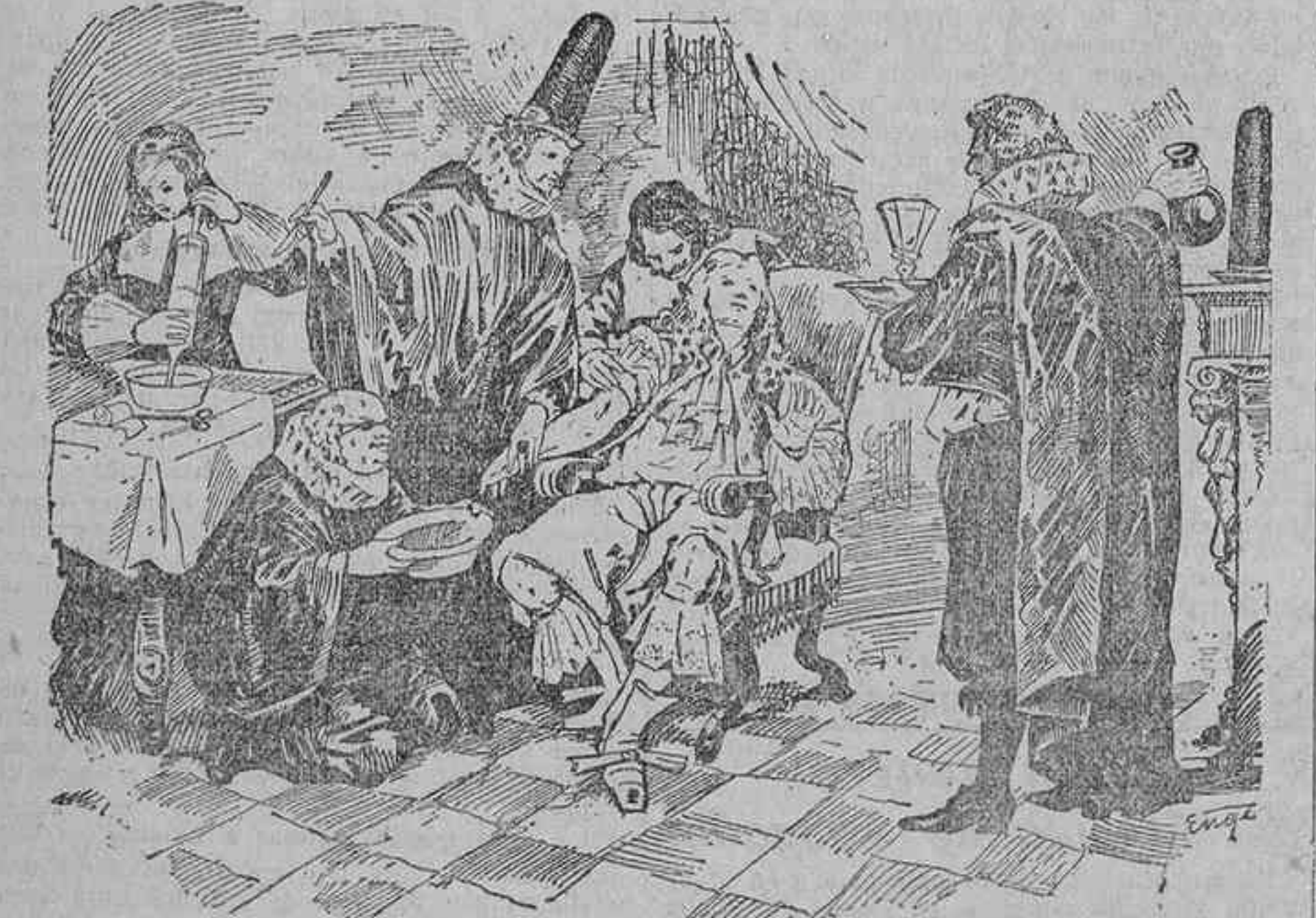
LUIS XIV EN MANOS PELIGROSAS (Estampa de Enrique García Ormaechea.)

Hoy no se efectuarán operaciones de recepción de pedidos; pero sí podrán facturarse los del lunes.