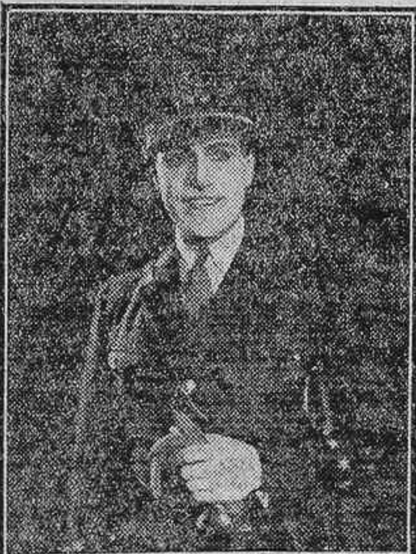
El caso del cine alemán vistiendo el uniforme de capitán español en la película «El camino del olvido»