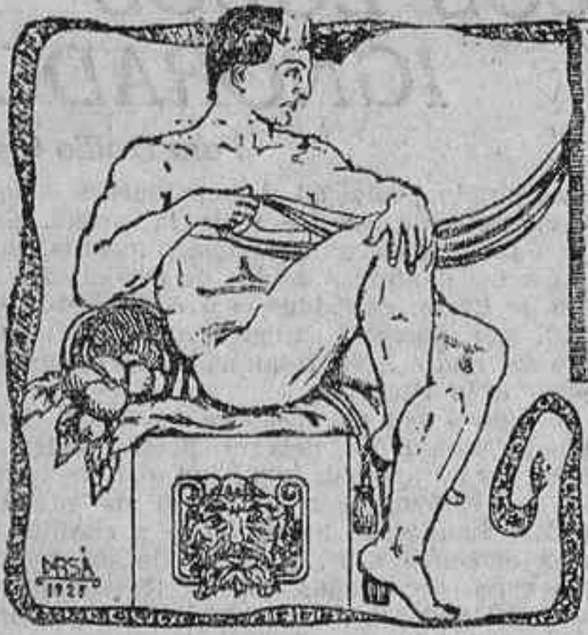
UNA OBRA NECESARIA