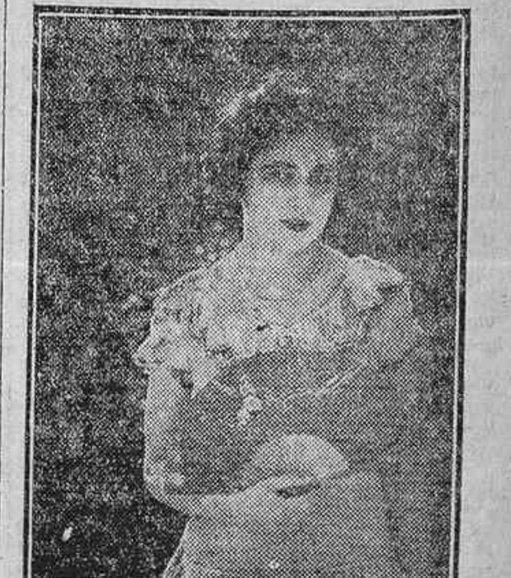
La estrella alemana Hella Moja en la película española «El camino del olvido»