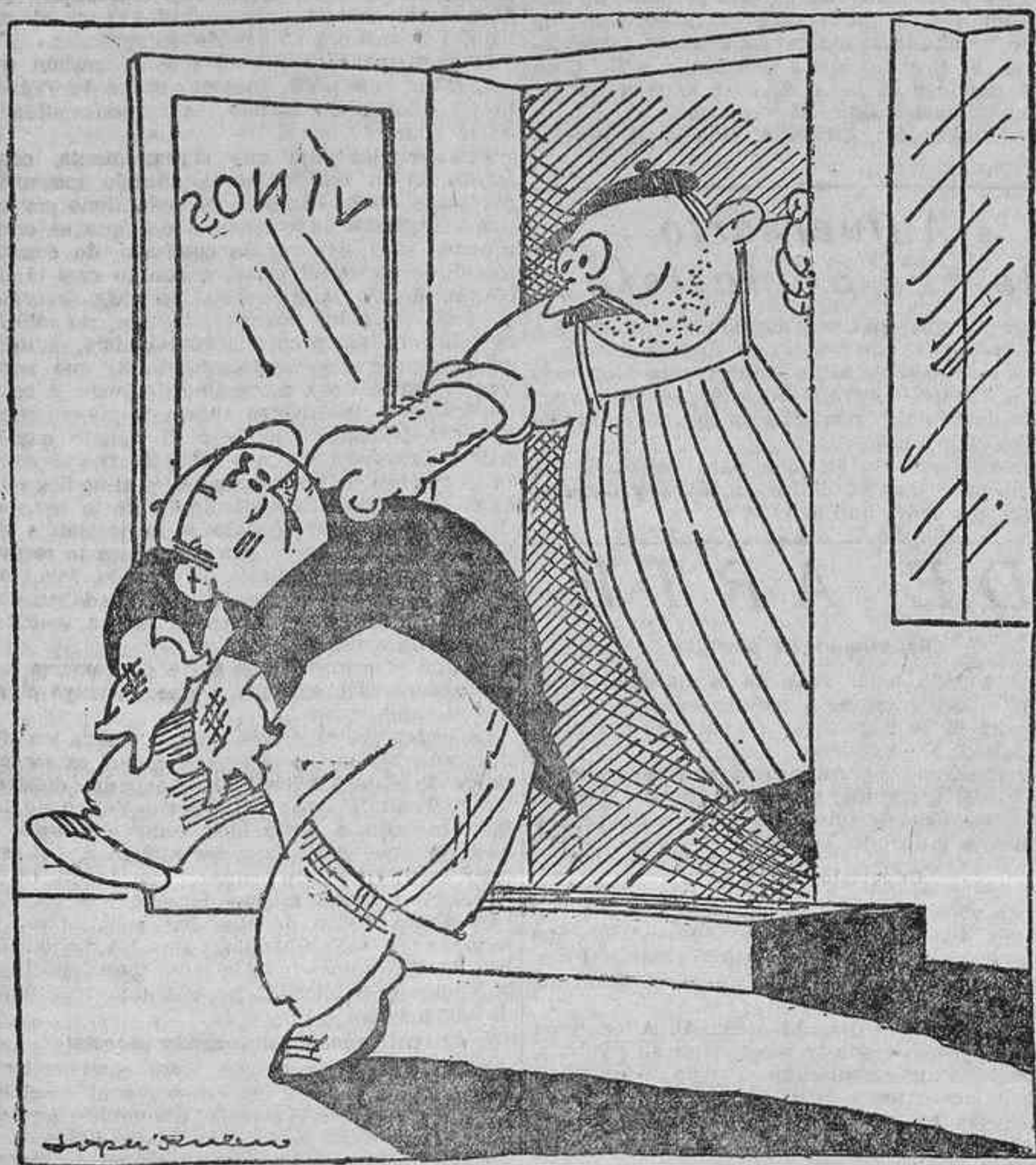
—¡Largo de aquí! He dicho que no se entra y no se entra. —¡Caray! Ni que fuese usted del Consejo de la Sociedad de Naciones.

Por la noche se celebró en el teatro Rosalía de Castro la anunciada Fiesta del Ahorro. El ministro pronunció un discurso.