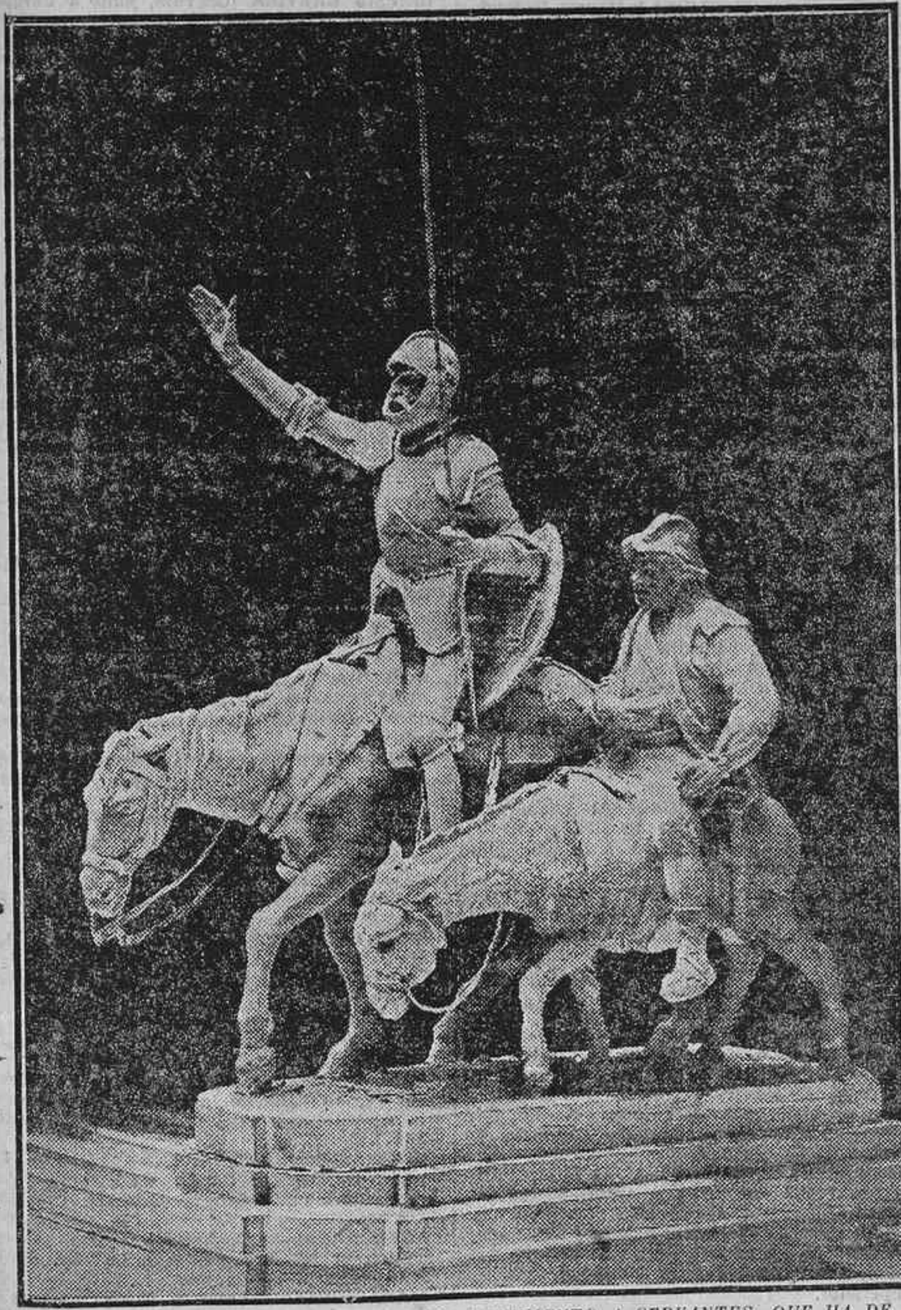
GRUPO DE DON QUIJOTE Y SANCHO, DEL MONUMENTO A CERVANTES, QUE HA DE ERIGIRSE EN LA PLAZA DE ESPAÑA

El nuevo académico está recibiendo muchas felicitaciones, a las que unimos la nuestra.