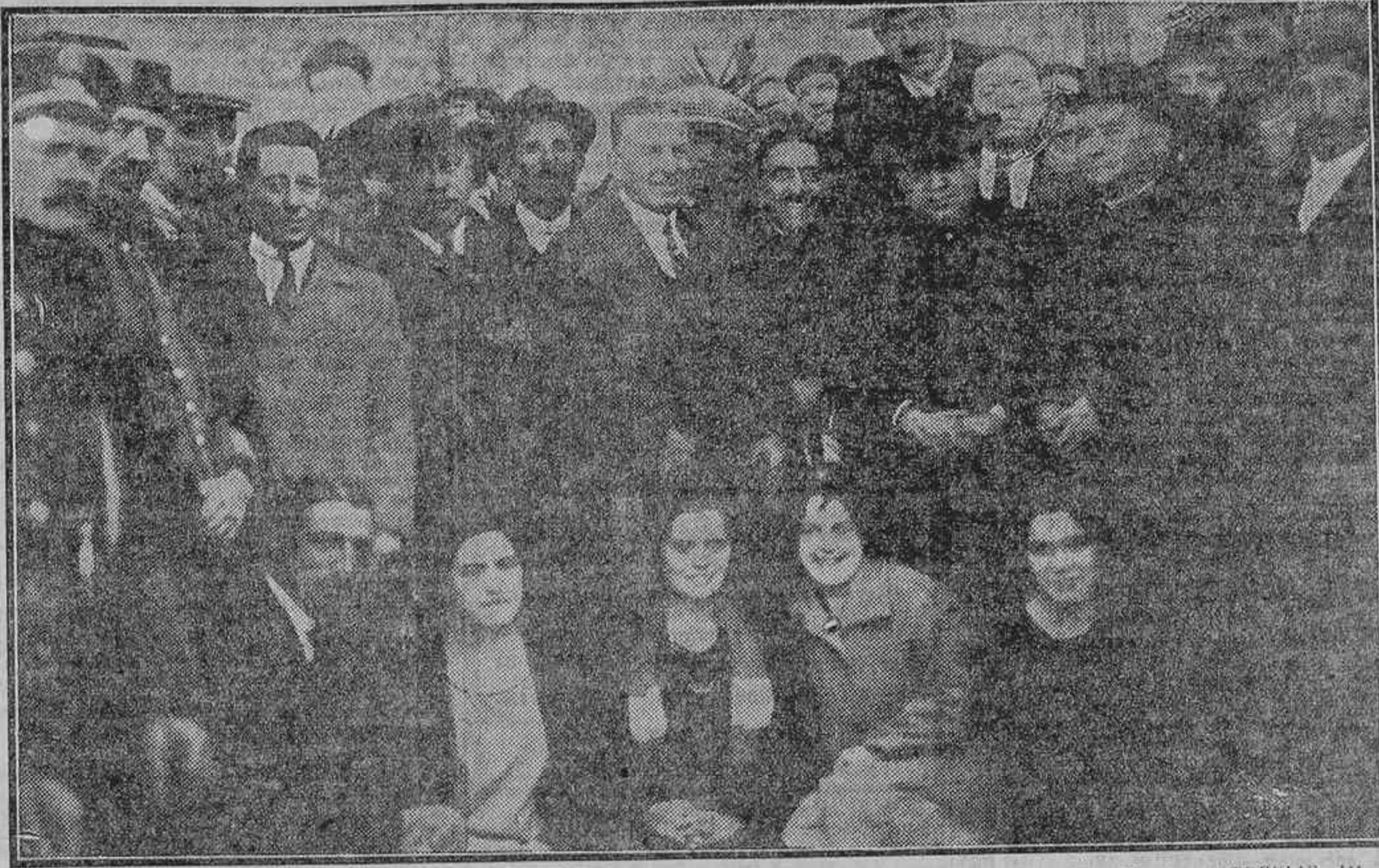
EN EL PUENTE DE VALLECAS.—CONCURRIENTES A LA INAUGURACION DE UNA FUENTE EN EL BARRIO DE ENTREVÍAS, IMPORTANTISIMA MEJORA, DE LA QUE TAN NECESITADA ESTABA AQUELLA SIMPATICA BARRIADA

Una aclaración El director de la Escuela Normal de Maestros,