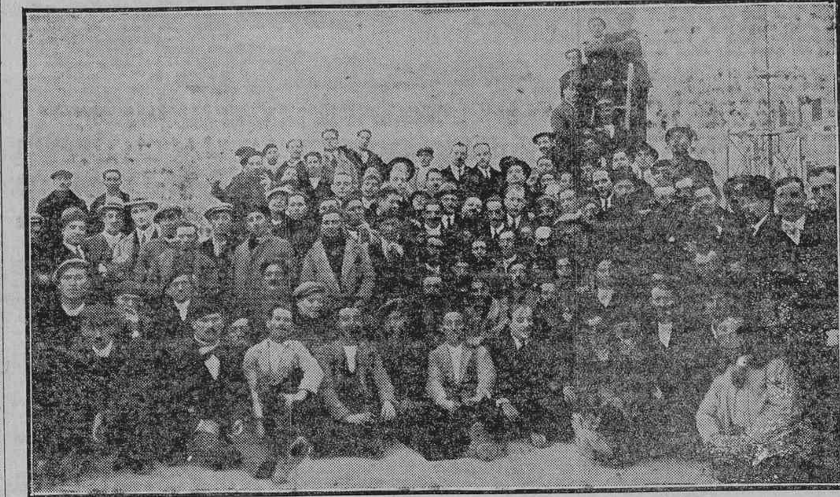
EMPLEADOS Y OBREROS DE LA COMPANIA DE TELEFONOS QUE ASISTIERON A LA FIESTA CELEBRADA CON MOTIVO DE HABERSE CUBIERTO DE AGUAS EL NUEVO EDIFICIO QUE AQUELLA EMPRESA EDIFICA EN LA CALLE DE HERMOSILLA

Se ha terminado la primera sección del cuadro interurbano en Madrid, y se trabaja ahora para instalar un cuadro urbano para 1.200 abonados, que estará terminado antes de finalizar el año corriente. Este cuadro urbano tiene por objeto descomprimir el servicio mientras tanto se instalan las nuevas centrales automáticas.