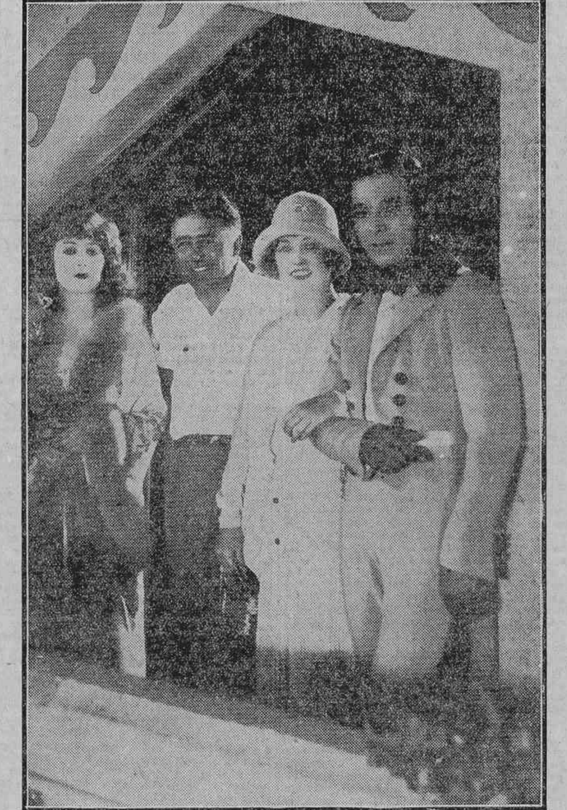
WILNA BANKY, CLAERENCE BRONW, MARIÓN DAVIES Y RODOLFO VALENTINO, PRIMERAS FIGURAS DE LA CINEMATOGRAFIA, EN LOS ANGELES (CALIFORNIA)

que ha de alcanzar en nuestras páginas literarias semanales un extraordinario éxito. El lector de buen gusto que, sin ser suscriptor de nuestro diario, desee adquirir la célebre novela de Daudet, puede hacerlo solicitando del vendedor de LA LIBERTAD las páginas destinadas a la novela, cuyo precio es de diez céntimos