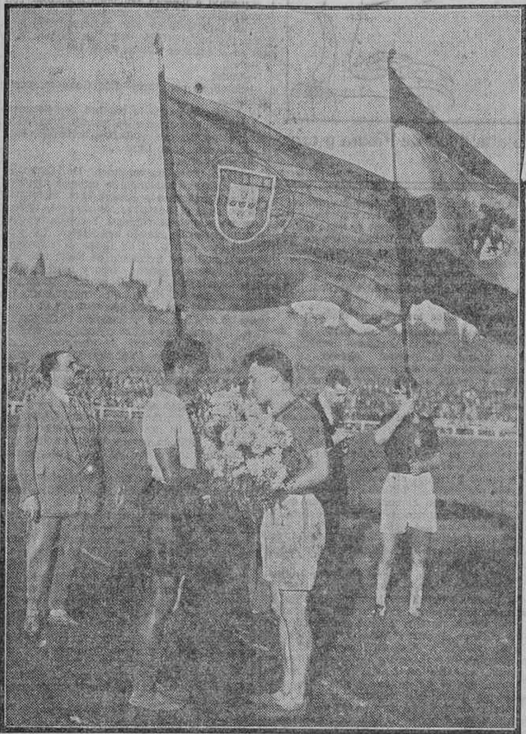
EL MATCH IBERICO.—LOS CAPITANES DE LOS EQUIPOS DE PORTUGAL Y ESPAÑA CAMBIÁNDOSE RAMOS DE FLORES, ANTES DE COMENZAR LA LUCHA