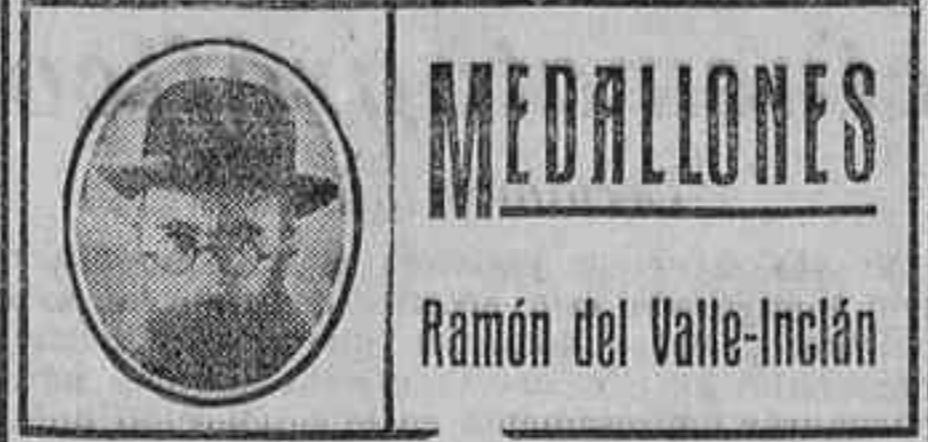
Ramón del Valle-Inclán

Lea usted todos los domingos el suplemento literario de LA LIBERTAD. Se publican en él las novelas más famosas