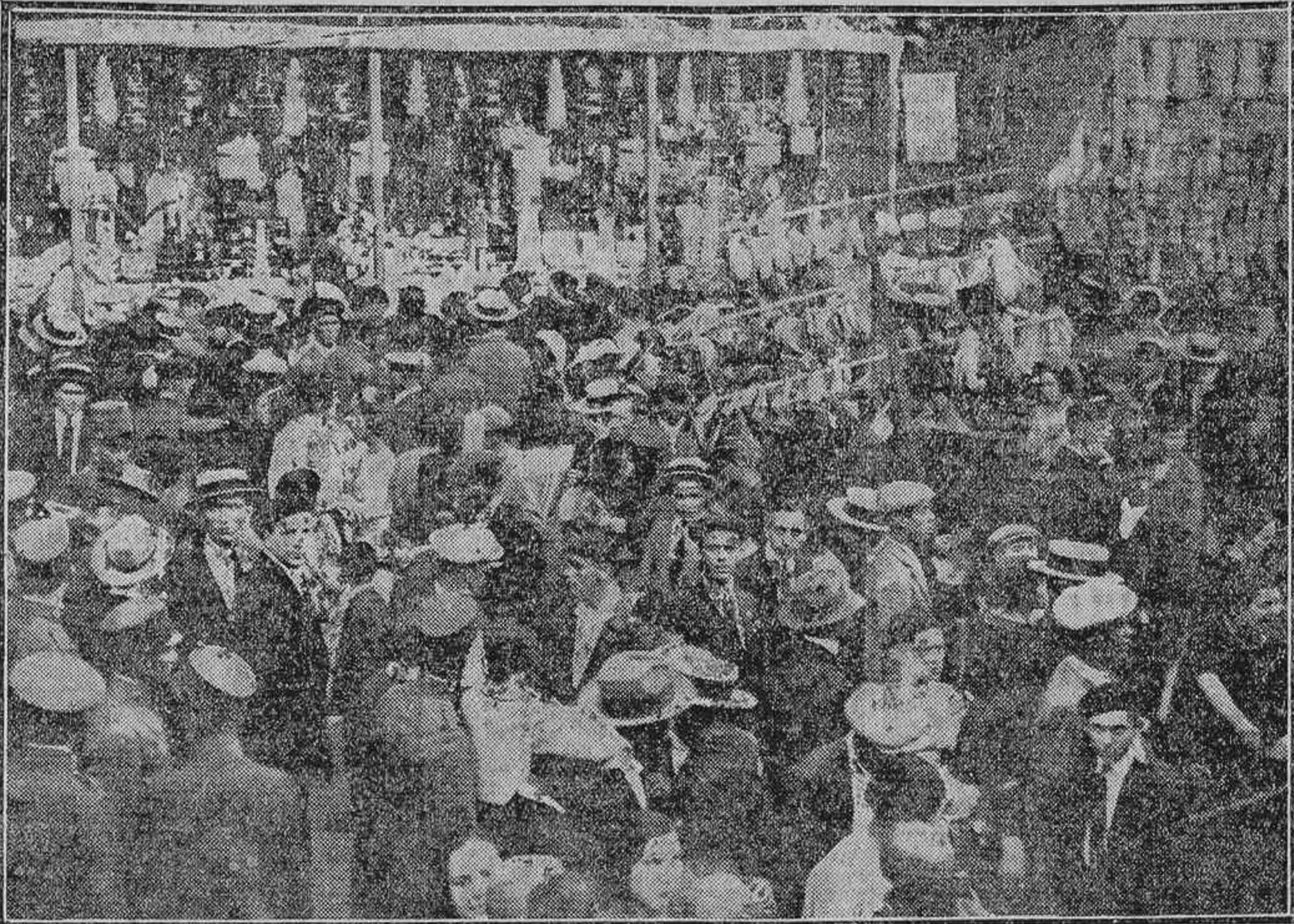
LA VERBENA DE SANTIAGO.—ASPECTO QUE OFRECIA LA EXPLANADA DEL CUARTEL DE LA MONTANA EN LA TARDE DEL DOMINGO