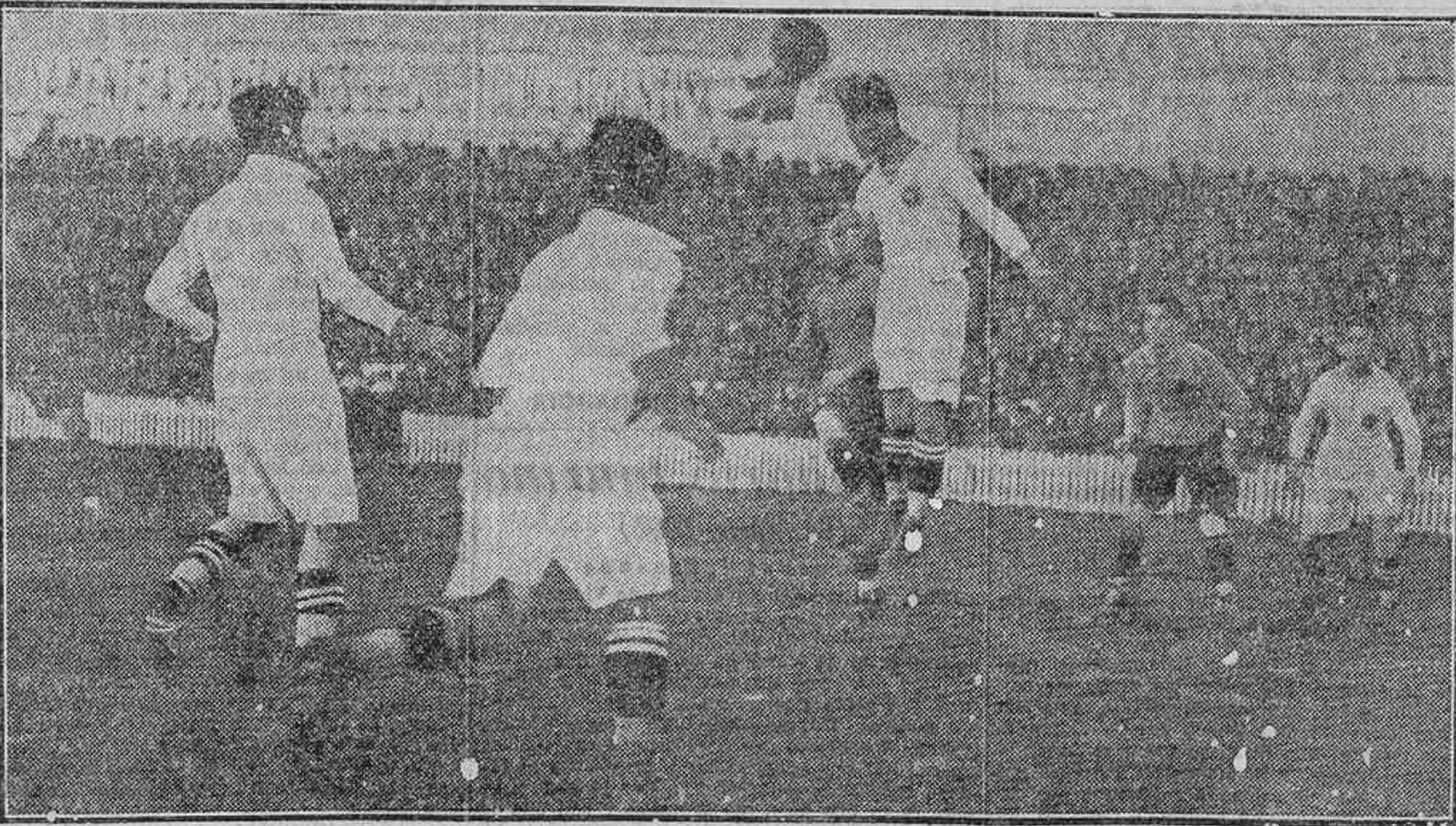
UN MOMENTO DEL PARTIDO JUGADO EL DOMINGO ENTRE LOS ARGENTINOS Y EL MADRID REFORZADO

Los forasteros dominan al principio; pero el Racing local, poco a poco, se anima. El primer tiempo termina con un empate a uno. En el segundo domina más el Euskalduna; hay dos tantos clarísimos en el área de «penalty», que el árbitro no ve. Los donostiarros hacen un segundo tanto antes de terminar.