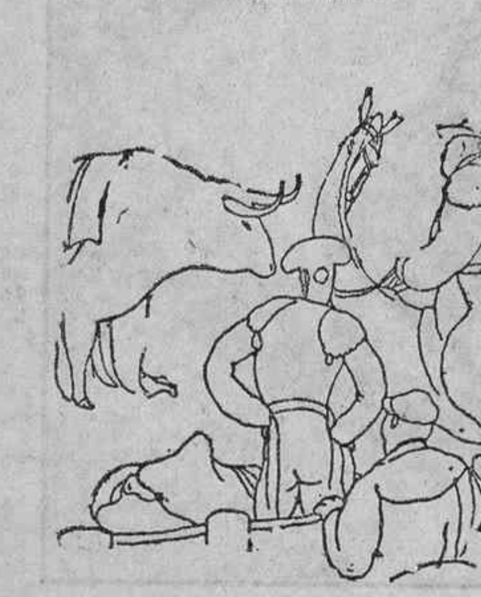
UN POCO ANTES DE IR A LA ENFERMERIA