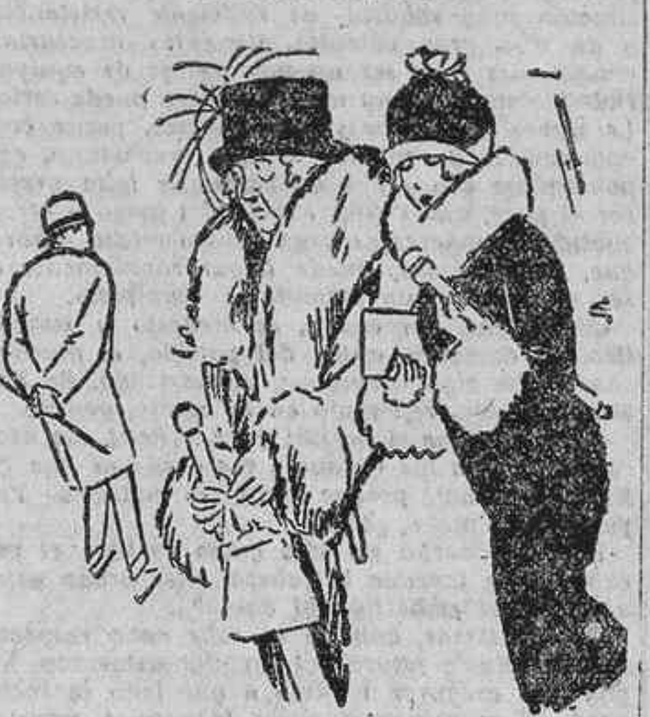
La mamá.—¿Qué atrevimiento de hombre! ¡No saltamos una vez a la calle sin que venga detrás de mí! (Sans Genes.)