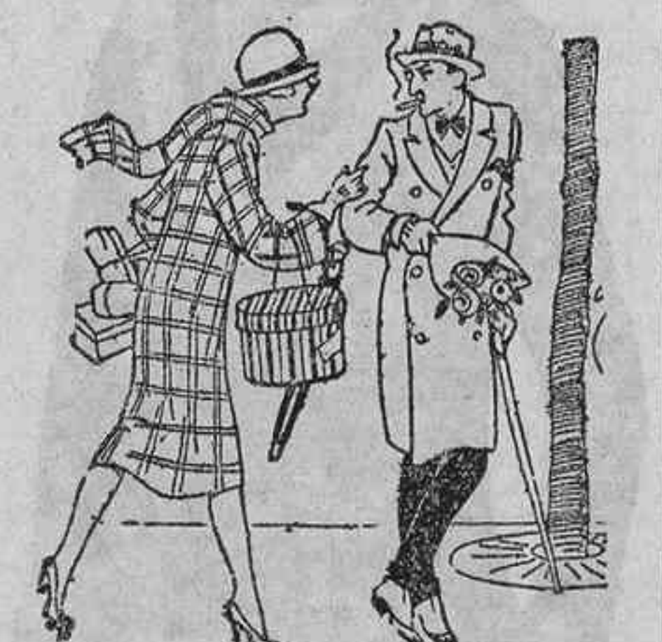
—Niña, te vienes sin paquetes... No se quejará nuestra tía. —Va a enloquecer con la sorpresa. He metido en la sombrerera dos kilos de patatas! (Sans Genes.)