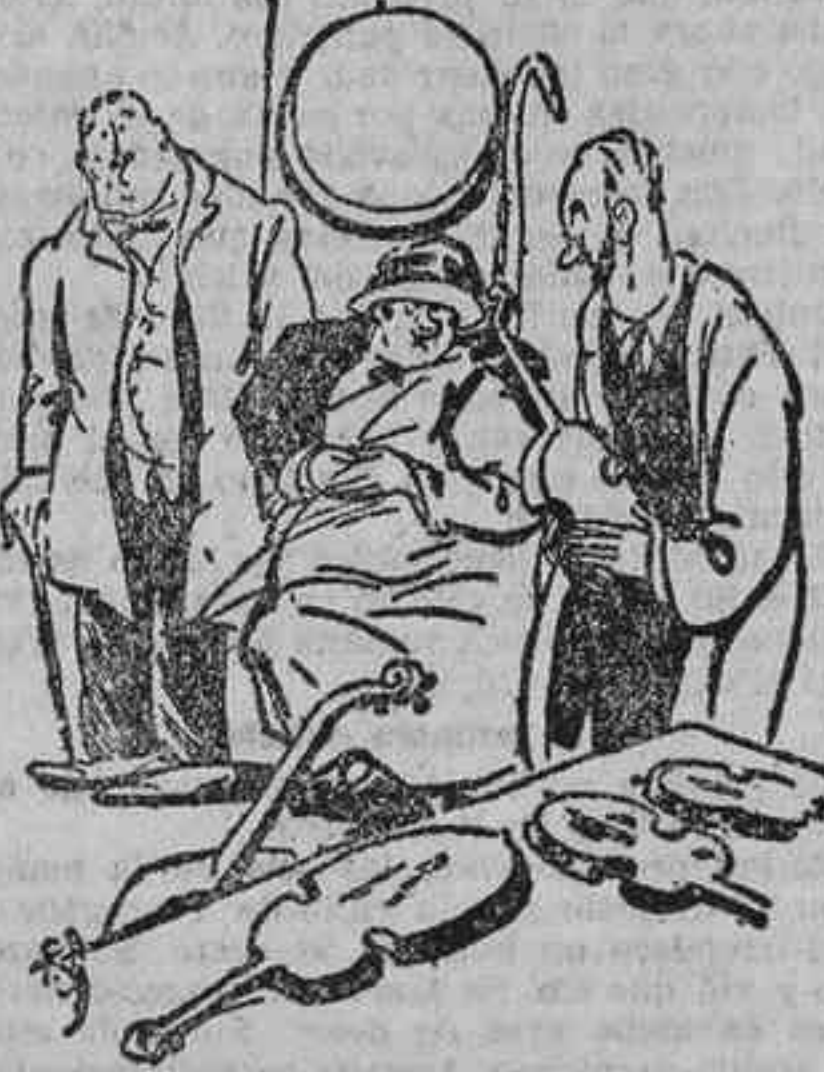
Este violín es antiquísimo... Se trata de un stradivarius.

«Nosotros tenemos posición para comprarle nuevo. (Excoicioro.)