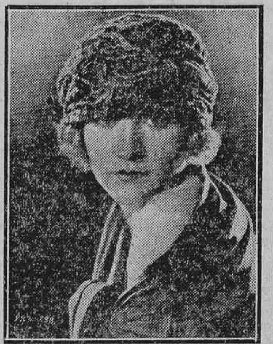
La encantadora actriz americana Betty Compson

El combate entre el barco mercante y el corsario se desarrolla durante una terrible tempestad cerca de Swinemunde. La tripulación está compuesta por viejos y expertos marineros.