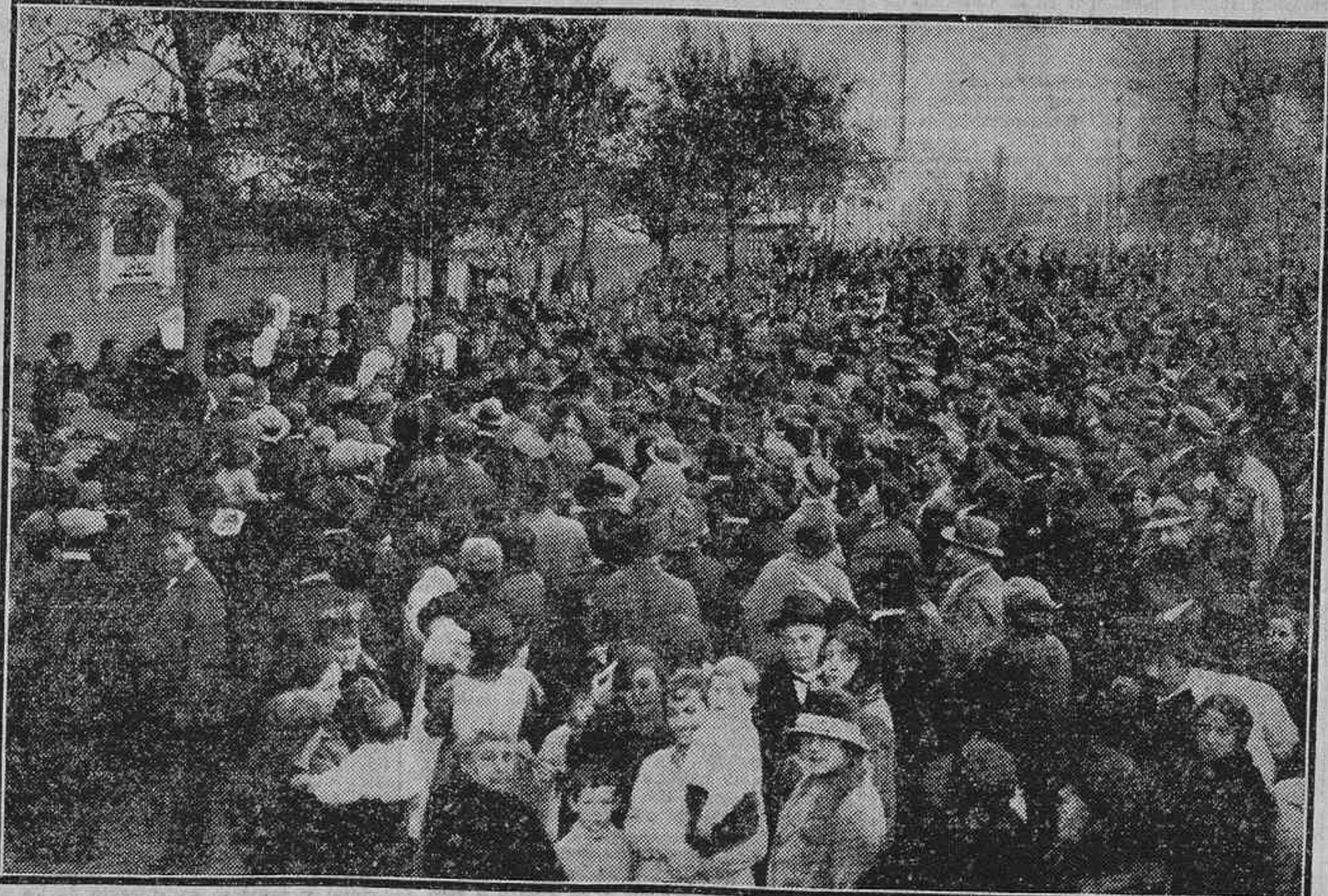
ASPECTO DE LA CALLE DE HILARIÓN ESLAVA DURANTE EL HOMENAJE AL GLORIOSO ESCRITOR