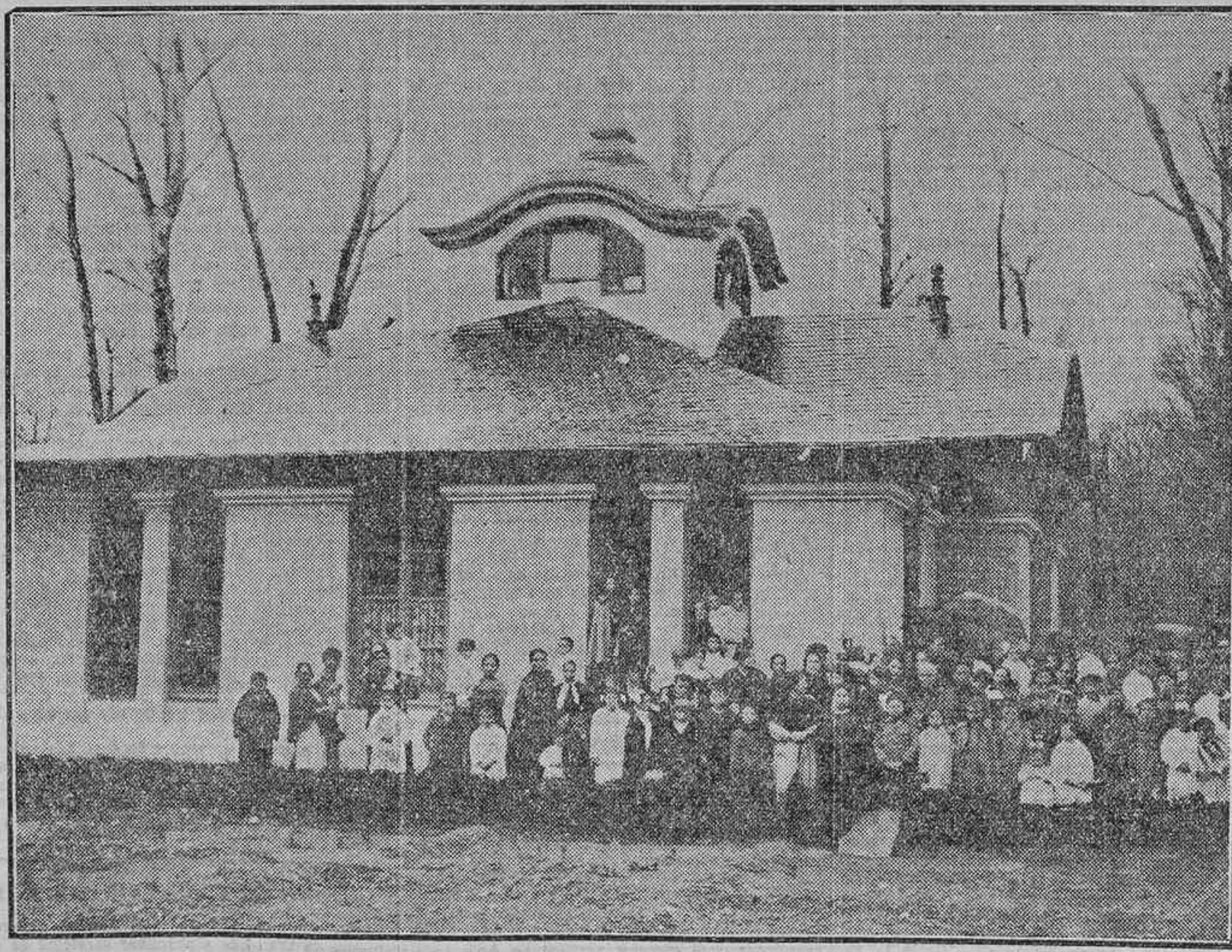
INAUGURACION DEL LOCAL, INSTALADO EN LOS JARDINES DE SAN ANTONIO, CELEBRADA AYER TARDE CON ASISTENCIA DE LAS AUTORIDADES