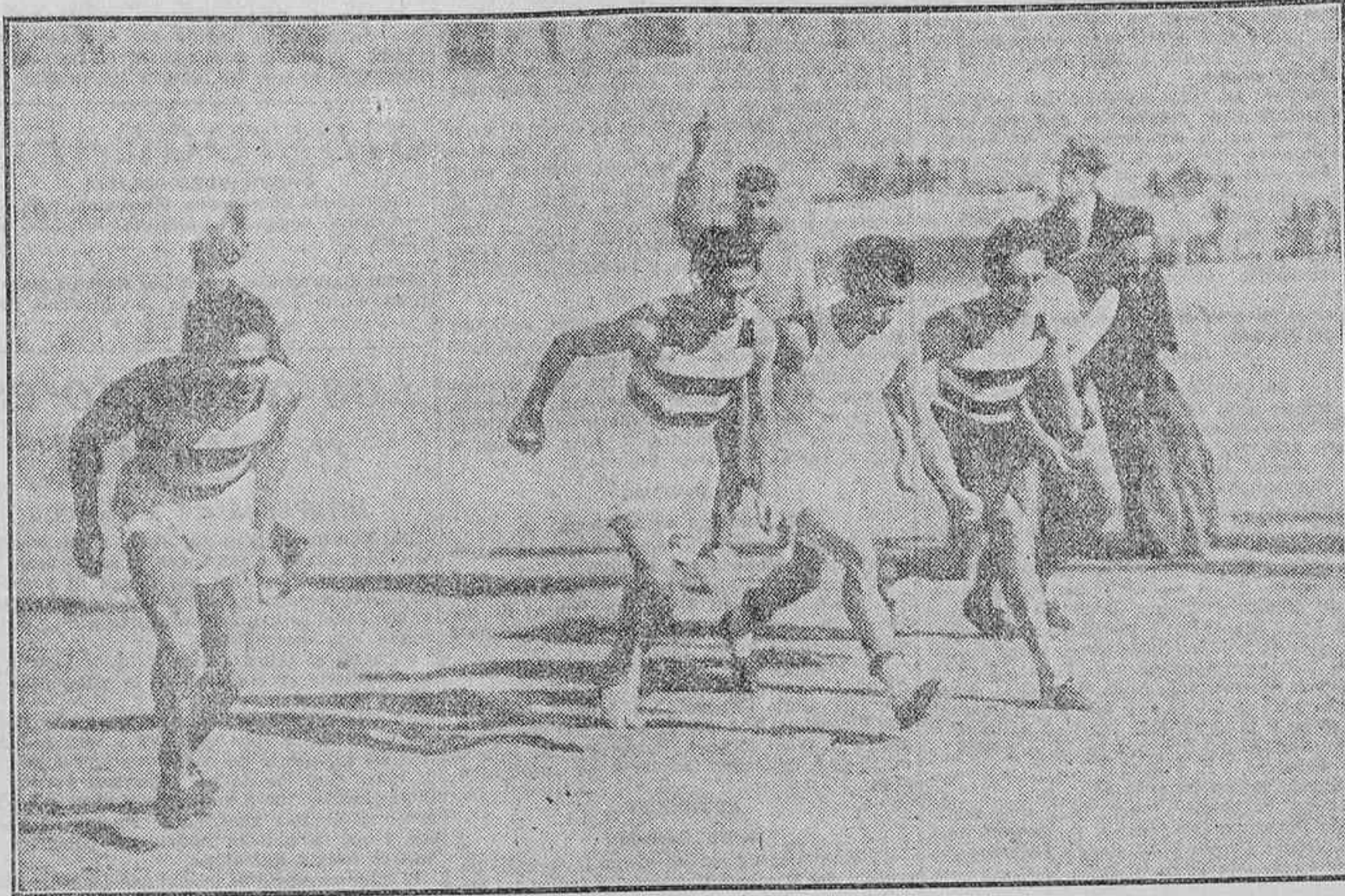
LOS CORREDORES QUE PARTICIPARON EN LA CARRERA DE 400 METROS, PREPARANDOSE PARA LA SALIDA