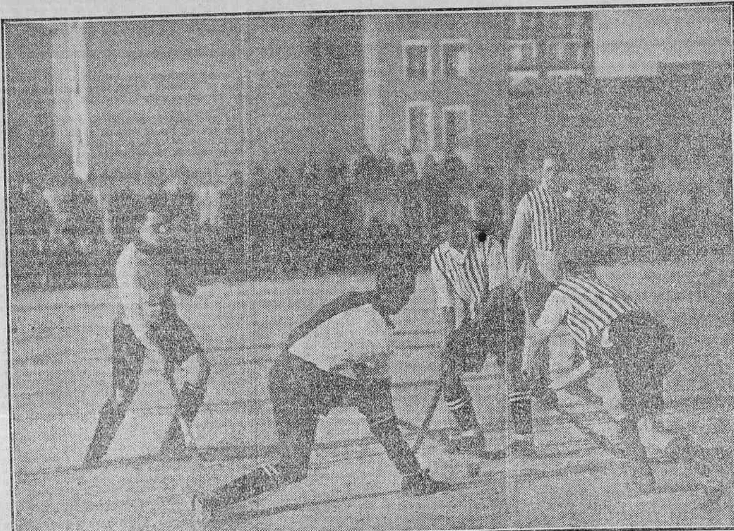
ARRIVO DE HOKEY, JUGADO EL SABADO ENTRE LOS EQUIPOS DE CULTURAL Y EL ATHLETIC EN EL QUE SE DISPUTABA EL CAMPEONATO DE CASTILLA