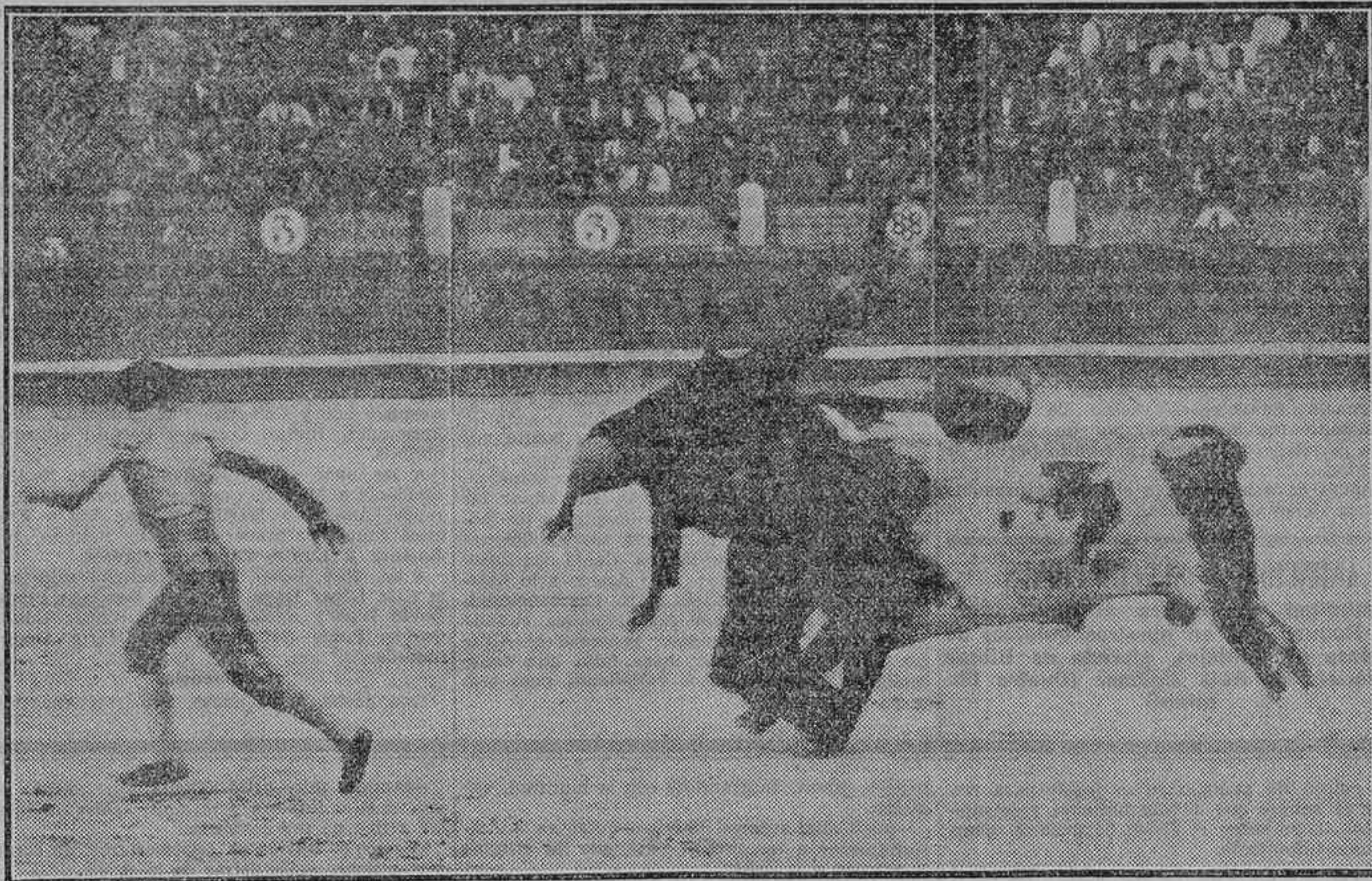
COGIDA DEL ESPONTANEO QUE ORIGINO LA PROTESTA DEL PUBLICO CONTRA MELLA

De Rafael García podemos apuntar varias verónicas bien ejecutadas, un quite y algún muleteado suelto. Lo demás, vulgar, de una vulgaridad aplastante. En su primer toro, por empeñarse en descabellar estando el toro vivo, tuvo que intentarlo hasta ocho veces y dió lugar a que le tocaren un aviso. El último toro se lidió con luz artificial.