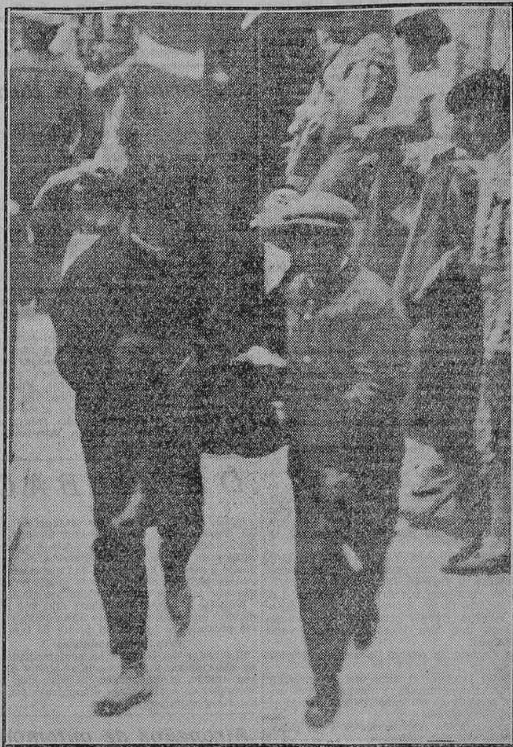
LAS ASISTENCIAS DE LA PLAZA LLEVANDOSE A LA ENFERMERIA AL ESPONTANEO QUE RESULTO GRAVEMENTE HERIDO EN LA CORRIDA DE AYER