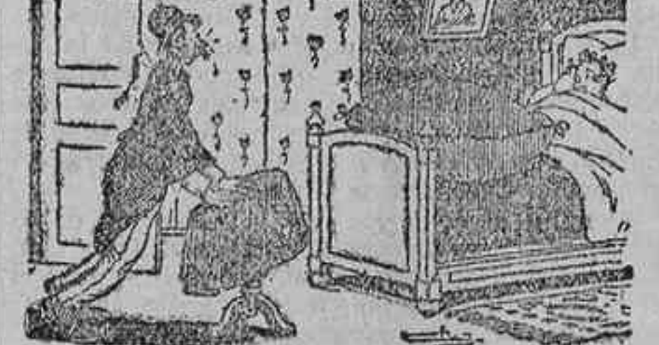
—¡Ay, Filomena! Ya no me amas, ¡me ves entrar en este estado y no me tiras nada! (Péle Méle.)

Torear desde la barrera El pasado domingo se celebró en Amiens un concurso de natación. Se trataba de atravesar el Somme.