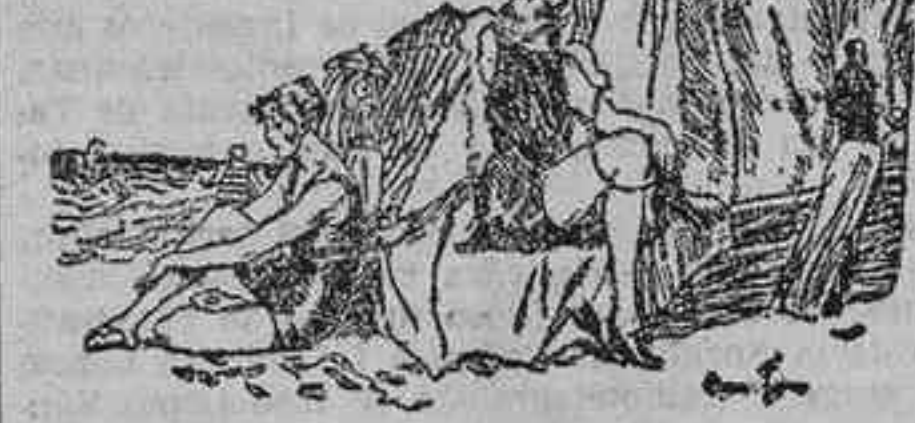
—¿Crees tú que el teniente López pedirá la mano de Juana?... —Puede ser. Se trata de un bravo. («London Opinion».)