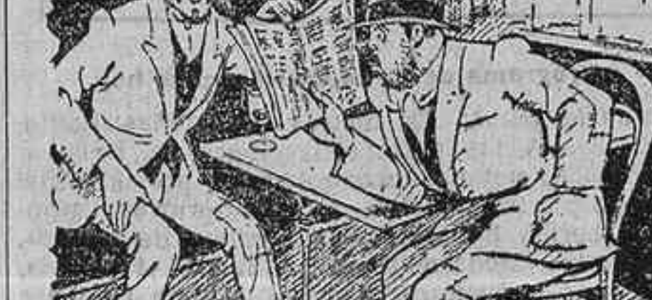
—Se habla de mí en este periódico. Verds, sun innoble individuo... («Sans Génie».)