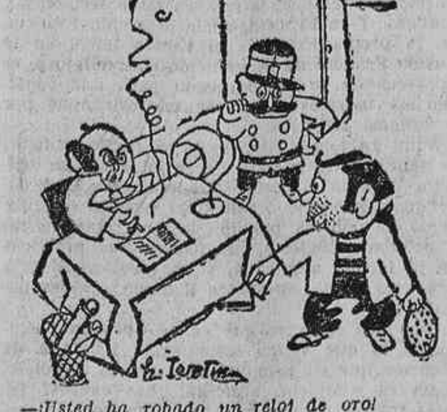
—¿Usted ha robado un reloj de oro? —Es absolutamente falso, y... en primer lugar, ¡el reloj no es de oro! («Candido».)