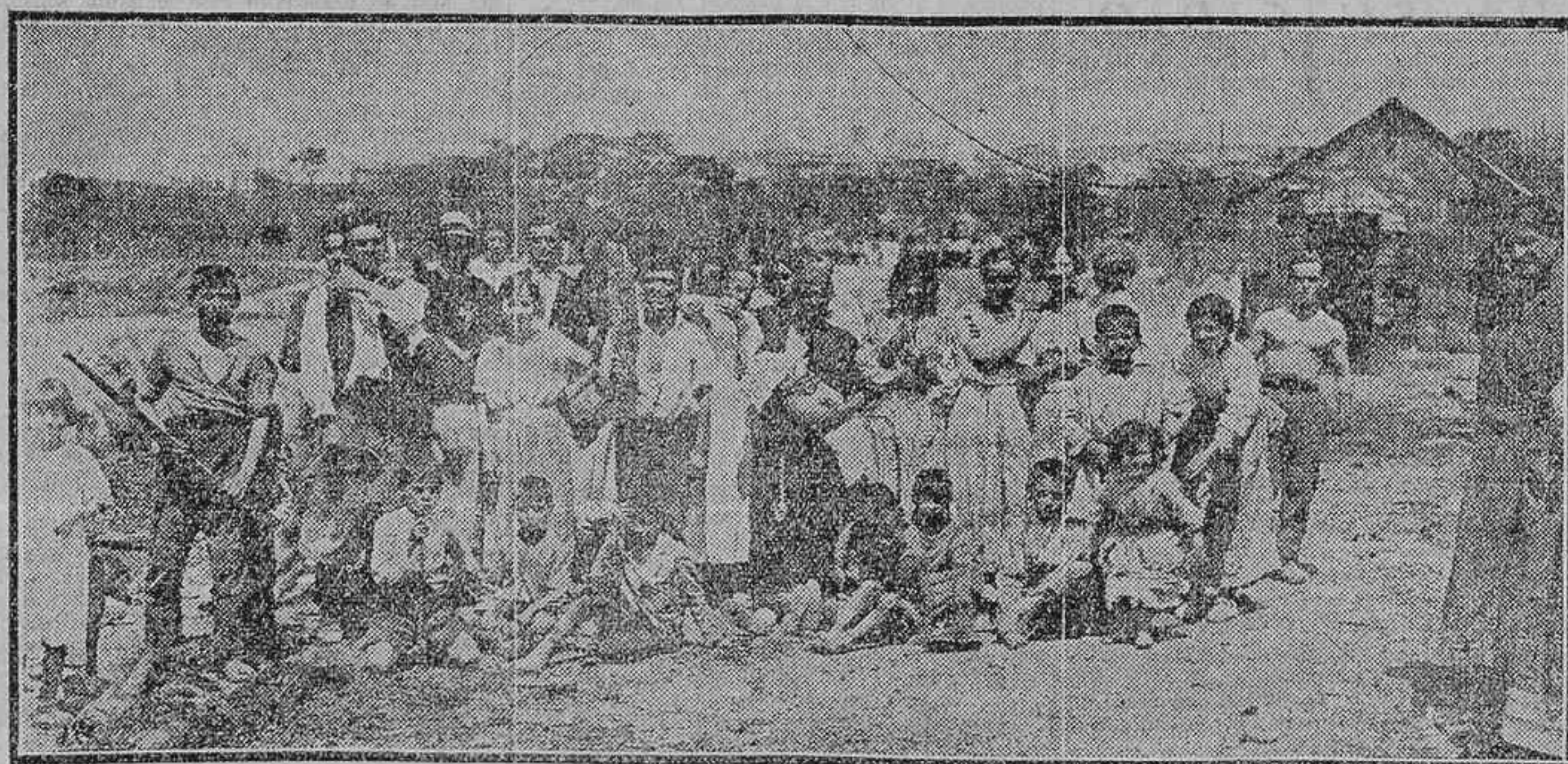
GRUPO DE FAMILIAS QUE SE HAN QUEDADO SIN ALBERGUE POR HABER SIDO DESTRUIDAS SUS CHOZAS POR UN INCENDIO