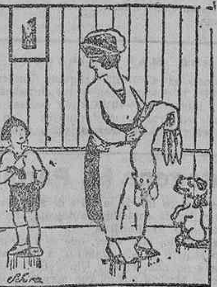
—Mamá, no olvides los bombones, por si lloras en el camino. (Matina.)