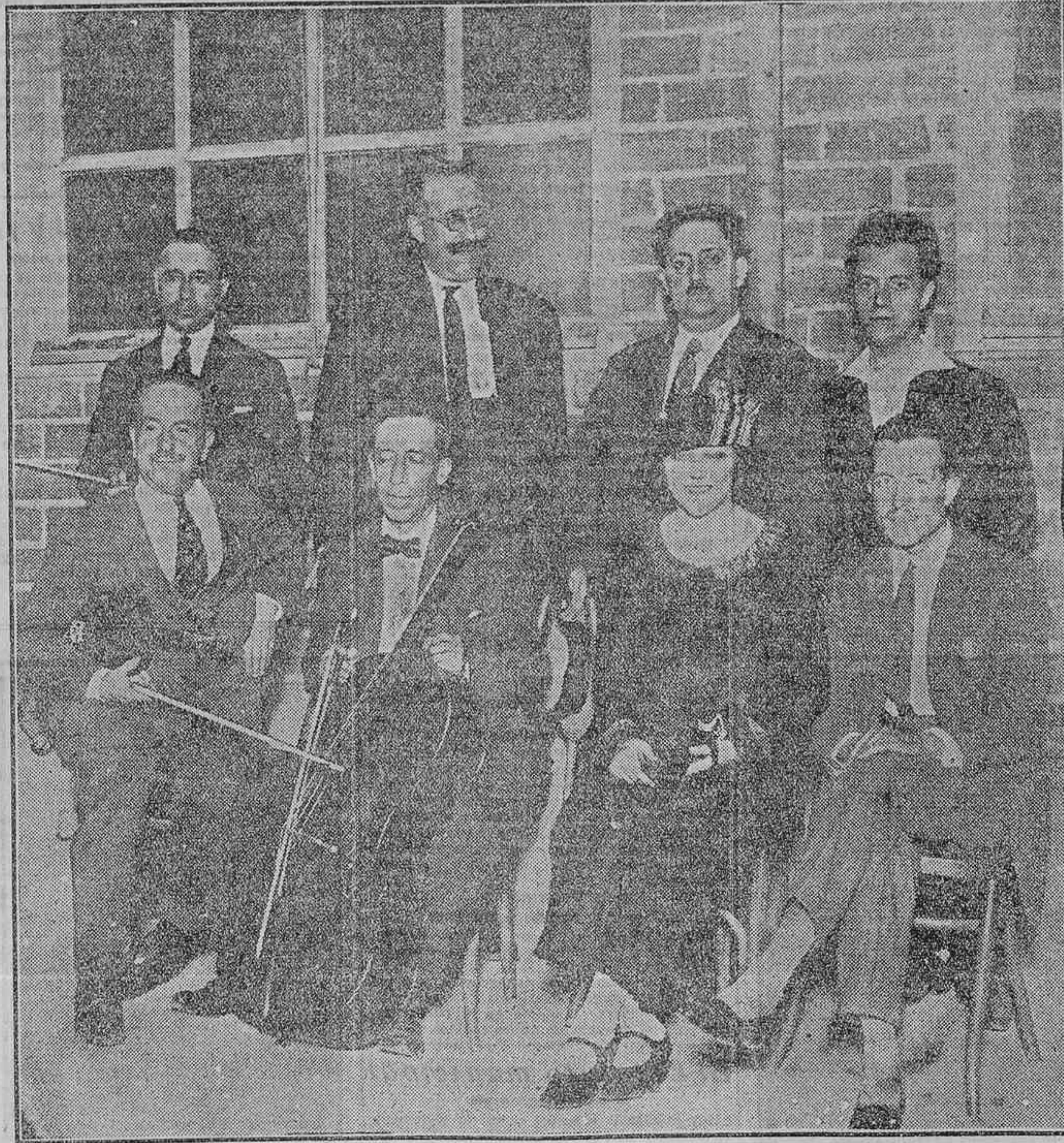
LOS EMINENTES ARTISTAS MARIA FERNANDA LADRON DE GUEVARA, JULIO FRANCÉS, RAFAEL RIVELLES, CONRADO DEL CAMPO, JOSE CUBILES, ODON GONZALEZ Y LUIS VILLA Y EL ILUSTRE LITERATO ALFONSO HERNANDEZ CATA