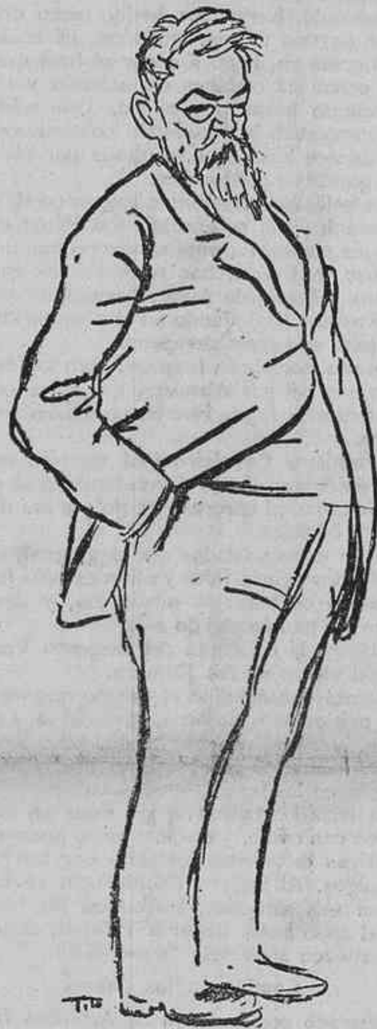
Es Sorolla el patriarca del glorioso arte español; su vieja retina abarca todas las luces del sol.

Cuanto creéis que pintar es exotismo o camelo, aprended de él a mirar nuestra tierra y nuestro cielo.