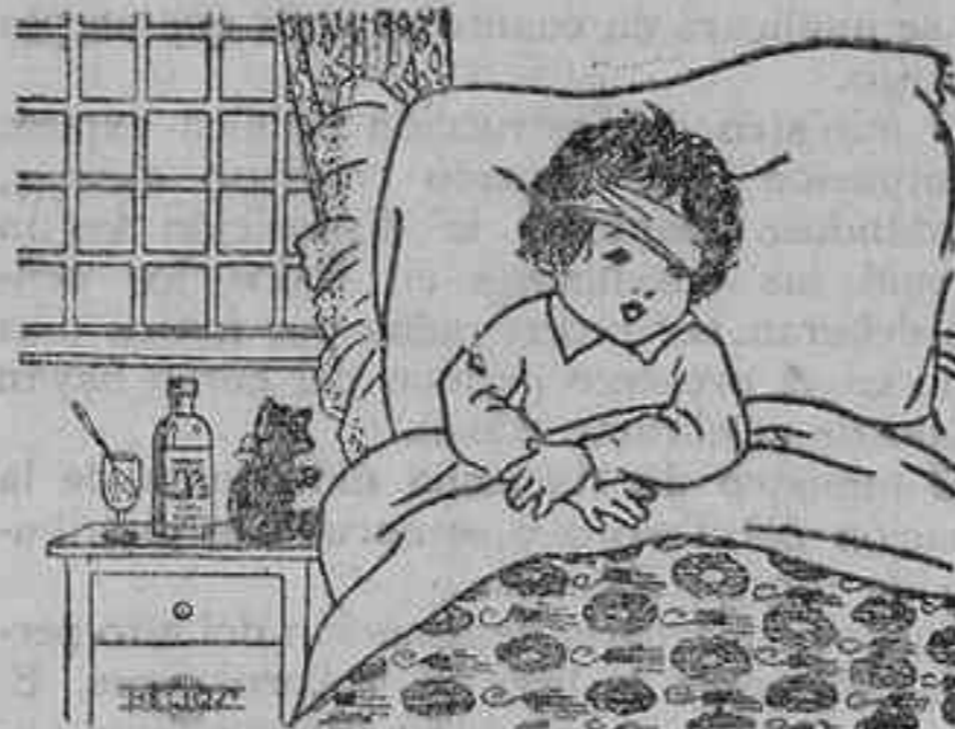
Manolito está en cama. ¿Qué tendrá Manolito?

Nota del Ateneo «Una vez más, ante sinceros llamamientos, el pueblo español responde con entusiasmos dignos de mejor suerte. Las manifestaciones que el Ateneo de Madrid organiza en toda España, y muy particularmente la que en Madrid se celebrará el domingo, diez a once de la mañana, servirá para que el país entero, sin distinción de matrices políticas, se declare dispuesto a exigir de los gobernantes el cumplimiento de