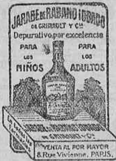
JARABE DE RABANO... PARA NIÑOS PARA ADULTOS

MACIZOS medidas corrientes ofrecen Sierra y Compañia Isabel la Católica, 16