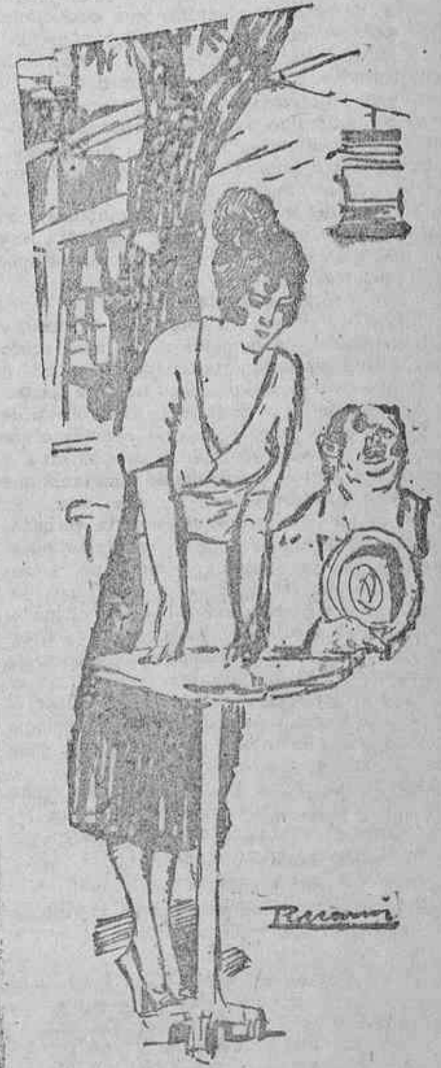
¿QUE VA A SER?

El distrito de Palacio es uno de los distritos más despoblados en esta época del verano, y bien se comprende, cuando es la corte la primera que se ausenta. Por eso decimos que esta clase de fiestas en tal lugar apenas