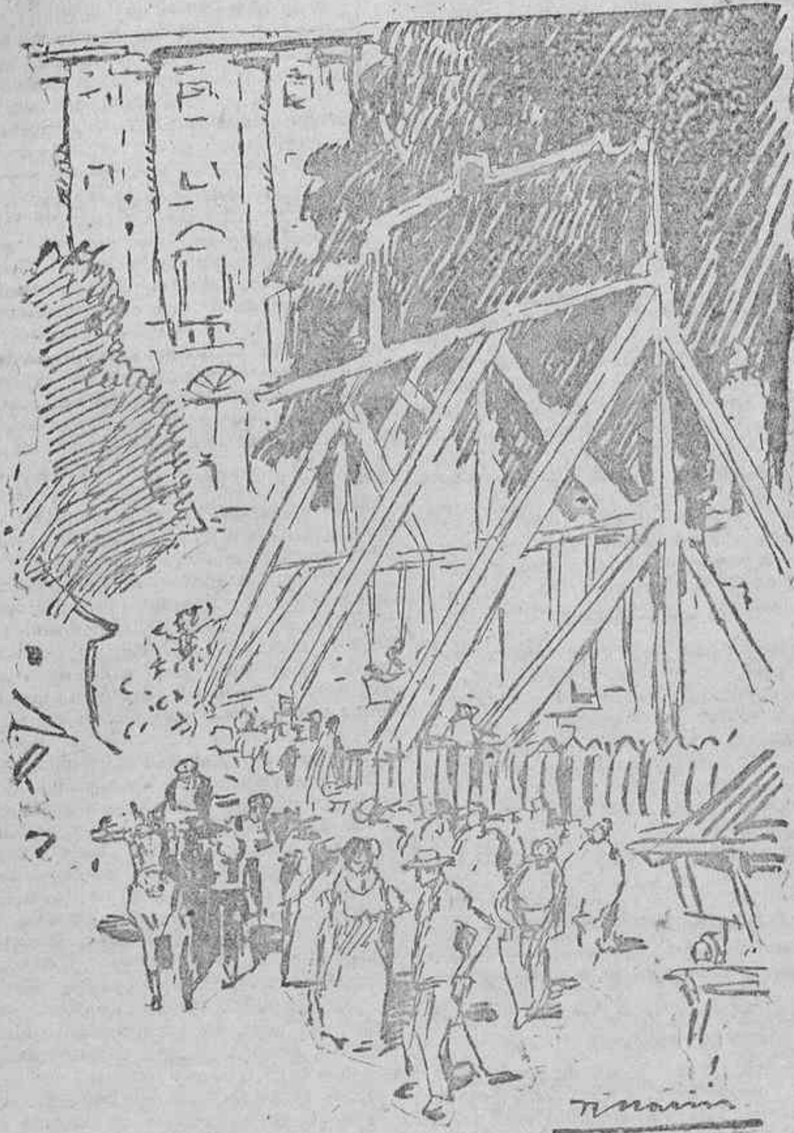
LOS CLASICOS COLUMPIOS