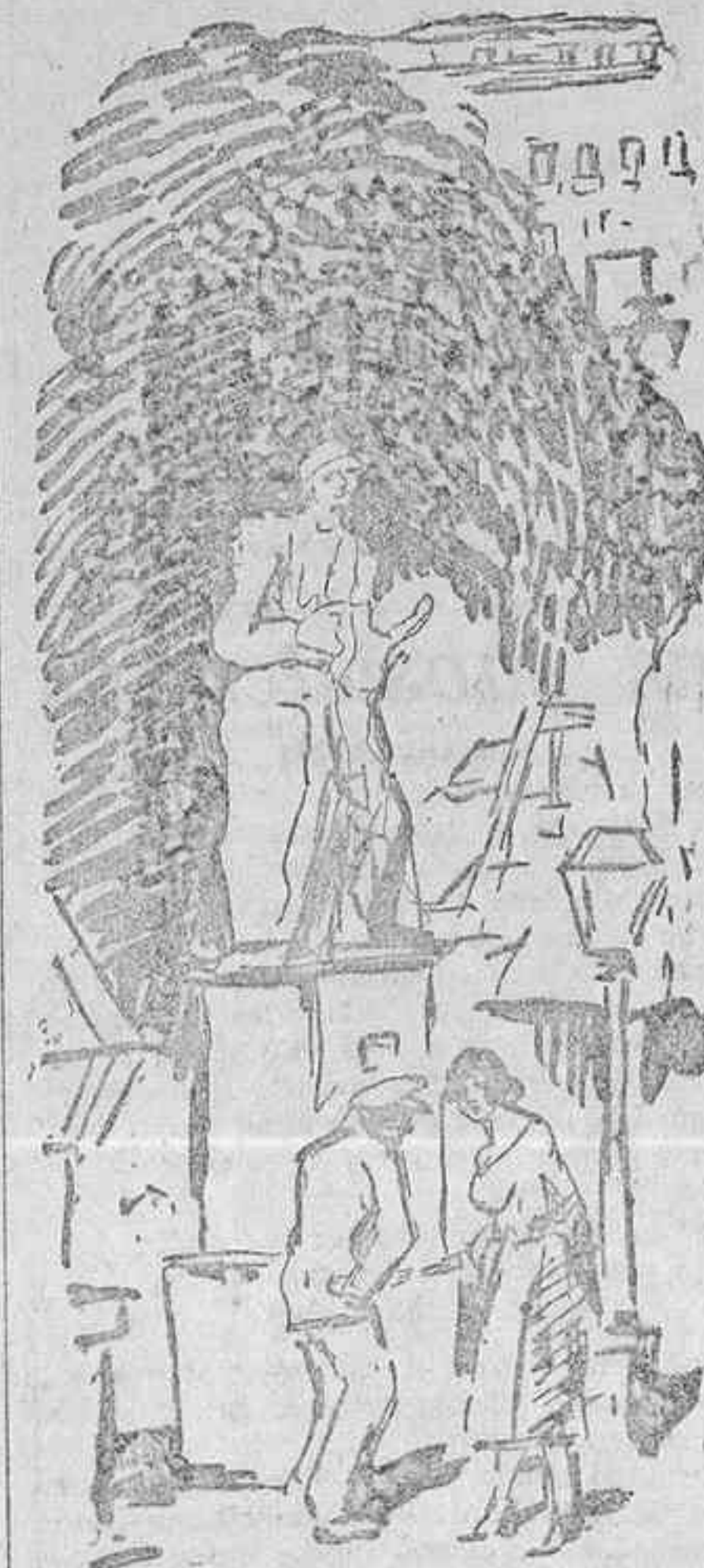
ATAULFO, ¿QUE LAS DAS?