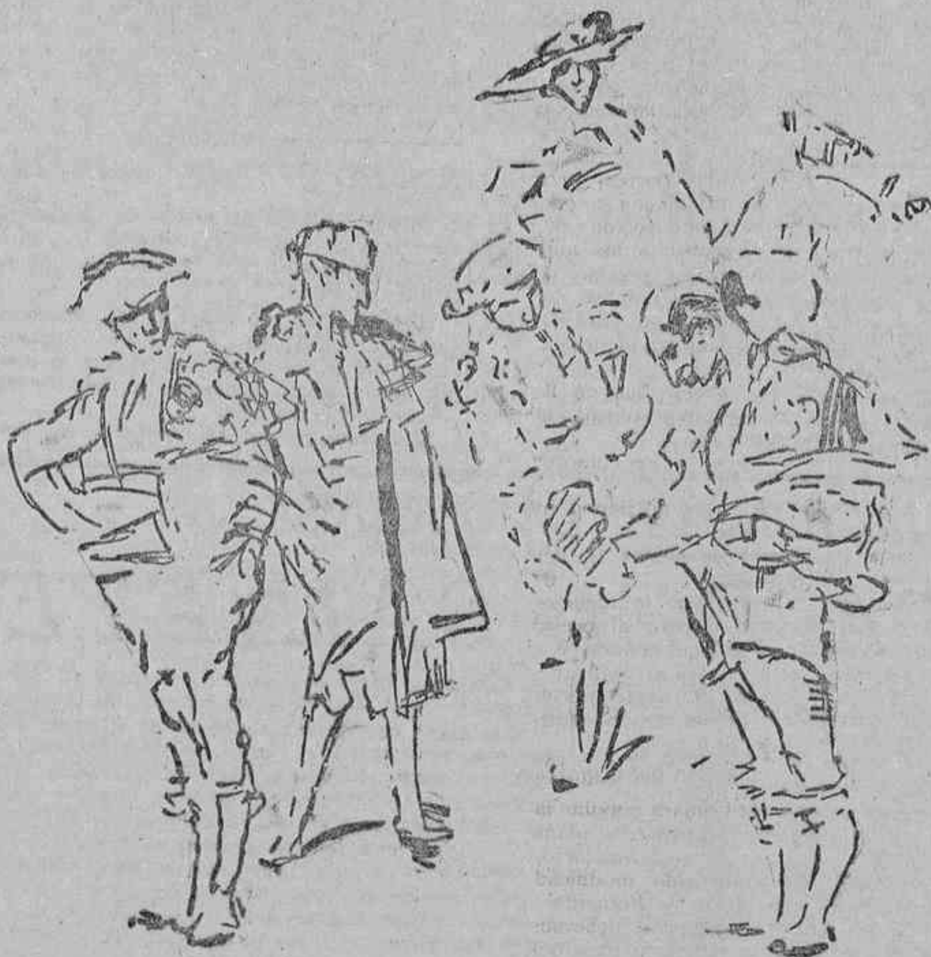
LA DE BENEFICENCIA