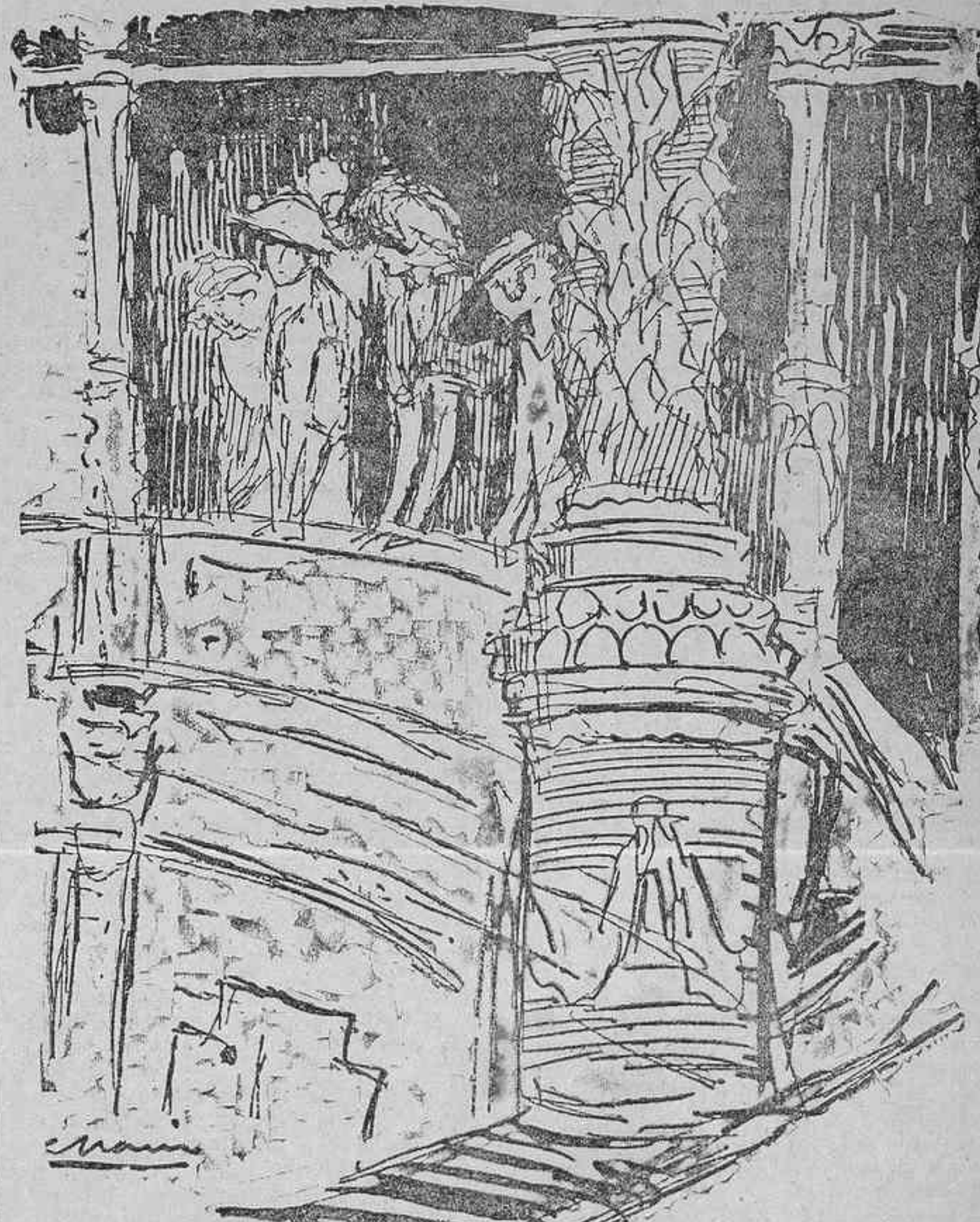
La desierta tribuna de los ex diputados y la de la Presidencia en el momento de la jura

Se ocupa del valor de nuestra moneda, que ha ido aminorando, y de la mala gestión del Gobierno, contribuyendo a esta depreciación, merced a las concesiones hechas al Banco de España. Esta labor la considera completamente contraria a la política que inició el se-