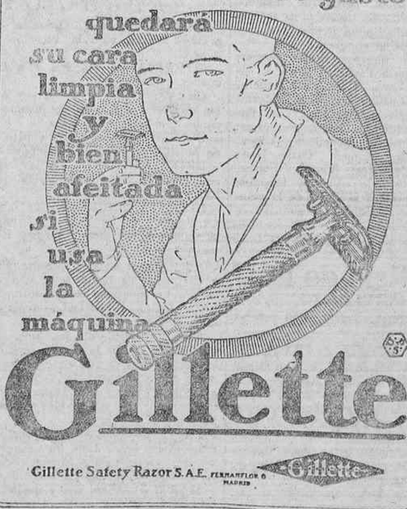
Gillette Safety Razor S.A.E. FERNANDEZ O. MADRID

En menos de dos minutos y con menos de dos céntimos de gasto quedará su cara limpia y bien afeitada si usa la máquina Gillette