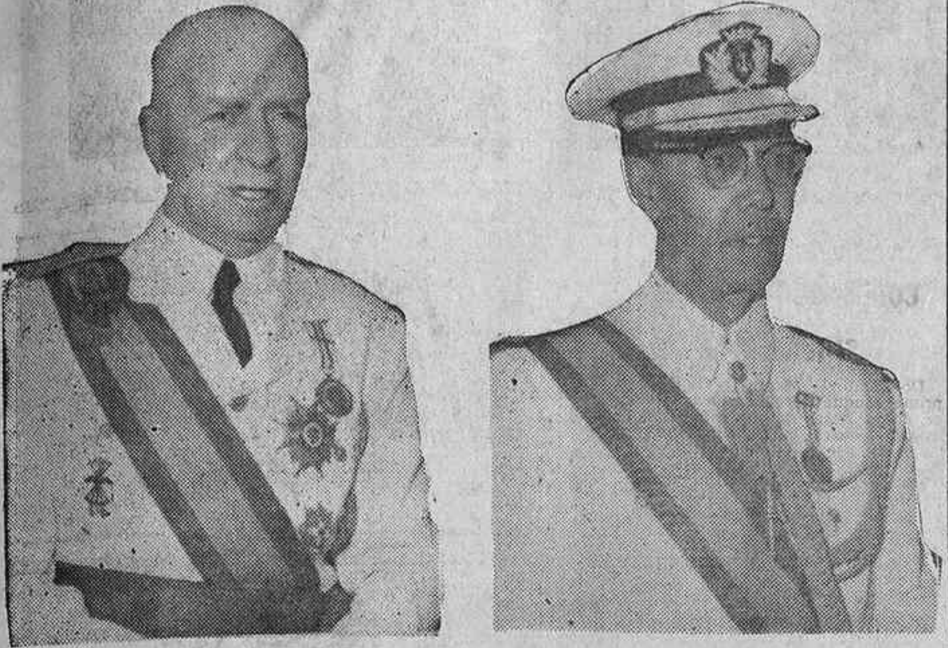
El ministro del Ejército, teniente general don Pablo Martín Alonso. Almirante don Pedro Nieto Antúnez, ministro de Marina.

FUERON RECIBIDOS EN AMBOS MINISTERIOS LOS DIRECTORES DE TODOS LOS MEDIOS INFORMATIVOS Y LOS CORRESPONSALES EXTRANJEROS