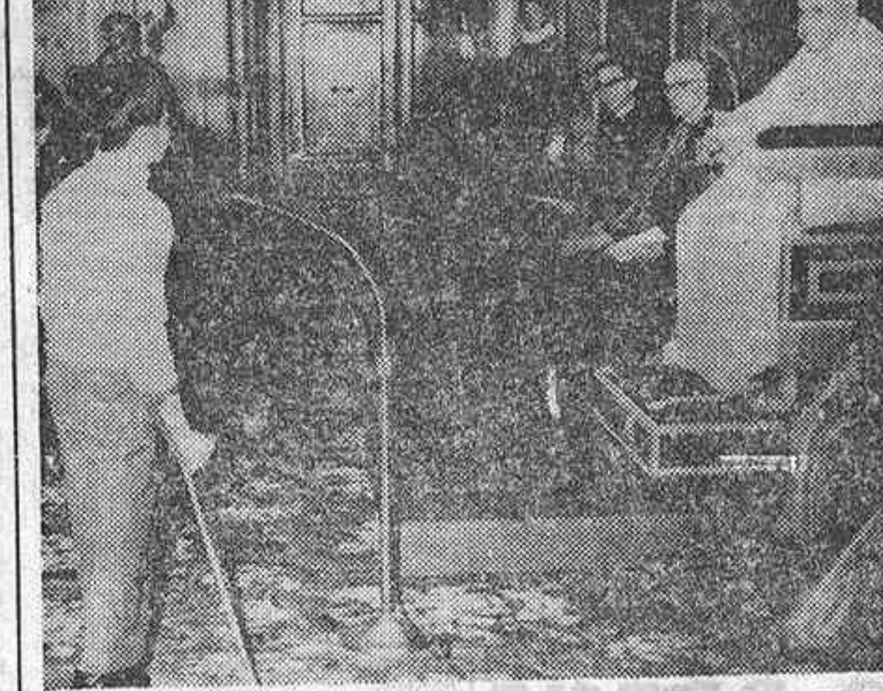
Con ocasión de las fiestas de Navidad, Su Santidad Juan XXIII recibió en audiencia especial a cien niños inválidos...

Treinta mil personas recibieron en la plaza de San Pedro la bendición del Pontífice