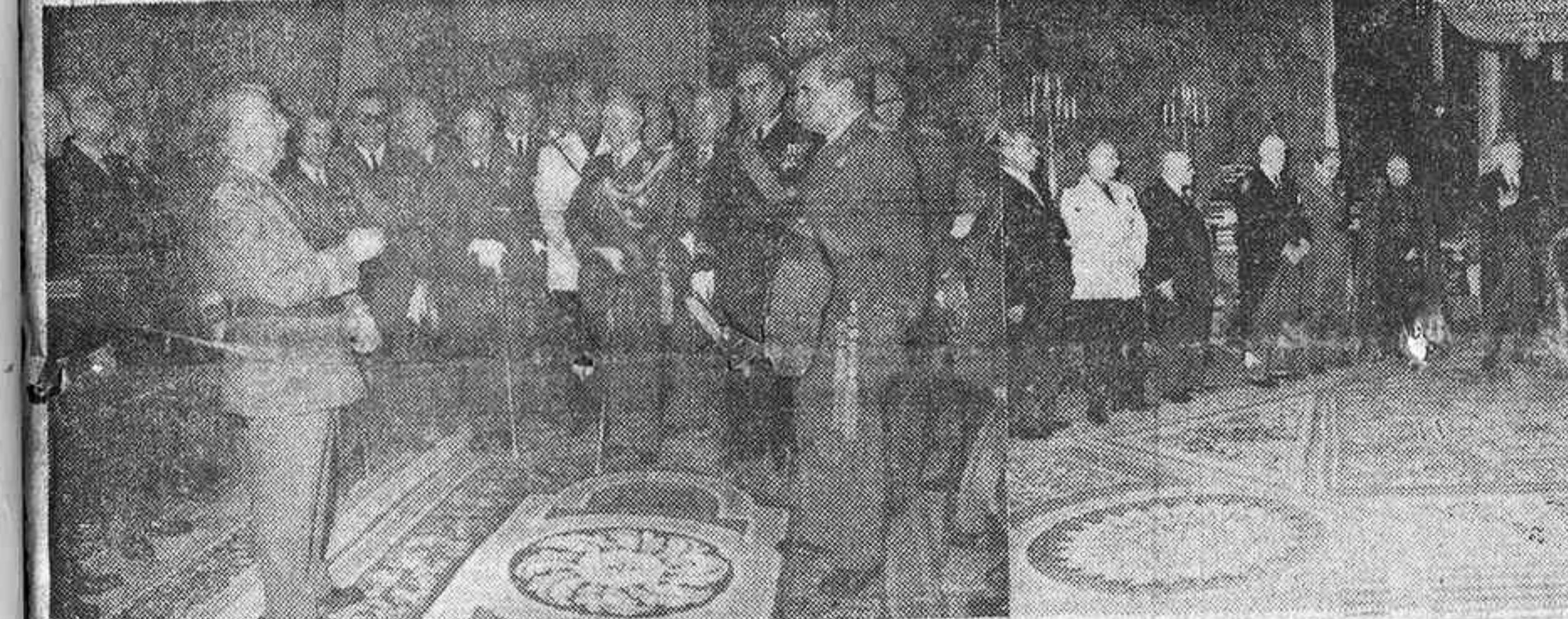
En la foto de la izquierda aparecen los ministros del Ejército, Marina y Aire, al frente de comisiones de las tres Armas, presididos por el vicepresidente del Gobierno, capitán general Muñoz Grandes...