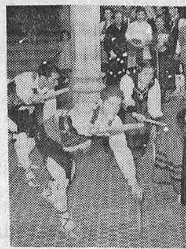
Entre los espectáculos que el Centro Segoviano ofrece a sus socios y simpatizantes de Madrid no faltan frecuentemente las típicas danzas del "paloteo", como la que recoge el grabado.