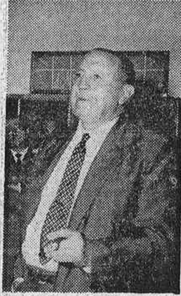
Don Santiago Bernabéu, presidente del Real Madrid.

Durante la proyección de la película «Historia de cinco Copas», siempre el cartel: «No hay billetes»