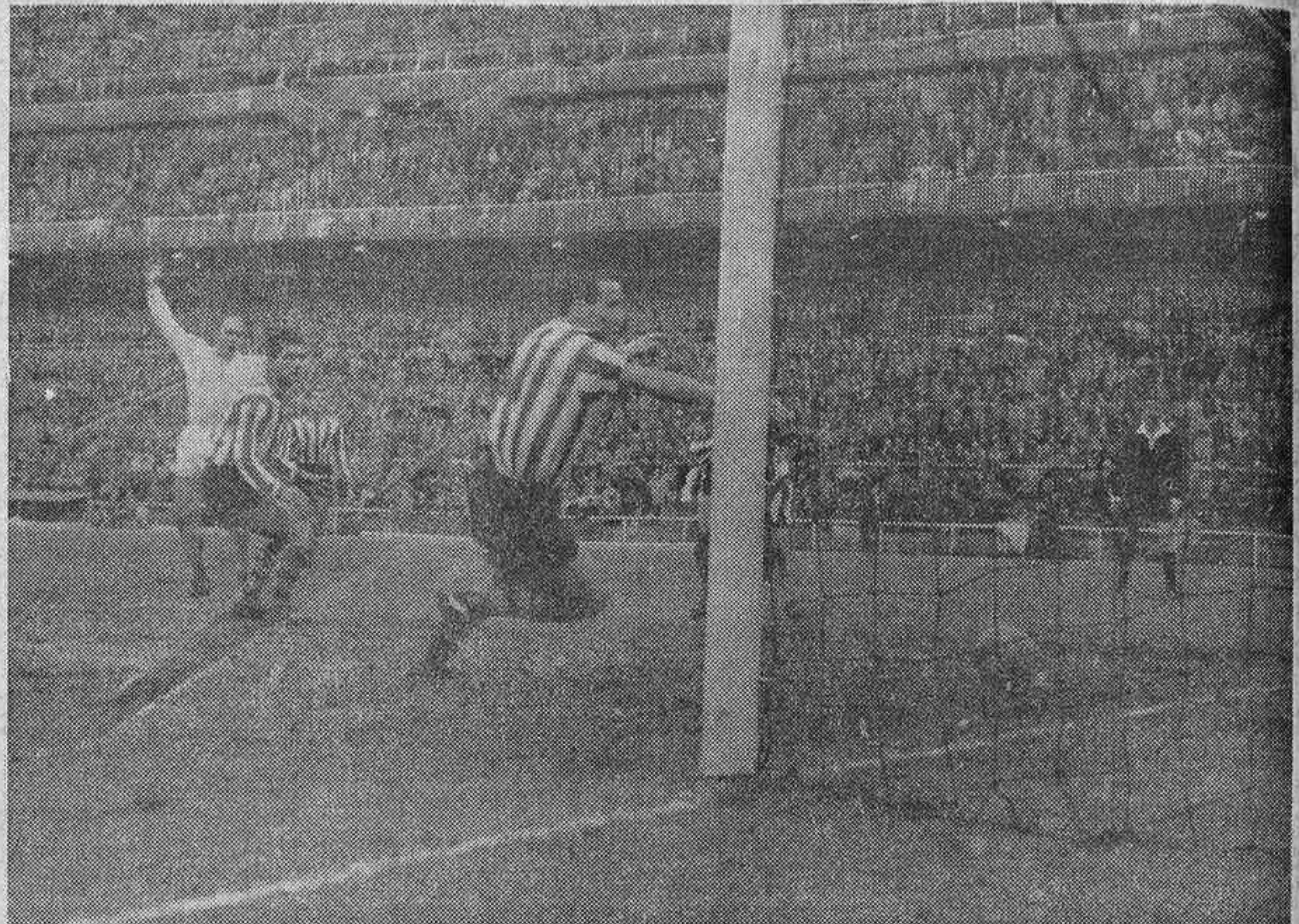
Comentarios a la puerta de los vestuarios...

Los informadores fueron obsequiados en los vestuarios del Bernabéu Se propuso el traspaso del interior Argoitia, pero el Atlético no necesita dinero