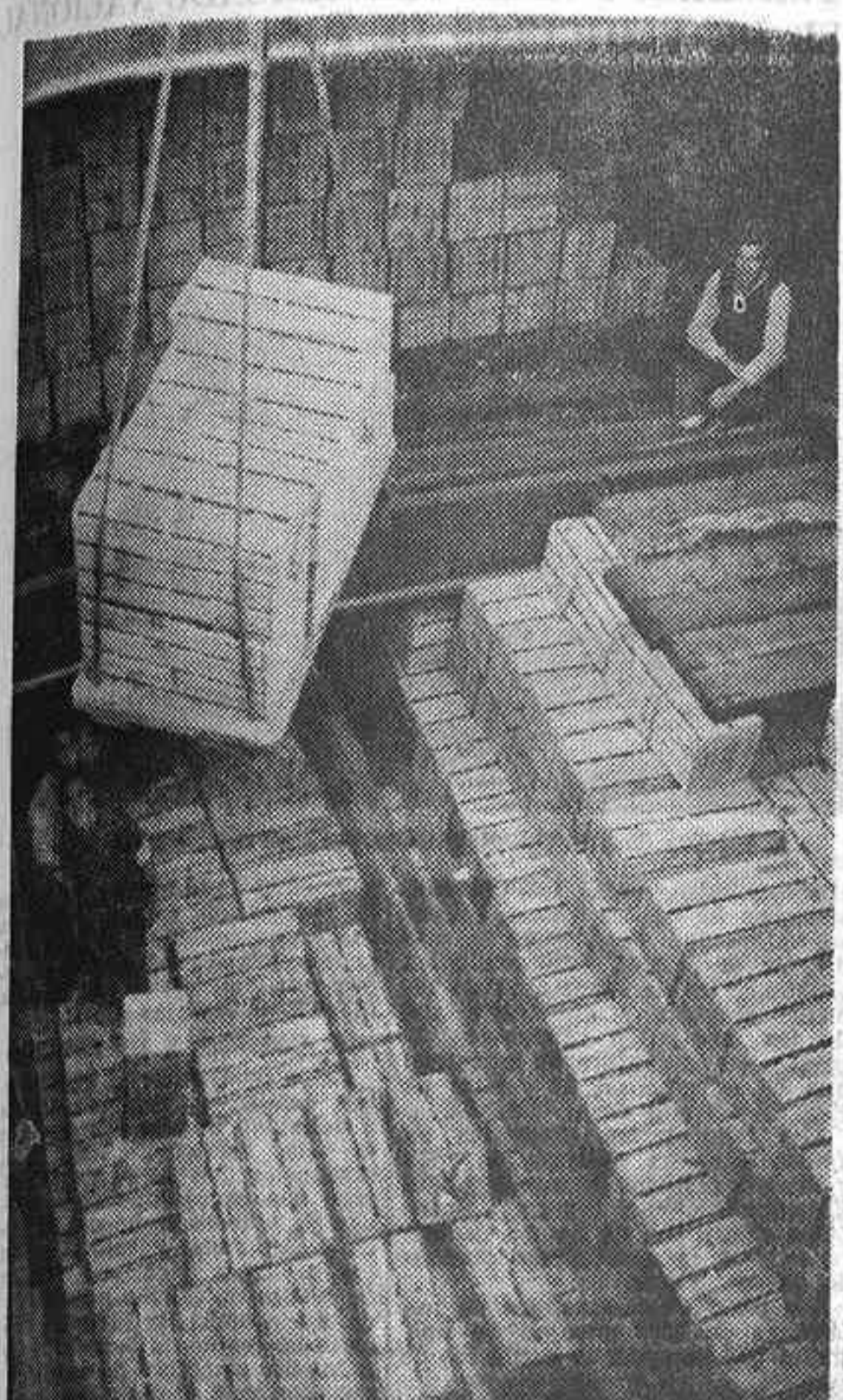
Carga de naranjas españolas en el litoral levantino con destino a los mercados europeos