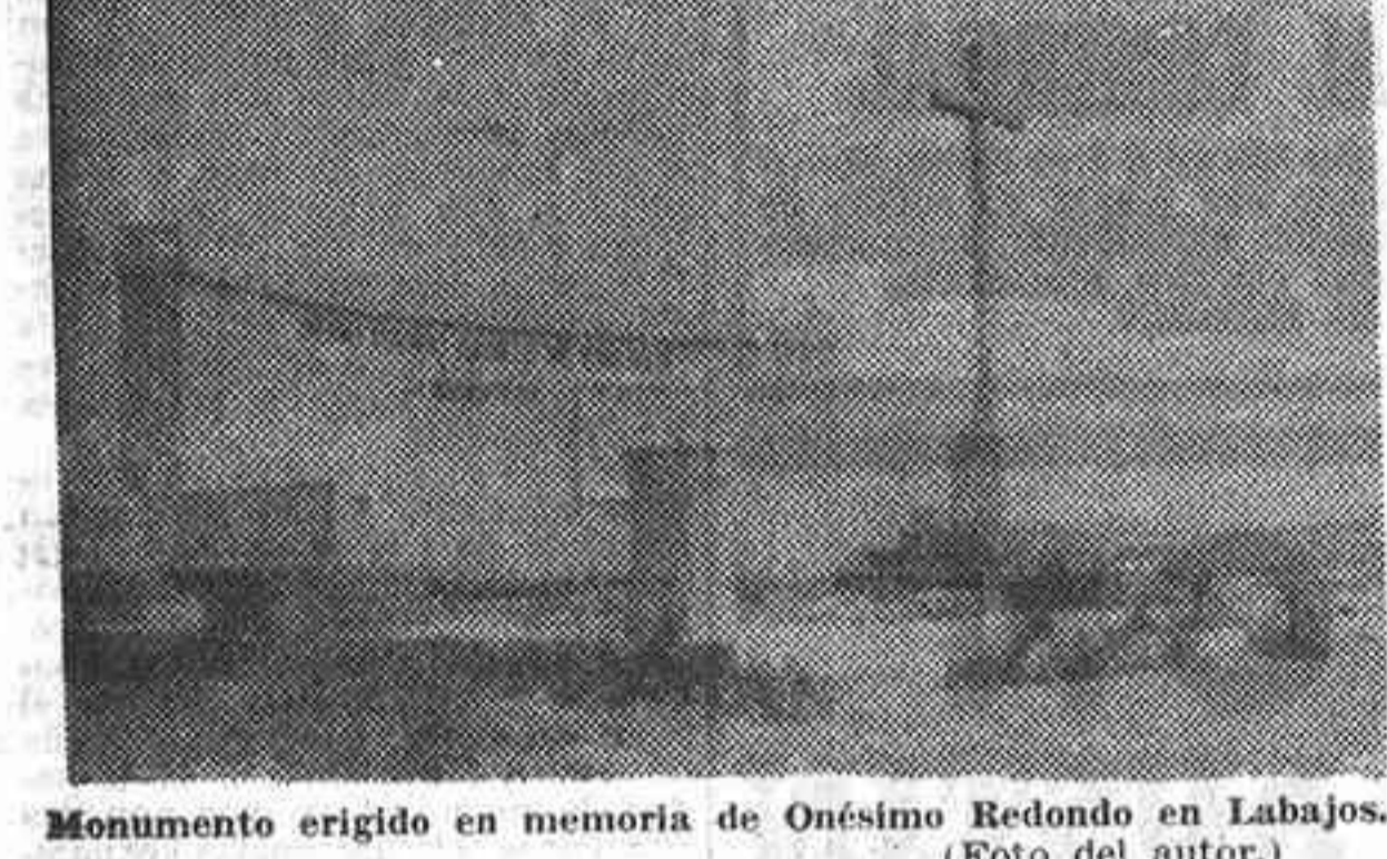
Monumento erigido en memoria de Onésimo Redondo en Labajos.