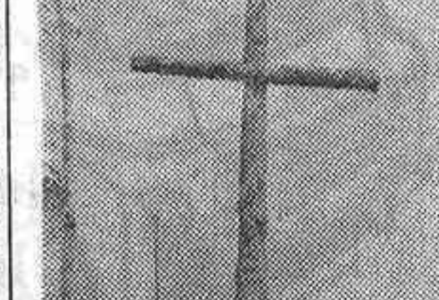
En el lugar exacto donde cayó muerto el capitán de las Falanges de Castilla...