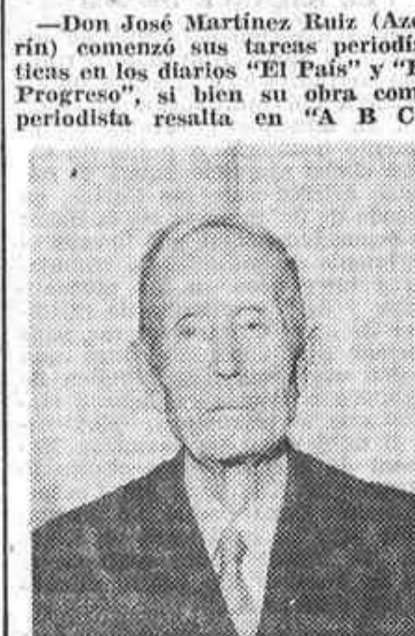
Don José Martínez Ruiz (Azorín), que ha recibido el nombramiento de periodista de honor