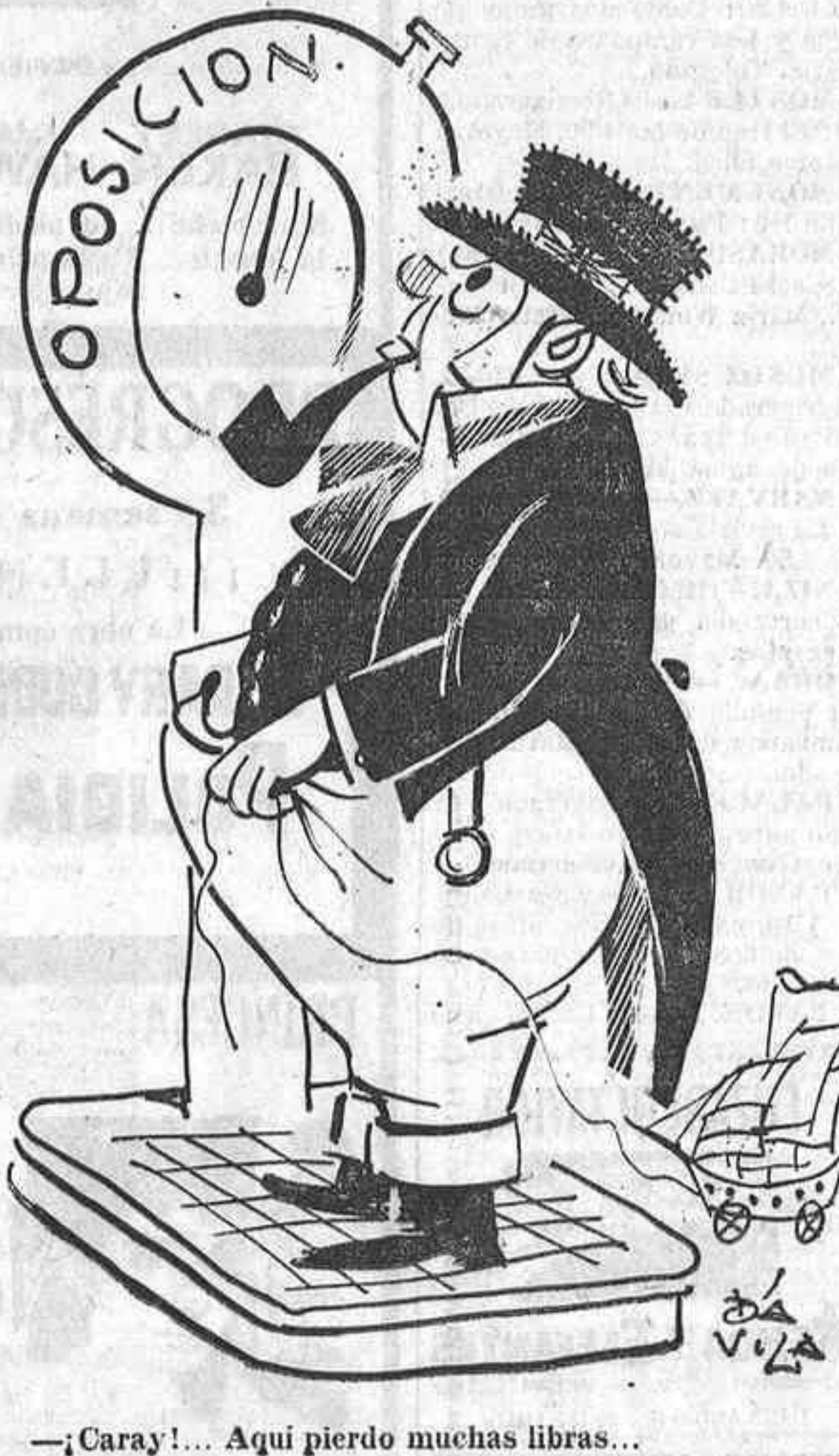
—Caray!... Aquí pierdo muchas libras...