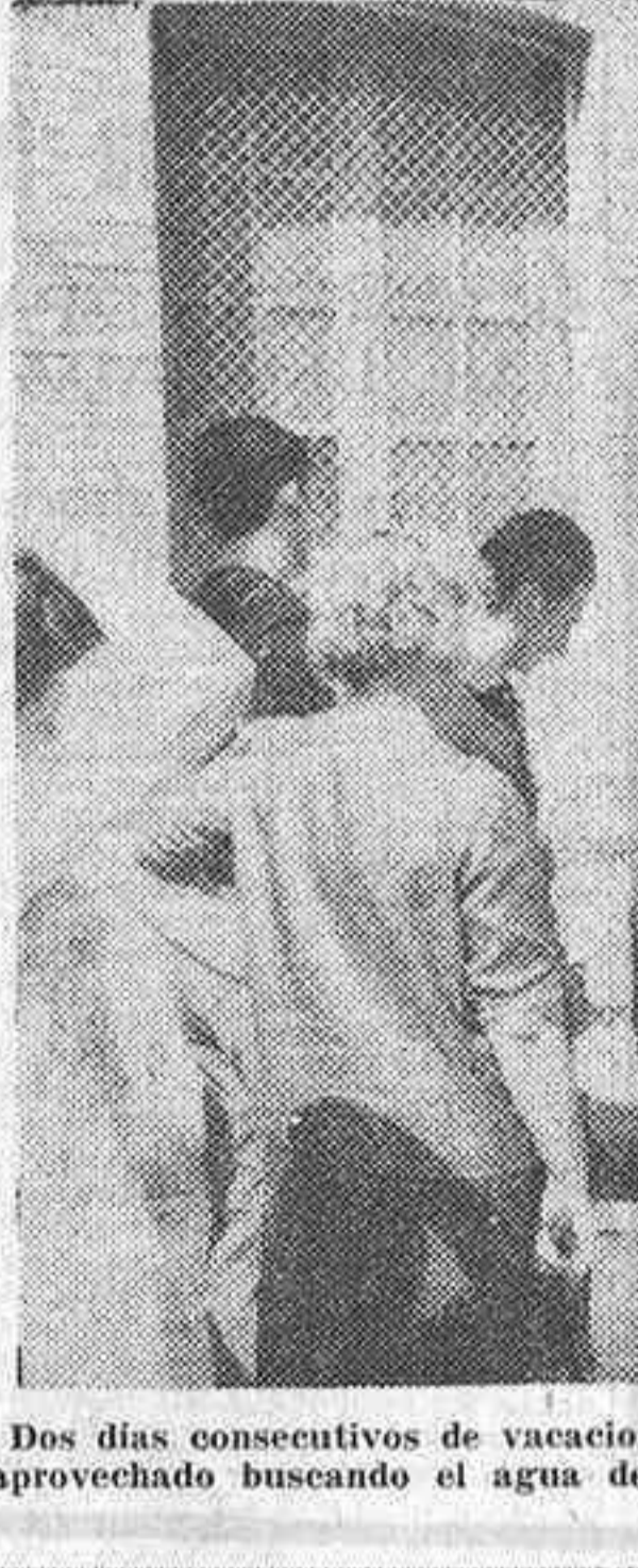
Dos días consecutivos de vacaciones... el 18 de julio y ayer, domingo...