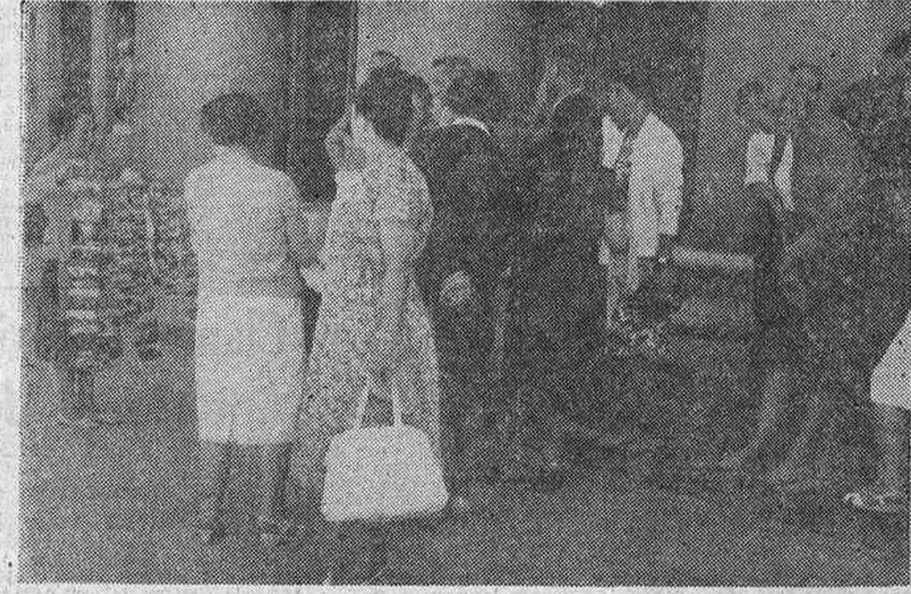
Mientras algunos de los visitantes al Museo del Prado—máxima atracción para el turista extranjero—conversan entre sí, otros contemplan la variedad de postales que, sobre la ciudad y sus monumentos, les ofrece una vendedora ambulante.

Casi medio millón de personas sale mensualmente de la capital