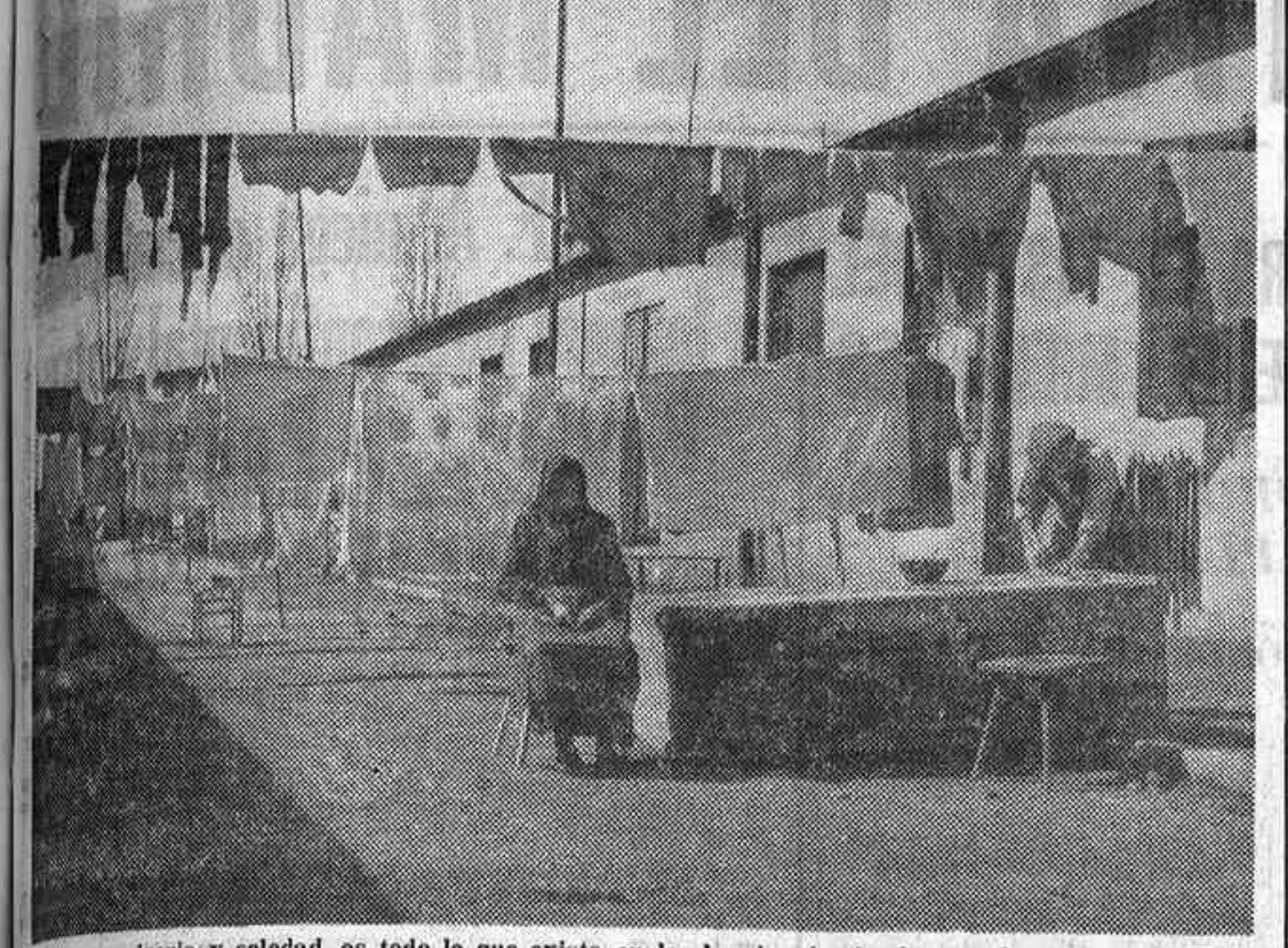
Barracas, miseria y soledad, es todo lo que existe en los barrios dominados por los comunistas en el Berlín oriental.