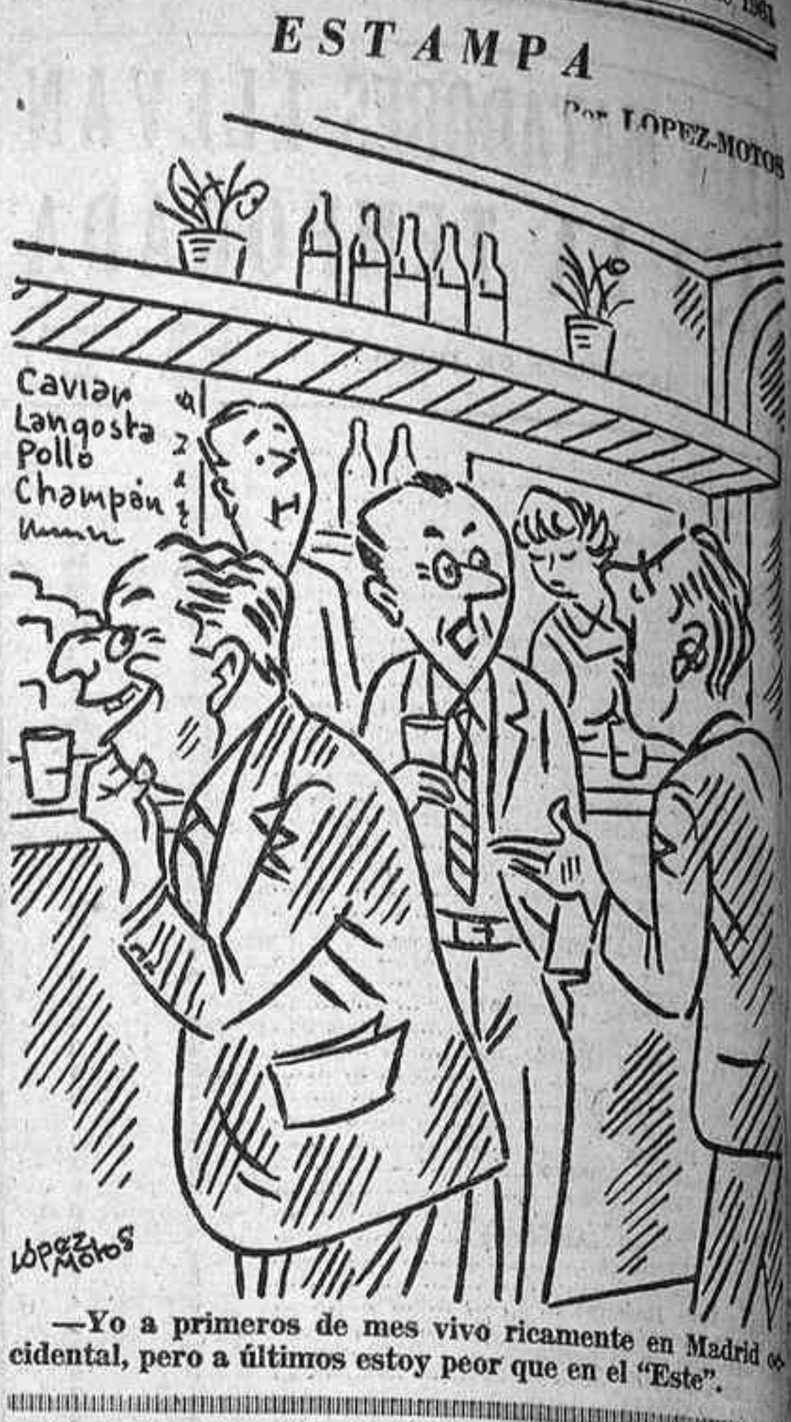
—Yo a primeros de mes vivo ricamente en Madrid occidental, pero a últimos estoy peor que en el "Este".

Señores comerciantes e industriales, vendedores de automóviles, motos y maquinaria: COMPANOS los contratos de ventas a plazos que formalicen y las letras de cambio que los integren.